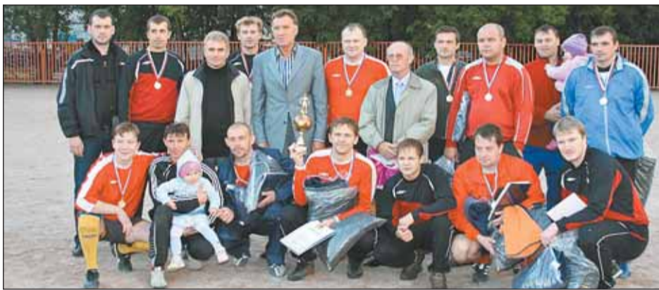
Футбольная команда «Пьянченца» завоевала Кубок главы управы