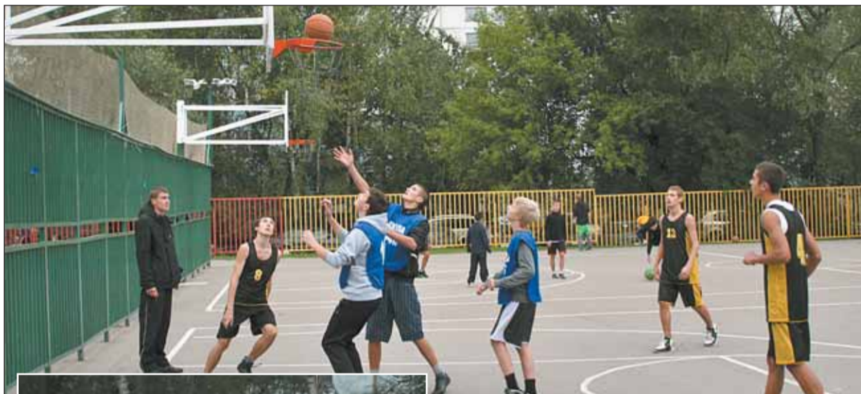
Идет матч по стритболу

Тон задали спринтеры в дистанции на 100 метров.