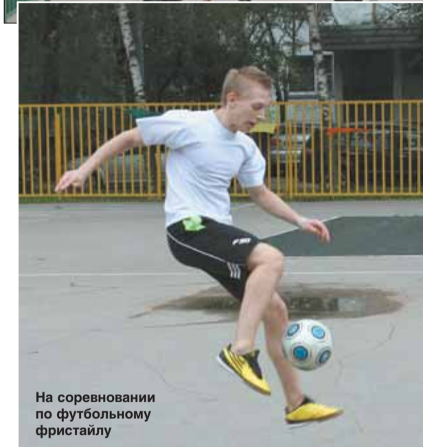
На соревновании по футболному фристайлу

на четырех площадках развернули борьбу за 1-е место футболисты, волейболисты, стритболисты (тот же баскетбол, но в каждой команде играют по 3 человека). Все команды показали неплохую игру. Первыми в футболе стала команда школы №655, в волейболе — ЦО №166, в стритболе — ЦО №1430. Победители покинули площадку с мячом в руках, а обладатели 3-го места по футболу получили наколенники.