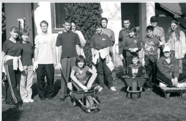
Szentmihály fiataljai a lakóhelyünk takarítását végezték

2007 márciusában több mint 1000 fiatal országszer- te 106 projektet valósított meg a három nap alatt. Mi- ben segíthettek a fiatalok? Idősek látogatása, tavaszi takarításban segítség, kertészkedés, temető-takarítás, játsszótér felújítás, óvoda udvarának takarítása stb.