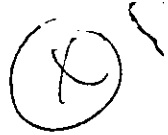
CUADRO N. 3.-

POBLACION TOTAL POR AREA URBANA Y RURAL Y SEXO, SEGUN GRUPOS QUINQUENALES Y AÑOS SIMPLES DE EDAD.