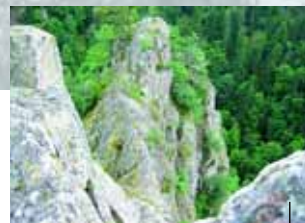
Felsenbiotope im Schlüchtal