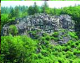
Schwimmbadfels, Todtnauer Klettergarten