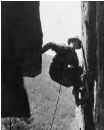
Im alten Ostwandkamin am Kandelfels, 1950

Viele der kühnen Taten unserer Vorfahren können von den heutigen Kletterern nicht wiederholt werden. Denn einige der großen Felsen des Südschwarzwaldes sind inzwischen für den Klettersport gesperrt, z. B. das gesamte Höllental, die Feldseefelsen und der Scharfenstein im Münstertal. Die für das Klettern freigegebenen Felsen wurden in vielen Stunden ehrenamtlicher Arbeit durch Kletterer der IG Klettern Südschwarzwald, der DAV Sektionen und einiger lokaler Klettervereine auf den heute üblichen Absicherungsstandard gebracht. Die Zustiegswege wurden saniert, Abseilmöglichkeiten und Umlenkpunkte eingerichtet und Infotafeln über Klettern und Naturschutz aufgestellt.