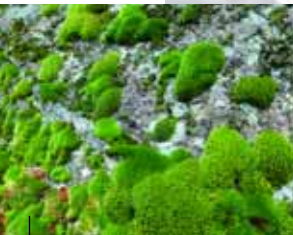
Moosbewuchs in Felswand