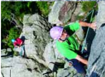
Seilschaft in der Westwand