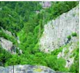
Felandschaft im Schlüchtal