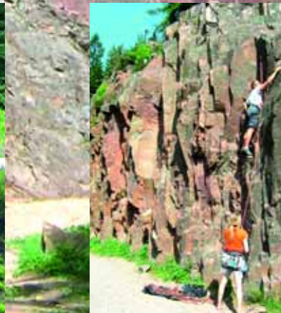
Genussvolles Klettern am Windbergfels