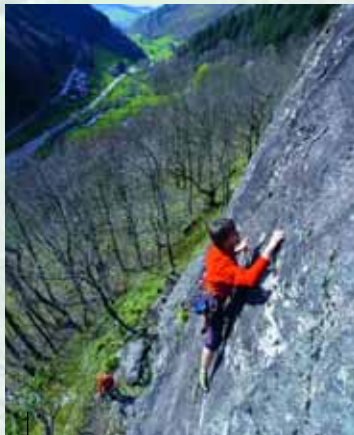
Sportklettern über dem Zastlertal

Mit dem PKW vor der Brücke zum Bauernhof parken. Straße zum Hof bitte freihalten! Weitere Parkplätze gibt es talabwärts.