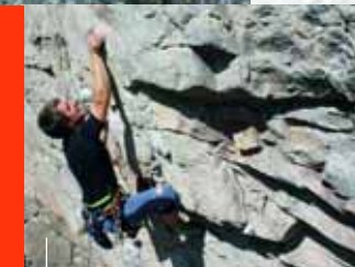
Klettern im Granitporphyr, Schwedenfelsen