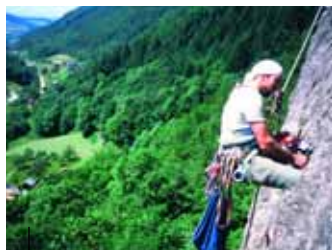
Sanierung der Sicherungshaken