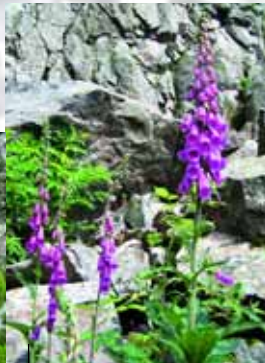
Roter Fingerhut in Blockhalde