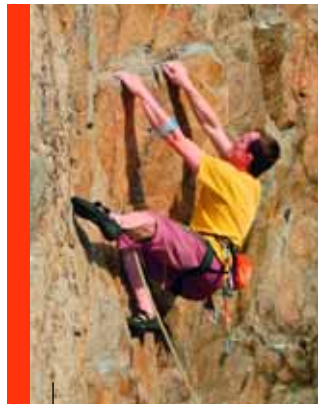
Sportklettern am Falkenstein

Silikate: Wichtige Gruppe von Mineralen wie Quarz, Feldspat und Glimmer, Hauptbestandteile von Graniten und Gneisen.