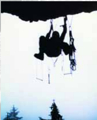
Technisches Klettern am alten Dach

50 Routen, vorwiegend im leichten und mittleren Schwierigkeitsgrad. Das Routenspektrum reicht vom 3. bis zum 8. Grad. Die Rückkehr zu den Einstiegen erfolgt durch 2 x 20 m oder 1 x 30 m Abseilen. Bitte bei „Gegenverkehr“ rücksichtsvoll abseilen.