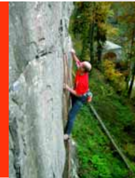
Sportklettern an der Wasserschloßfluh