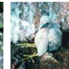
Junger Wanderfalke im Horst