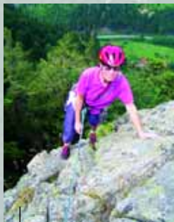
Auf dem Bauerntürmle