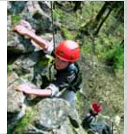
Jugend am Fels