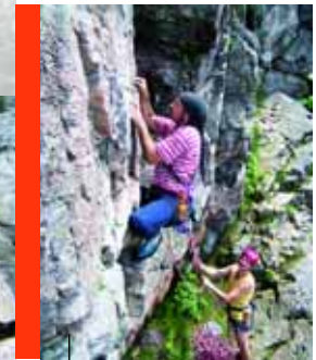
Klettergenuss am Kandelfelsen