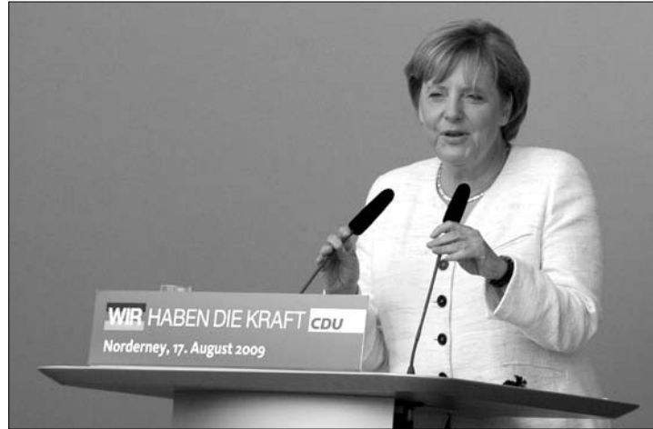
Bundeskanzlerin Angela Merkel beim Beginn ihrer rund 45-minütigen Rede auf dem Kurplatz.

(vel) – Noch kurz vor 17 Uhr traf Bundeskanzlerin Angela Merkel gestern auf dem Norderneyer Kurplatz ein und bahnte sich den Weg durch die Menschen zur Orchestermuschel, während der Song „Start me up“ von den Rolling Stones durch die Riesenlautsprecher dröhnte.