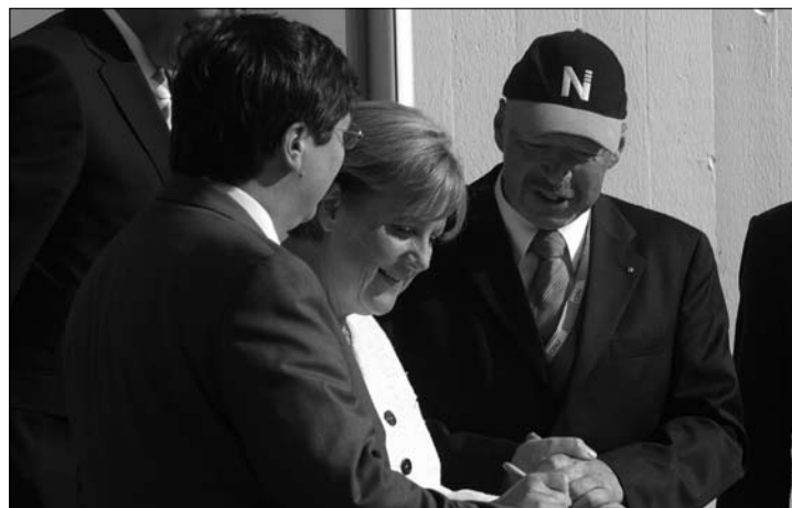
Bundeskanzlerin Merkel mit Bürgermeister Ludwig Salverius (re.) und Reinhard Hegewald (li.) beim Eintrag in das goldene Buch der Stadt Norderney.