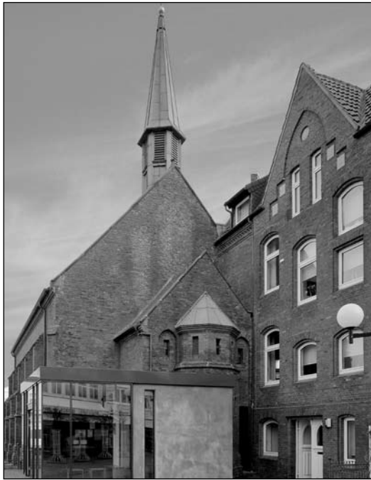
Die katholische Pfarrgemeinde St. Ludgerus plant die Feier der Firmung für das Jahr 2010. Auch Erwachsene, die noch gefirmt werden wollen, können sich bei Sibylle Hartong (Tel. 04932/456) melden

sich bis Mittwoch, 19. August, schriftlich melden. Auch Erwachsene, die noch gefirmt werden wollen, können sich bei Sibylle Hartong unter der Telefonnummer