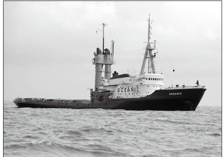
Die „Oceanic“ ist seit 2001 vor Norderney stationiert.

Die „Oceanic“, die vom Nordstrand aus zu sehen ist, ist seit 1996 im Auftrag des BMVBS in der deutschen Bucht stationiert und seit 2001 vor Norderney. Sie ist mit zwölf Mann und einem vierköpfigen Boardingteam dauerhaft besetzt. Für die Charterung und die Besatzung stellt der Bund für zehn Jahre bis zu 114 Millionen Euro zur Verfügung. Der neue Schlepper soll zum 1. Januar 2011 vor Norderney stationiert werden. Er soll eine Geschwindigkeit von 19,5 Knoten bei einem Tiefgang von sechs Metern erreichen.