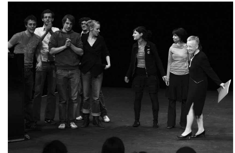
Preis der Studierenden für » Living in Oblivion « der Hochschule der Künste Bern

Um zum Schluss zu kommen, wünsche ich Ihnen von ganzem Herzen hier oben (im Kopf) viel, hier unten nicht so viel, nur was Sie brauchen, und hier (deutet auf das Herz) ganz, ganz, ganz viel. In Jahnns Stück gibt es noch einen anderen Satz, den ich Ihnen mitgeben will: »Wir müssen viel mehr wollen.« «