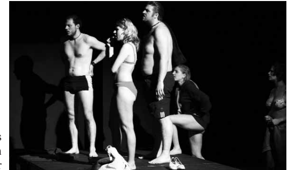
Ensemblepreis für die Studierenden des Studiengangs Schauspiel der Folkwang-Hochschule Essen für »Katzelmacher« von Rainer Werner Fassbinder