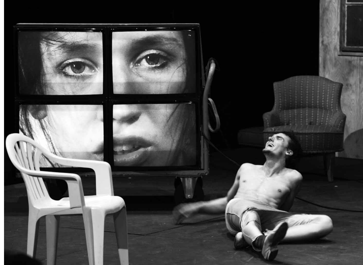
Max-Reinhard-Preis für die Studierenden der Hochschule der Künste Bern für »Living in Oblivion« – Ein Feldversuch