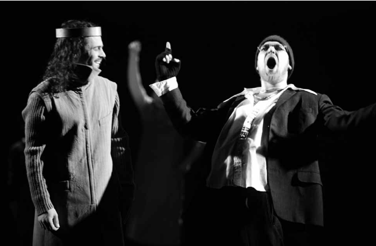
Ensemblepreis für die Studierenden der Hochschule für Musik und Darstellende Kunst Stuttgart für »Merlin oder Das wüste Land« von Tankred Dorst