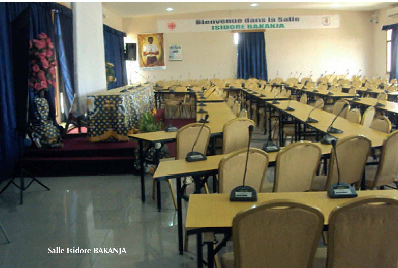
Salle Isidore BAKANJA