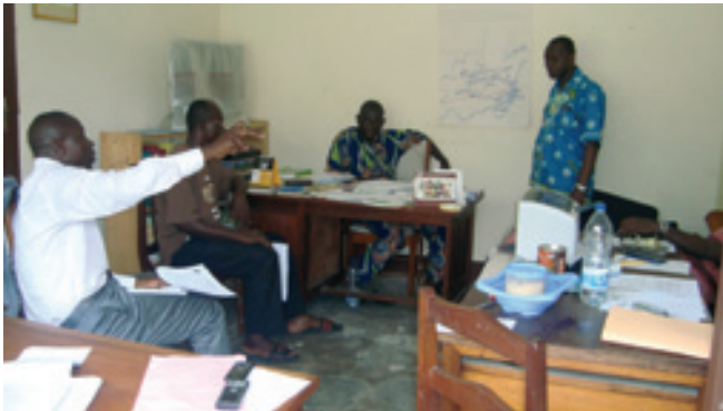
Planification de l'enquête entre Caritas Congo/RDC et Caritas Congo/Brazzaville

Commandé et financé par la Banque Mondiale, section Multi Countries Demobilization and Reintegration Program, MDRP, ce projet d'édification de la paix devait consulter 2000 personnes sur la situation socio-économique des ex-combattants de la Région du Pool de la République du Congo en vue de définir une nouvelle stratégie pour leur réinsertion.