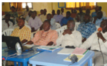
Membres du Core Group analysant le budget de la Province Orientale en la salle de conférence de la Cathédrale Notre Dame du Saint Rosaire

Le projet ad hoc exécuté dans la ville de Kisangani, au sein de l'Archidiocèse de Kisangani depuis 2006 est arrivé à son terme en mars 2011. Le processus de désengagement