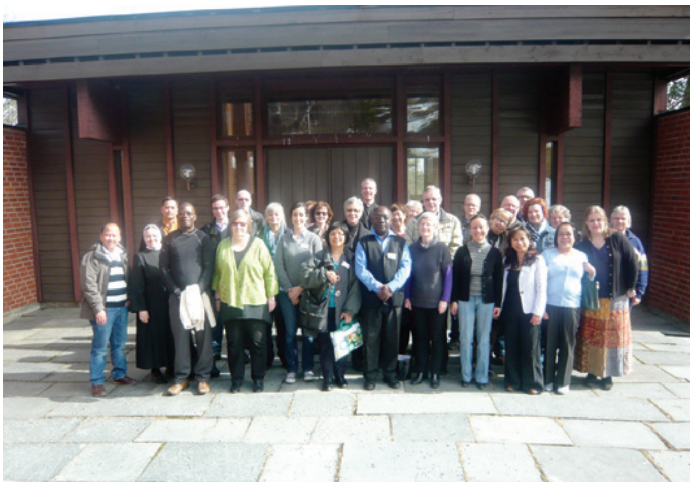
Deux délégués de Caritas Congo posant avec le staff de Caritas Norvège lors d'une mission de consolidation de partenariat entre ces deux Structures de l'Eglise Catholique

Les deux structures ont été également accompagnées dans la réalisation de leurs études de base respectives dans le même secteur afin de collecter des données de référence pour évaluer les progrès qui seront induits par les projets qu'elles vont bientôt entreprendre.