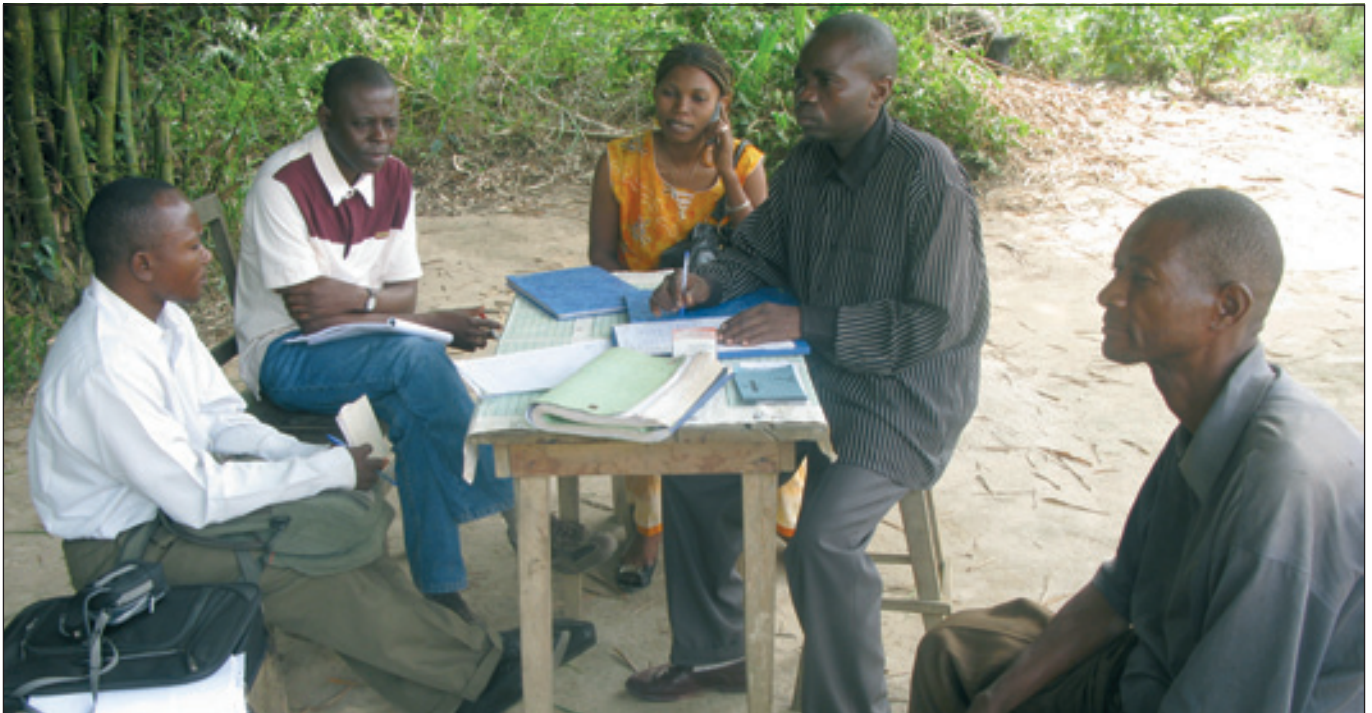
Le Coordonnateur du SPS, accompagné de l'équipe cadre de la ZS et des Délégués du BDOM et du MIP Province Orientale, en mission de suivi des activités des projets dans une aire de santé de la ZS de Lubutu-BDOM Kisangani

Un canevas standard pour le rapportage des activités a été élaboré et diffusé à tous les BDOM. Le SPS a participé aux ateliers que 2 BDOM relais ont organisé au cours de l'année. Il s'agit du BDOM Kinshasa qui a tenu sa rencontre provinciale à Kikwit et Kananga dans le cadre de l'assemblée plénière de la Caritas Développement. La rencontre annuelle 2011 étant programmée au premier trimestre 2012.