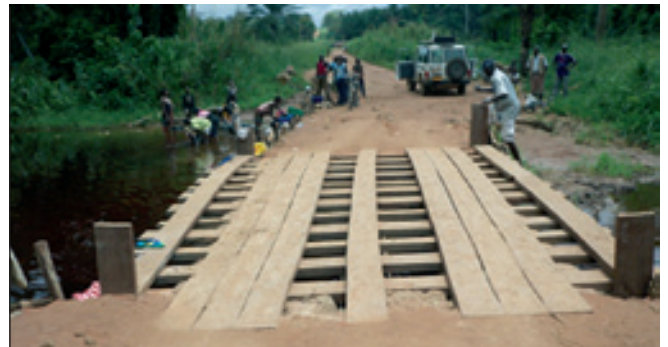
Le pont IFORAGRI (19 m) sur l'axe routier Dongo - Boyanzala

Elle a aussi contribué à la réhabilitation de la toiture d'une école primaire à Wamba, détruite par un violent ouragan.