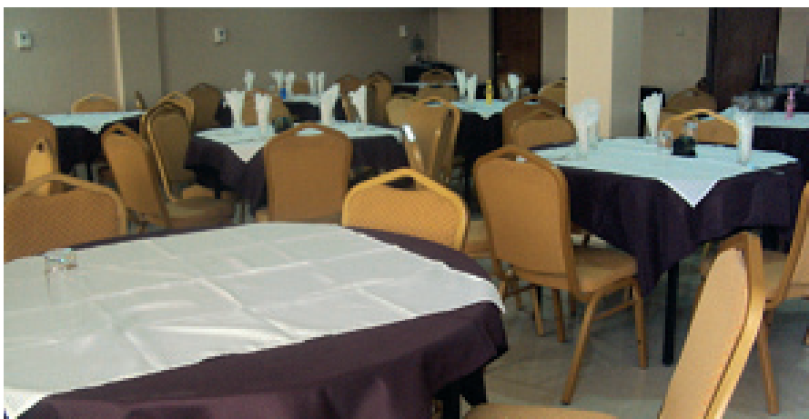
Vue partielle de l'un des restaurants du centre d'accueil Caritas Congo

A ce stade, le souci de la Cellule a été de contribuer à l'amélioration du suivi tant sur le plan de gestion de stocks des produits que sur le plan des approvisionnements.