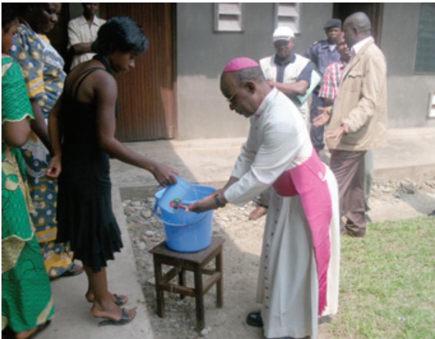
Mgr l'Archevêque de Mbandaka-Bikoro lançant la campagne de sensibilisation contre le choléra