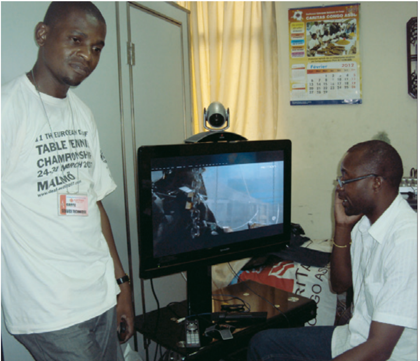
Le Chef de la Cellule Informatique (à droite) et l'un de ses collaborateurs, devant l'équipement de vidéo-conférence