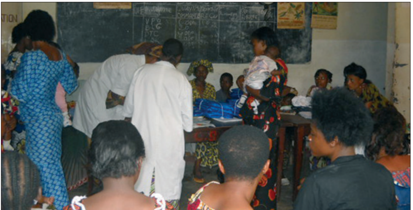
Des moustiquaires Imprégnées d'Insecticide (MII) distribuées aux femmes enceintes et allaitantes à Nsona Mpangu dans le BDOM Matadi

du Fonds Mondial/Round 8. Les réalisations en 2011 se résument de la manière suivante :