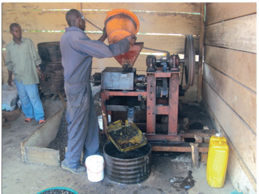
L'Association GRADI, encadrée par la Caritas, produit de l'huile palmiste à Beni