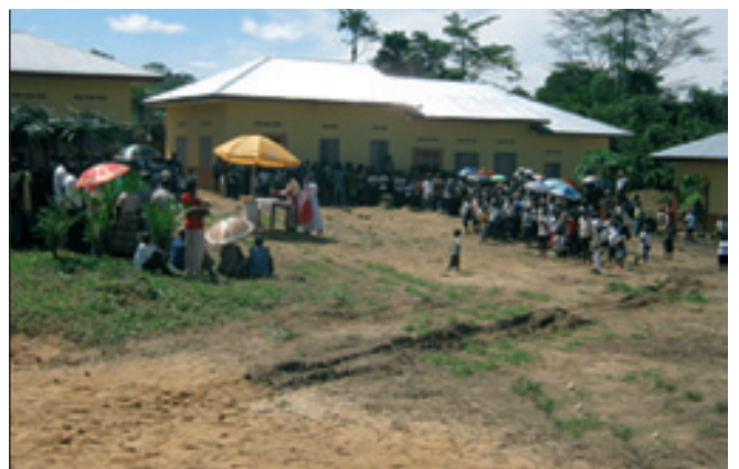
Hôpital Général de Référence de Wanie-Rukula du BDOM Kisangani