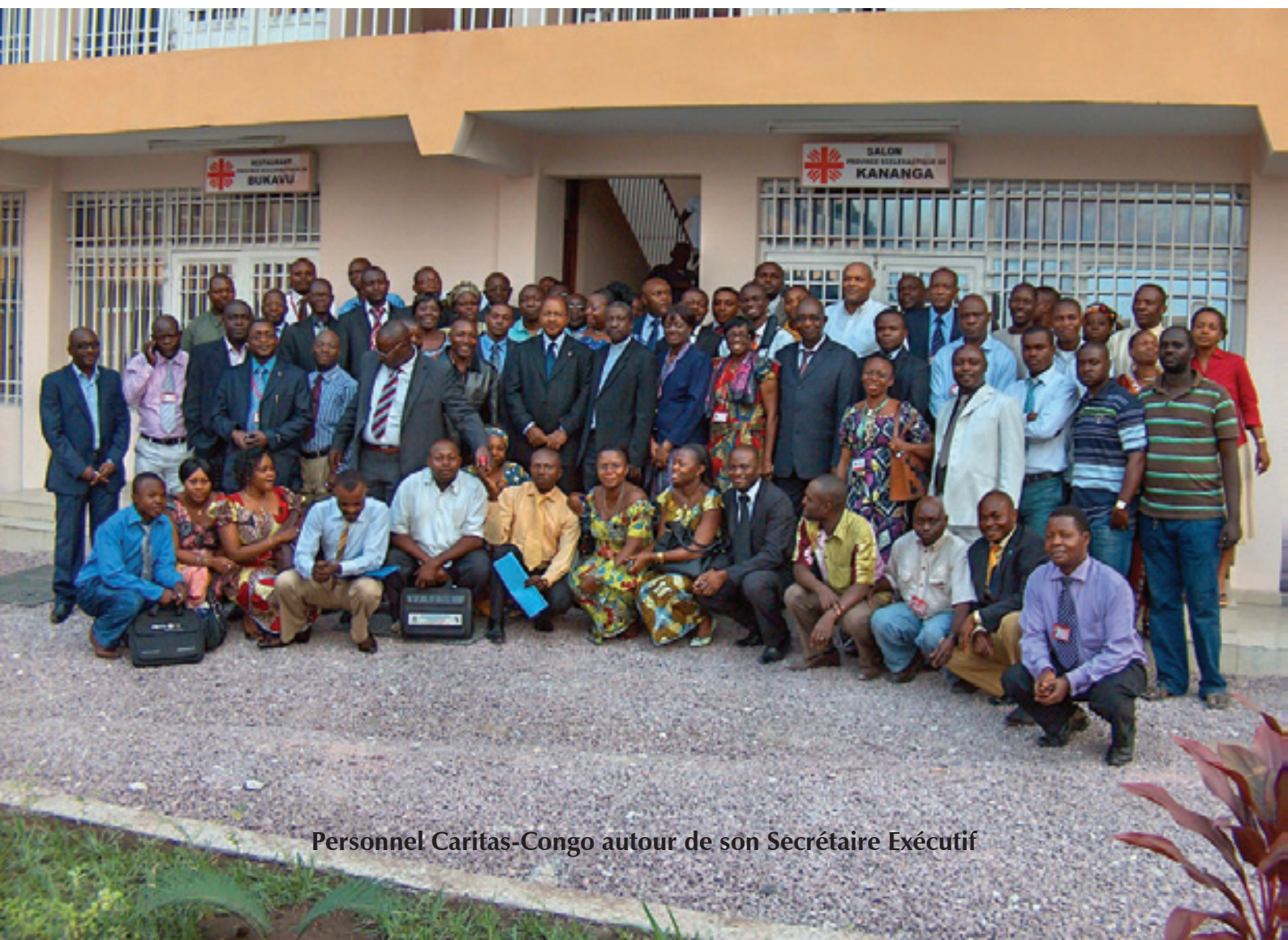
Personnel Caritas-Congo autour de son Secrétaire Exécutif