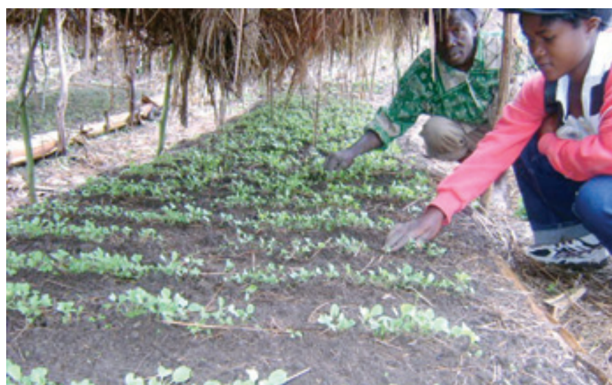
Multiplication des sémences

Ces microprojets ont concerné les aspects tels que la multiplication des semences, la pisciculture familiale, l'apiculture ou élevage des abeilles pour la production du miel, l'agroforesterie, la transformation des produits d'origine végétale, la coupe et couture pour la récupération des jeunes désœuvrés, la fabrication des briques etc. Environ 6.250 bénéficiaires ont été touchés.