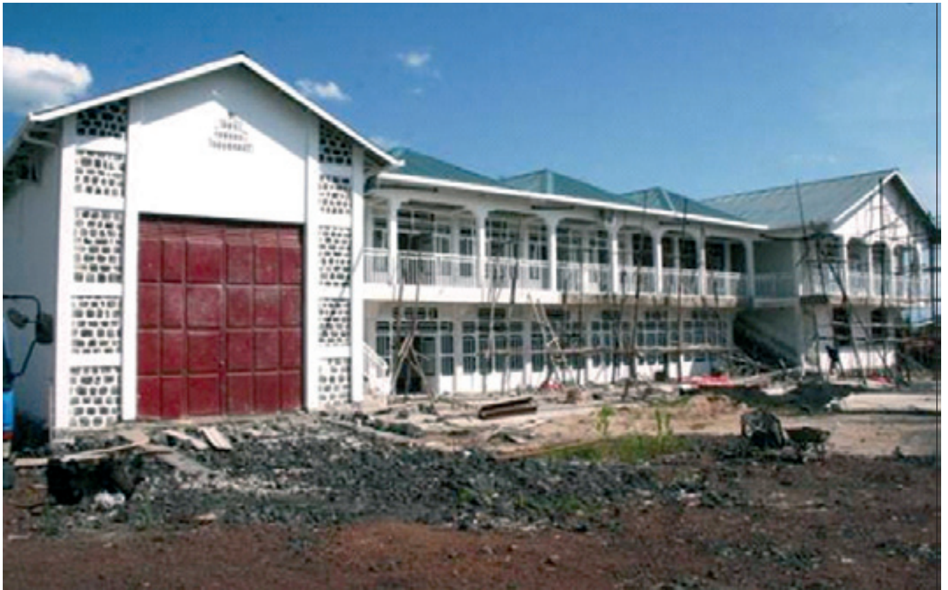
Grand dépôt pharmaceutique du Bureau Diocésain des Œuvres Médicales de Goma dans le chef-lieu du Nord-Kivu (Photo prise avant l'achèvement de travaux)

L'Église Catholique étant un partenaire potentiel et privilégié de l'État Congolais et considérant l'accord cadre signé à cet effet depuis 2007, le SPS coordonne, grâce aux 47 Bureaux Diocésains des Œuvres Médicales, l'action sanitaire en RD Congo conformément à la politique et aux stratégies édictées par le Ministère de la Santé. Les statistiques disponibles dans la base des données du SPS montre que les Formations Sanitaires du réseau catholique sont implantées dans 296 Zones de Santé sur les 515 que compte le pays. Ce réseau gère 237 hôpitaux, 283 centres de santé de référence (avec un Paquet Complémentaire d'activités déconcentrées) et 1 161 centres de santé, soit au total 1 481 formations sanitaires dont 1 219 sont propres au réseau (262 appartenant aux congrégations) et 262 cédées en gestion par l'État. Le nombre des lits montés s'élève à 26 633 en 2011.