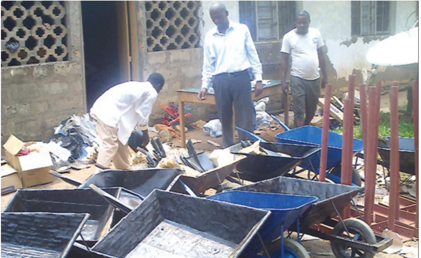
Distribution des outils de cantonages à Bengi, dans le cadre du PRODAC

D ans le cadre du projet de Développement Agricole et Commercial à Bulungu « PRODAC », Secours Catholique/Caritas France et Caritas Congo appuient le BDD de Kikwit dans la mise en œuvre des interventions ad hoc dans le Territoire de Bulungu, District du Kwilu avec le cofinancement Union Européenne (UE) –Secours Catholique pour une période de 42 mois à partir de novembre 2010.