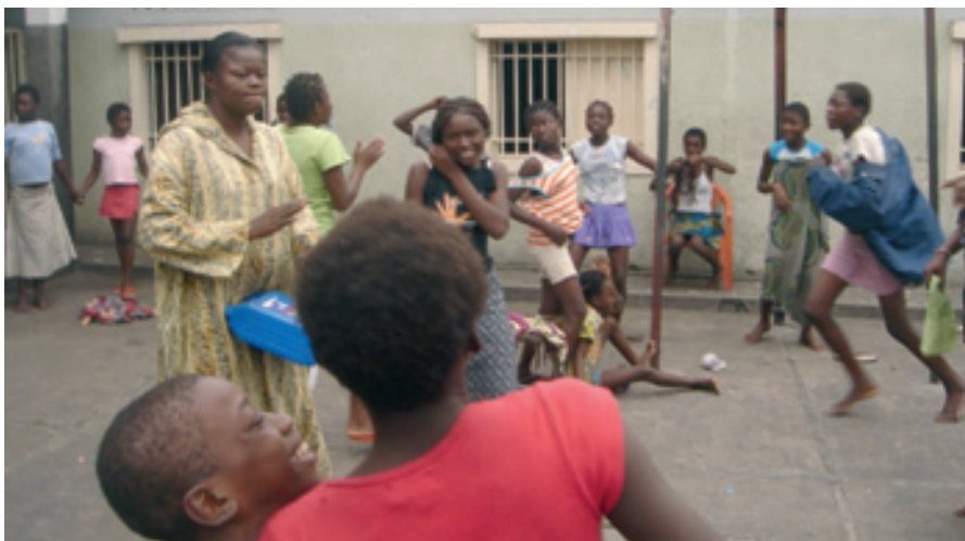
Des enfants de la rue jouant dans un centre d'hébergement à Kinshasa

L'ANNÉE 2011 A ÉTÉ PRINCIPALEMENT MARQUÉE PAR, D'UNE PART, L'ASSISTANCE AUX VICTIMES DES EXACTIONS DE LA LRA ET DES MAI MAI EN PROVINCE ORIENTALE, ET D'AUTRE PART LE RENFORCEMENT DES CAPACITÉS TECHNIQUES DES ASSOCIATIONS DES EX-COMBATTANTS À TRAVERS LE PAYS.