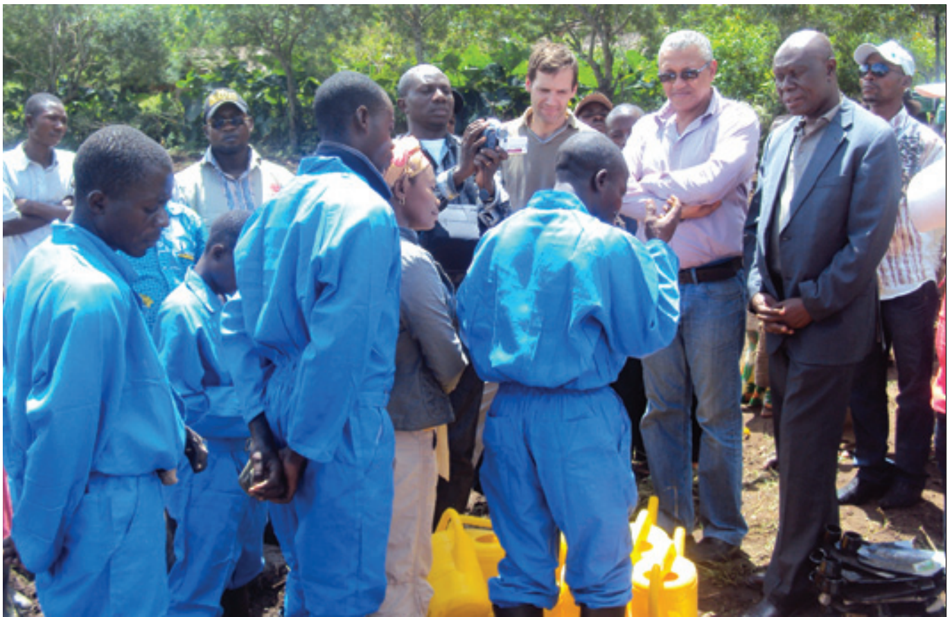
La mission conjointe d'évaluation Banque Mondiale-UEPN/DDR-Caritas Congo, très satisfait du travail des ex-combattants et membres de communautés d'accueil encadrés par la Caritas à Luvungi (Sud-Kivu)