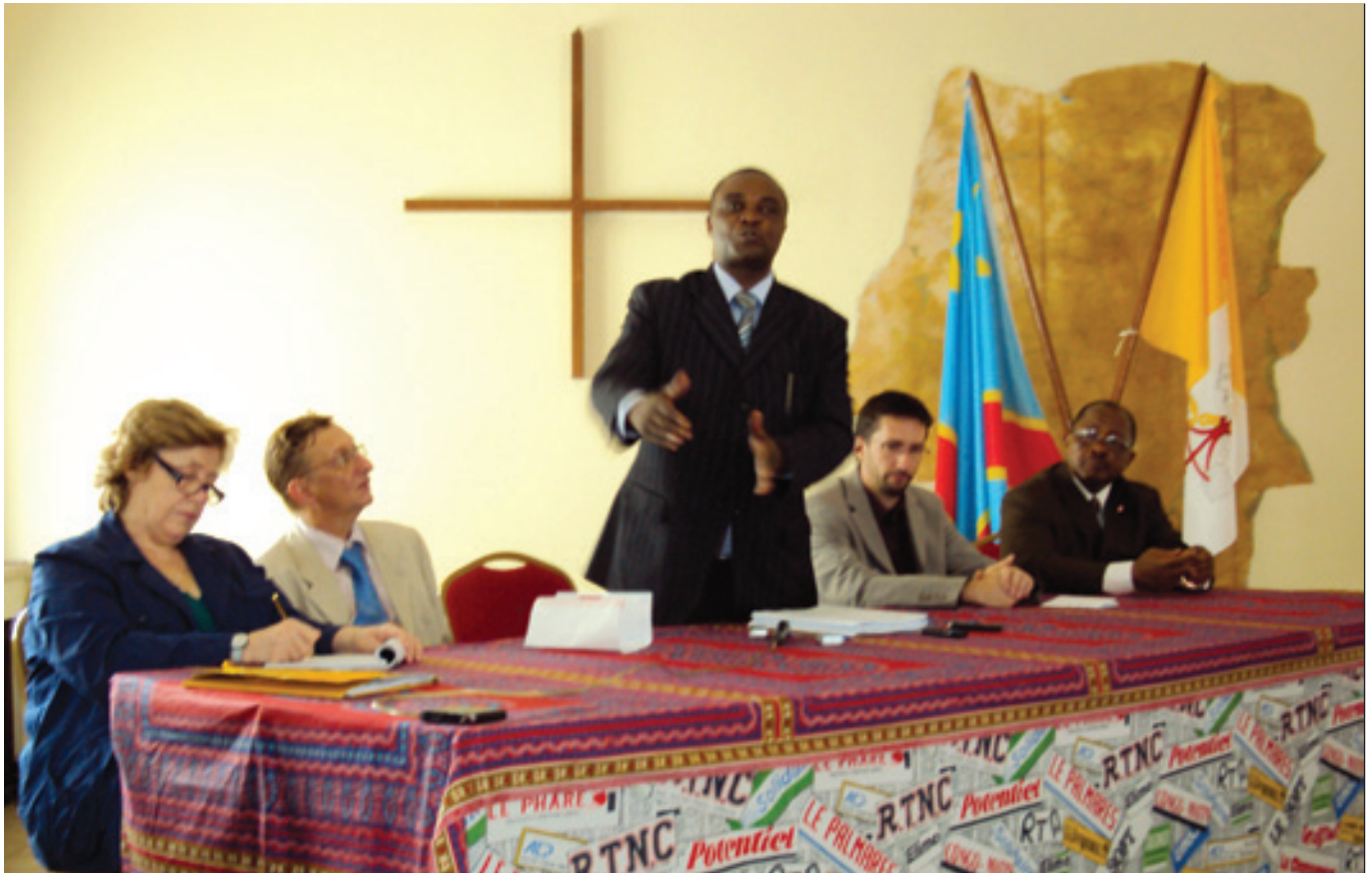
Caritas International Belgique et Caritas Congo au lancement du P3, en présence du Ministre de l'Agriculture, Pêche et Elevage

Dans le cadre du programme ad hoc financé par Caritas International Belgique (CIBe) et la DGC, Caritas Congo a :