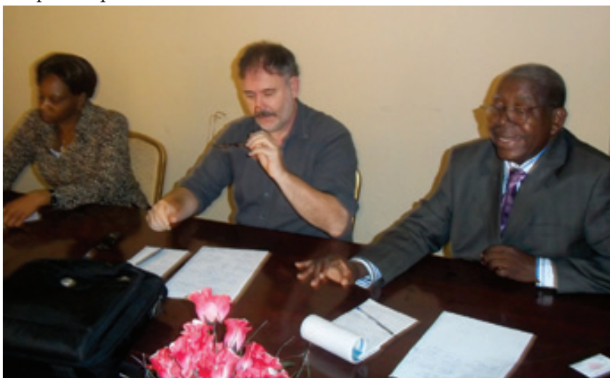
Une équipe de Caritas Congo en séance de travail avec la Délégation de la Banque Mondiale sur la paie des enseignants catholiques par la Caritas

A contrario, le démarrage effectif au mois d'octobre 2011 du projet de la paie des enseignants du réseau catholique a fait remonter la courbe de mobilisation de fonds de la Caritas Congo en contribuant à lui seul dans une proportion de 49,25%. Cet exploit, signé une fois de plus par l'Agence de Gestion Fiduciaire de Caritas Congo, rappelle la paie des agents électoraux que cet organe technique de la Conférence Episcopale Nationale du Congo (CENCO) avait réalisée en décembre 2005, pour garantir la réussite du référendum constitutionnel.