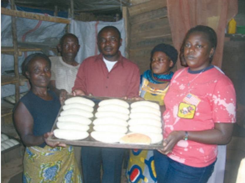
L'Association Maendeleo, évoluant à Bukavu dans la filière Boulangerie et réunissant des ex-combattantes et membres des communautés d'accueil à Bukavu, tous réinsérés par la Caritas

bo-Beni, Bunia, Kindu, Kisangani, Kananga, Luebo, Mweka, Basankusu, Mbandaka-Bikoro, Lisala, Budjala et Molegbe).