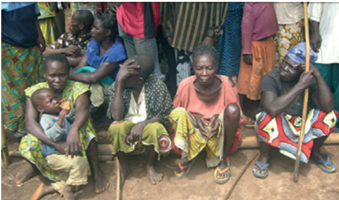
Des populations victimes des attaques des groupes armés dont la protection est visée par ledit programme à Bondo et Ango

Orientale, en faveur de 60.000 personnes pour 24 communautés, soit 2.500 personnes en moyenne par communauté.