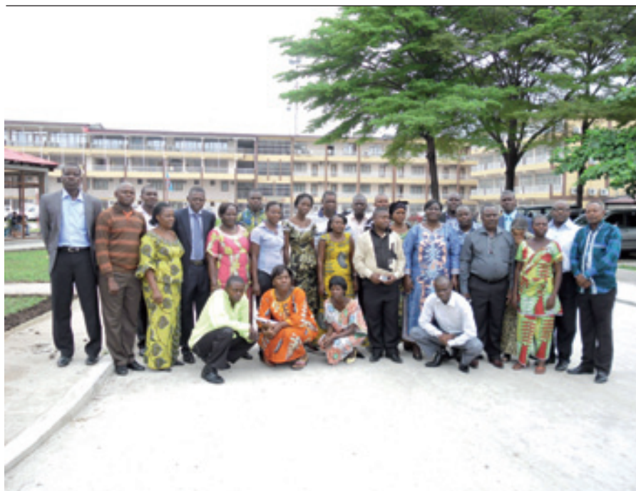
Atelier d'évaluation finale de projet de lutte contre la malnutrition/ UNICEF-Réseau Caritas/BDOM au centre d'accueil de Caritas Congo