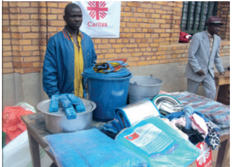
Kit par ménage reçu par un bénéficiaire de l'aide en biens non alimentaires de la Caritas aux victimes de la LRA à Duru (Diocèse de Dungu-Doruma), en présence du Chef du Poste d'encadrement Administratif de Yakuluku

16.750 ménages de déplacés internes et/ou retournés ont été assistés en biens non alimentaires et alimentaires ainsi qu'avec des unités de transformation (moulins) dans les diocèses de Butembo-Beni, 8.000 ménages à Dungu-Doruma, 1.000 ménages à Popokabaka, 1.000 ménages à Luebo, 50 ménages à Mweka, 1 000 ménages à Luiza et 5650 ménages à Bondo (en cours).