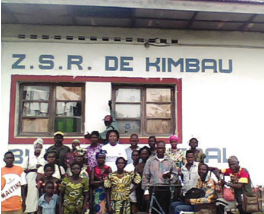
Equipe des tradi praticiens et personnel biomédical dans la ZS de Kimbau du BDOM Kenge

sur le VIH, la prévention et la prise en charge des personnes infectées et affectées. Les réalisations sont :