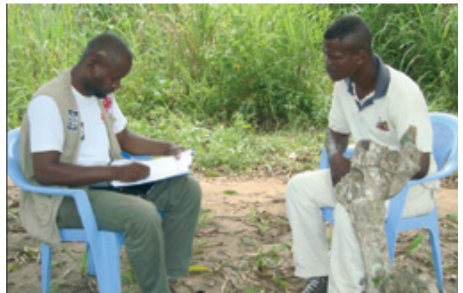
L'interview d'un ex-combattant de la Région du Pool/Congo-Brazzaville

Les données recueillies ont été transcrites sous un logiciel ad hoc, le SPSS, et envoyées à la Banque Mondiale pour analyse.