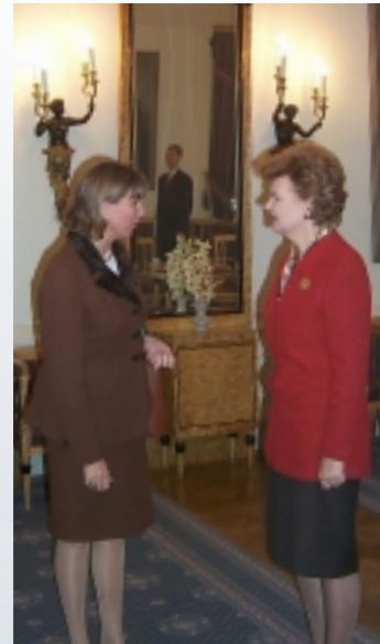
Madame Lydie Polfer a été reçue par Madame Vike-Freiberga, Présidente de Lettonie

Une inquiétude a cependant troublé ce voyage: le Premier ministre de Lettonie, M. Skele, a souligné les problèmes que les pays baltes connaissent dans le domaine économique et politique avec leur voisin russe. Les nouvelles républiques issues de l'effondrement de l'Union soviétique sont en effet très inquiètes de l'instabilité politique qui règne à Moscou et d'éventuelles menaces qui pourraient en découler pour eux et pour l'Europe toute entière.