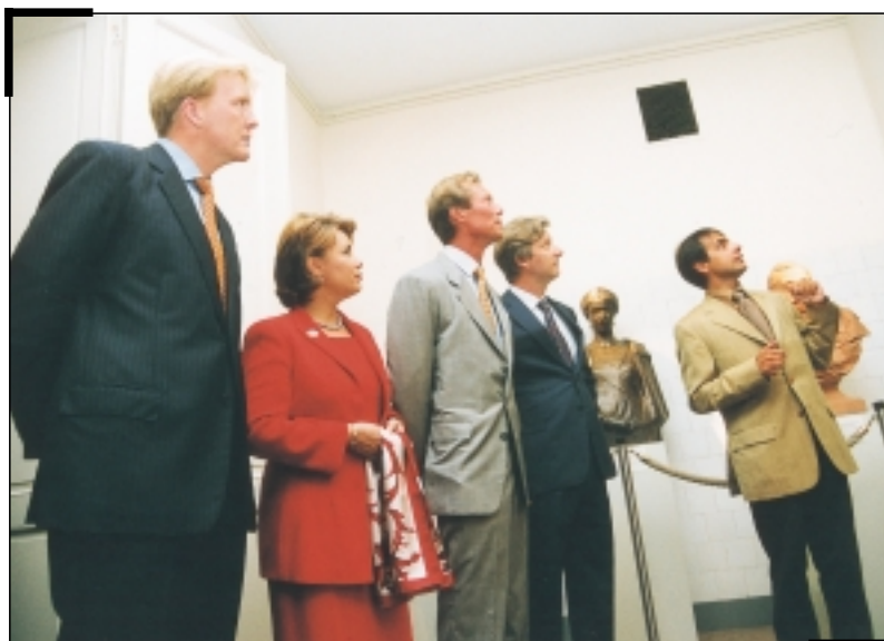
S.A.R. le Prince Philippe de Belgique, LL.AA.RR. le Prince Henri et la Princesse Maria Teresa de Luxembourg ainsi que S.A.R. le Prince Willem-Alexander des Pays-Bas suivent attentivement les explications du guide

Cette exposition avait pour objet de mettre en lumière un certain nombre de "points de contact" existant - ou ayant existé - entre le Luxembourg, les Pays-Bas et