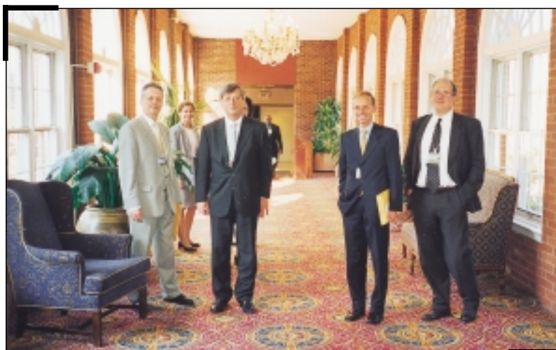
La délégation luxembourgeoise au FMI

MM. Juncker et Frieden ont eu l'occasion d'échanger leurs