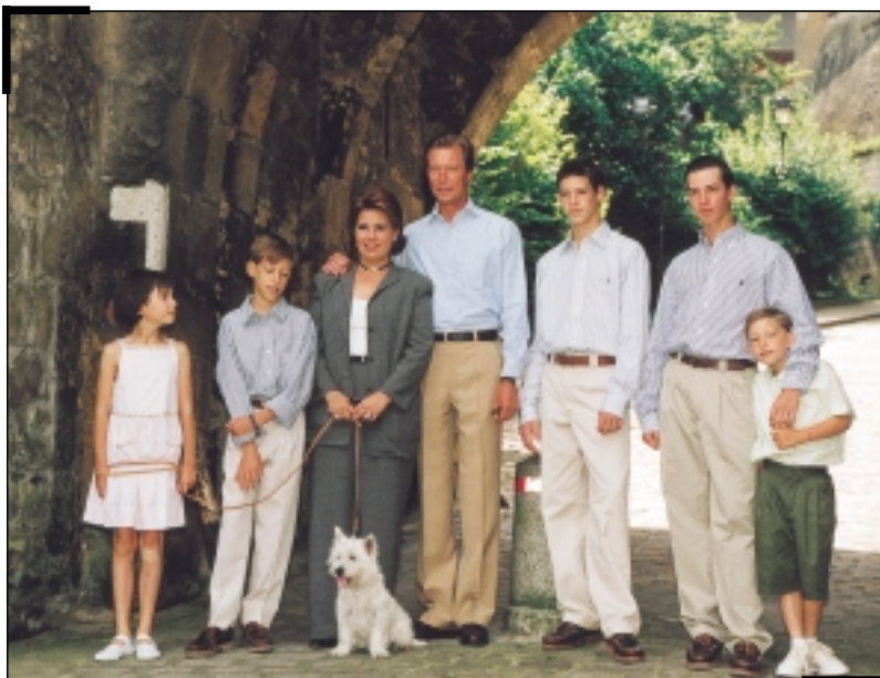
Le couple grand-ducal héritier entouré des ses enfants lors de sa visite de la vieille ville de Luxembourg

contré, Madame Lydie Polfer, alors bourgmestre de la Ville de Luxembourg.