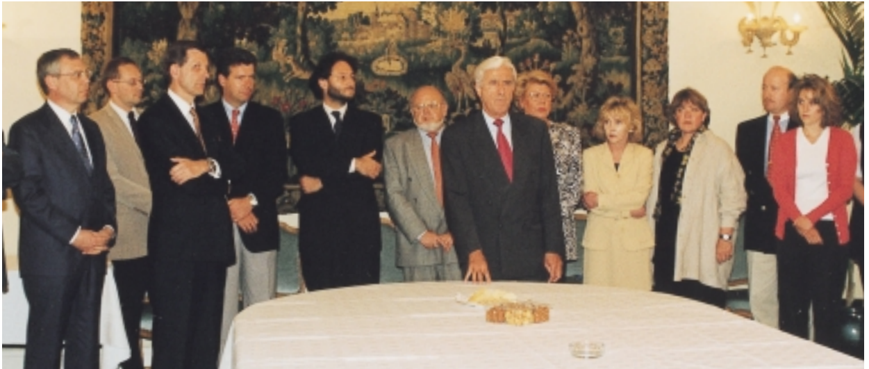
Monsieur Jacques F. Poos entouré de ses collaborateurs au Ministère des Affaires étrangères à l'occasion d'une réception d'adieu

missions d'observation. En un mot, le Luxembourg participe activement sur le terrain aux efforts de paix et de conciliation que la communauté internationale entreprend pour faire baisser les tensions dans les différents conflits qui exigent d'une manière ou d'une autre son intervention. Le même principe de solidarité vaut pour la politique de coopération en matière de développement, dans laquelle le Luxembourg investira d'ici 1999-2000, 0,7% de son PNB.