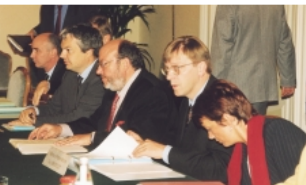
La délégation belge composée entre autres de M. Guy Verhofstadt, Premier ministre, M. Louis Michel, ministre des Affaires étrangères, Mme Isabelle Durant, ministre des Transports et de la Mobilité, M. Didier Reynders, ministre des Finances

Autre point de discussion abordé lors de leurs entrevues: la question des plaques d'immatriculation luxembourgeoises en Belgique. Les délégations ont décidé d'examiner les solutions éventuelles et de mettre un terme à ce trafic de plaques, à condition toutefois que les travailleurs frontaliers belges, employés au Luxembourg et bénéficiant d'une voiture mise à disposition par leur entreprise, échappent à l'imposition fiscale belge, tout comme les Luxembourgeois étudiant en Belgique.