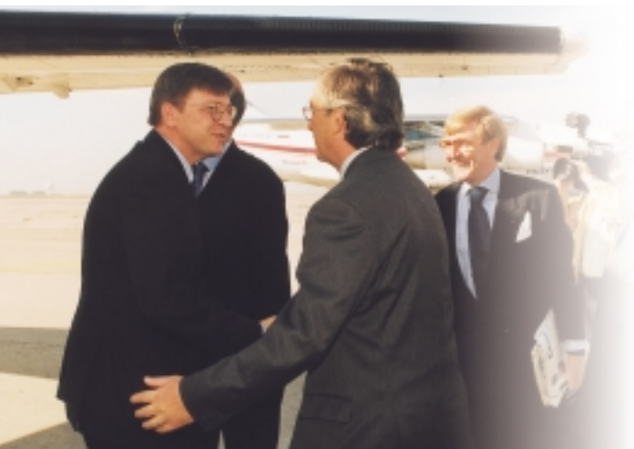
M. Jean-Claude Juncker, Premier ministre, salue son homologue belge, M. Guy Verhofstadt

La visite rassemblait, outre les deux chefs de gouvernement, Madame Lydie Polfer, Vice-Premier ministre et ministre des Affaires étrangères et du Commerce extérieur, Monsieur Henri Grethen, ministre de l'Economie et ministre des Transports, Monsieur Charles Goerens, ministre de la Coopération, de l'Action humanitaire et de la Défense, ainsi que leurs homologues belges: Monsieur Louis Michel, ministre des Affaires étrangères, Madame Isabelle Durant, ministre des Transports et de la Mobilité, Monsieur Didier Reynders, ministre des Finances, et Monsieur Rudy Demotte, ministre de l'Economie.