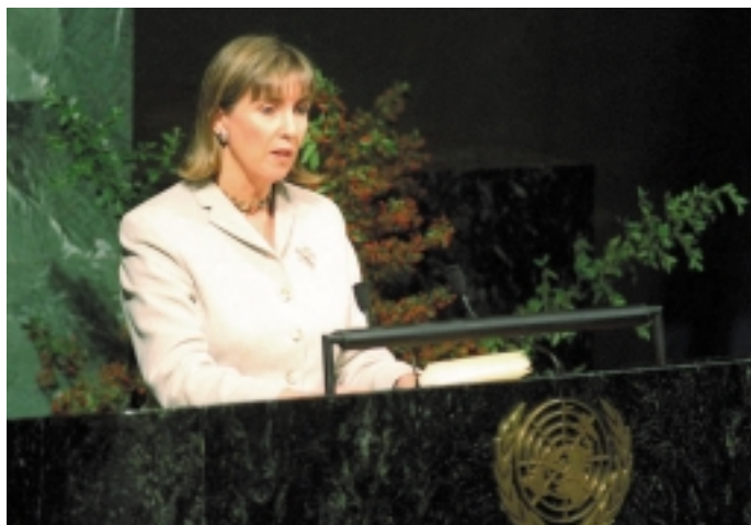
Madame Lydie Polfer à la tribune de l'Assemblée générale des Nations Unies

Le ministre des Affaires étrangères et du Commerce extérieur du Luxembourg, Madame Lydie Polfer, a participé du 20 au 24 septembre à New York aux travaux de la 54 e Assemblée générale des Nations Unies. Elle a prononcé son discours au nom du Luxembourg devant l'Assemblée réunie le 23 septembre. Le sujet principal de son discours portait sur la souveraineté des pays. Dans ce contexte, le ministre a déclaré que l'ONU devait "se donner les moyens d'intervenir".