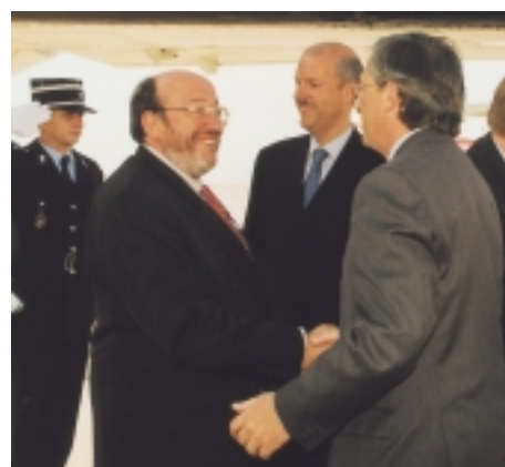
M. Jean-Claude Juncker souhaite la bienvenue au Ministre belge des Affaires étrangères, M. Louis Michel

En date du 16 septembre 1999, les nouveaux gouvernements luxembourgeois et belge se sont rencontrés pour la première fois en réunion de travail présidée par MM. Jean-Claude Juncker, Premier ministre du Luxembourg, et Guy Verhofstadt, Premier ministre de la Belgique.