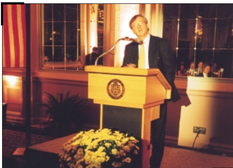
M. Jean-Claude Juncker a prononcé deux discours sur la politique européenne à l'Université de Pittsburgh

En ce qui concerne les pays baltes, la BERD s'efforcera d'encourager la coopération entre les trois pays, ainsi qu'avec les pays voisins, afin de rendre la région plus intéressante pour les investissements étrangers. Dans le cadre de l'adhésion prochaine de plusieurs pays d'Europe de l'Est, M. Juncker s'est entretenu avec le président de la BERD sur une collaboration future avec la Banque européenne d'investissement (BEI). M. Köhler s'est déclaré en faveur d'une collaboration plus étroite entre les