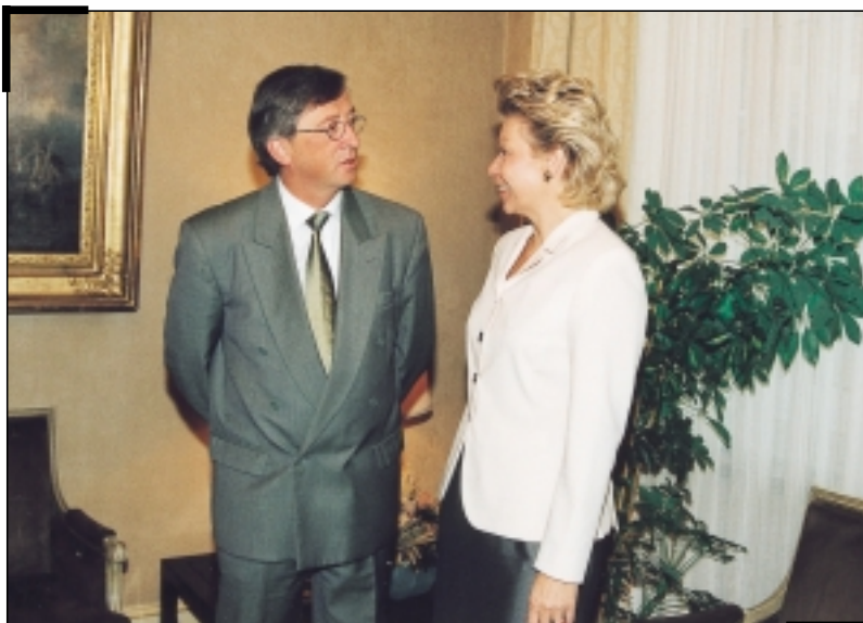
M. Jean-Claude Juncker, Premier ministre, reçoit Mme Viviane Reding en sa qualité de Commissaire européenne

aux conditions sanitaires minimales. Cette situation ne permet pas de développer une stratégie d'attraction de cadres qualifiés indispensables au développement de cette commune. Paül qui comptait 8100 habitants en 1990, est la seule commune qui ne possède pas de représentation des services décentralisés de l'Etat parce qu'elle n'est pas en mesure de proposer des logements décents. Il va sans dire que le seuil de pauvreté y est un des plus élevés du pays.