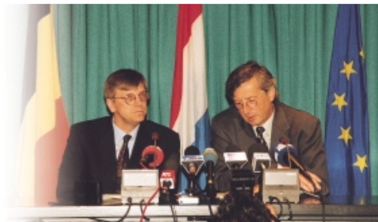
MM. Guy Verhofstadt et Jean-Claude Juncker lors de la conférence de presse à l'issue des entrevues entre les délégations belge et luxembourgeoise

particulier la ligne de chemin de fer Bruxelles-Luxembourg où des directives concrètes de modernisation ont été décidées. Les deux chefs de gouvernement ont convenu que les travaux à réaliser auront pour base le cofinancement. Les deux gouvernements sont aussi tombés d'accord de reconduire la convention sur l'Union économique belgo-luxembourgeoise (UEBL) qui viendra à échéance en 2001. Si l'association monétaire n'a plus de raison d'être après l'entrée de la Belgique et du Luxembourg dans l'Union économique et monétaire européenne, MM. Juncker et Verhofstadt ont toutefois évoqué la volonté d'intensifier la coopération entre les deux pays et de prolonger pour une nouvelle décennie l'Union économique belgo-luxembourgeoise.