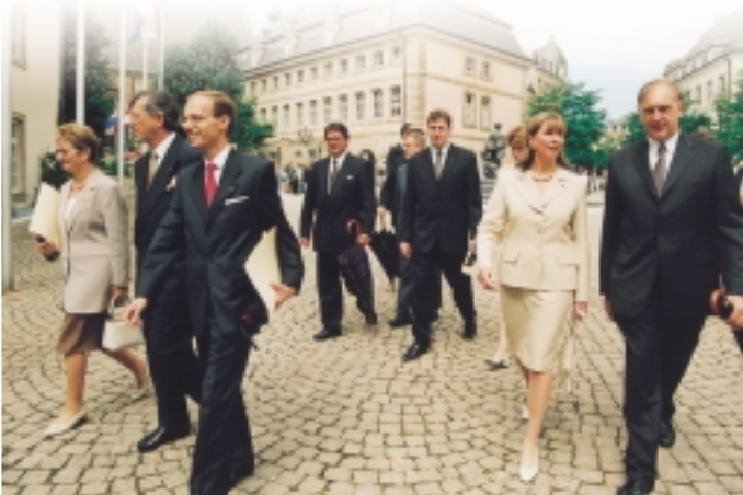
Les membres du nouveau gouvernement après la cérémonie d'assermentation au Palais grand-ducal

Après les élections du 13 juin, les négociations de coalition ont débuté le 24 juin avec une première réunion des délégations du Parti chrétien social et du Parti démocratique au ministère de l'Agriculture.