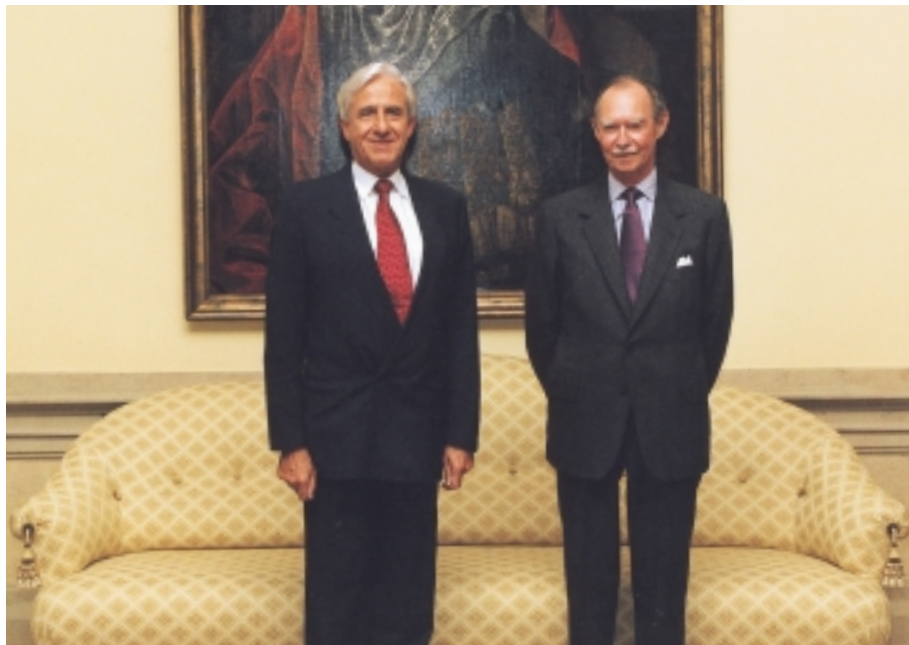
S.A.R. le Grand-Duc Jean et Monsieur Jacques F. Poos après l'audience de congé au Palais grand-ducal

Monsieur Jacques F. Poos, député européen, a invité à une réception d'adieu le 15 juillet 1999, quelques jours avant de quitter ses fonctions officielles de ministre des Affaires étrangères. A cette occasion, il a remercié ses collaborateurs de l'assistance qu'ils lui ont prêtée au cours des 15 dernières années.