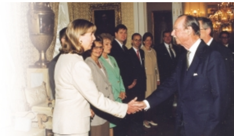
S.A.R. le Grand-Duc Jean saluant les membres du nouveau gouvernement

Ensuite, et avant l'assermentation des nouveaux membres du Gouvernement, S.A.R. le Grand-Duc a signé l'Arrêté grand-ducal portant organisation du Gouvernement, l'Arrêté grand-ducal portant reconduction de Monsieur Jean-Claude Juncker à la fonction de Premier ministre, l'Arrêté grand-ducal portant nomination du nouveau gouvernement, l'Arrêté grand-ducal portant énumération des ministères et l'Arrêté grand-ducal portant attribution des ministères aux membres du Gouvernement.