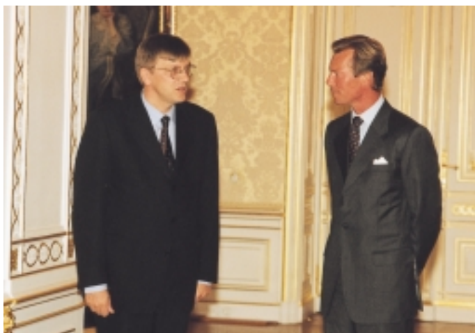
M. Guy Verhofstadt, Premier ministre belge, a été reçu en audience par S.A.R. le Grand-Duc Héritier

La visite rassemblait, outre les deux chefs de gouvernement, Madame Lydie Polfer, Vice-Premier ministre et ministre des Affaires étrangères et du Commerce extérieur, Monsieur Henri Grethen, ministre de l'Economie et ministre des Transports, Monsieur Charles Goerens, ministre de la Coopération, de l'Action humanitaire et de la Défense, ainsi que leurs homologues belges: Monsieur Louis Michel, ministre des Affaires étrangères, Madame Isabelle Durant, ministre des Transports et de la Mobilité, Monsieur Didier Reynders, ministre des Finances, et Monsieur Rudy Demotte, ministre de l'Economie.