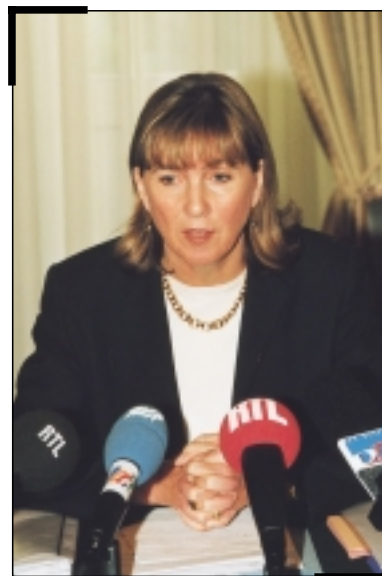
A l'issue des rencontres avec ses homologues, Madame Lydie Polfer présente le déroulement et les résultats de ces premières entrevues

Du côté français, les discussions sur les relations bilatérales ont concerné avant tout l'implantation évoquée d'un supermarché à Pétange, implantation qui est mal vue autant du côté luxembourgeois que du côté belge. Madame Polfer a précisé à M. Védrine l'impact néfaste que pourrait avoir un tel projet sur le commerce de la région.