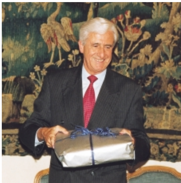
M. Poos lors de la réception d'adieu organisée au Ministère des Affaires étrangères

Depuis 1984, l'action extérieure du Luxembourg a connu, sous l'impulsion de M. Jacques F. Poos, encore bien d'autres développements. Il faut signaler l'ouverture de nouvelles ambassades à Tokyo, Madrid et Lisbonne à la fin des années 80, à Athènes et Kuala Lumpur au cours des années 90. Le Luxembourg a par ailleurs commencé à contribuer avec des soldats et des policiers à des missions humanitaires, de maintien de la paix ou de l'ordre dans des régions en conflit comme l'Irak du Nord, la Slavonie orientale, la Croatie, la Bosnie, l'Albanie ou le Kosovo. Des observateurs civils ont été présents lors d'élections en Afrique du Sud, dans les territoires administrés par l'Autorité palestinienne, en Bosnie et en Albanie. Des diplomates ont également participé à des