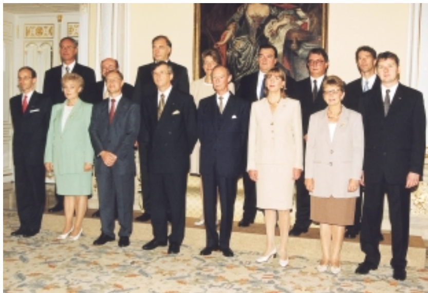
Photo de famille du nouveau gouvernement avec S.A.R. le Grand-Duc Jean

La Chambre des députés s'est réunie de nouveau le 12 août 1999 pour entendre la déclaration gouvernementale faite par Monsieur Jean-Claude Juncker, Premier ministre, ministre d'Etat et le débat à la Chambre des députés a eu lieu le 13 août 1999.*