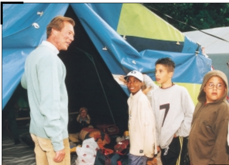
Les jeunes participants au camp du Service National de la Jeunesse accueillent le Grand-Duc Héritier dans leur tente

Quelques jours plus tard, le 22 juillet 1999, LL.AA.RR. le Prince Henri et la Princesse Maria Teresa accompagnés de leurs enfants, les Princes Guillaume, Félix, Louis et Sébastien ainsi que la Princesse Alexandra ont fait une excursion dans l'Oesling. La visite a commencé avec un déjeuner au Camp du «Service national de la Jeunesse» à Erpeldange. La famille grand-ducale héritière a ensuite visité le musée rural «A Schiewesch» de Binsfeld. Dans ce musée, installé dans une ancienne ferme, la famille grand-ducale héritière a pu découvrir la réalité de la vie rurale à l'époque. A la grande joie des enfants princiers, une partie de l'après-midi fut également consacrée à la visite d'une ferme près de Weiswampach.