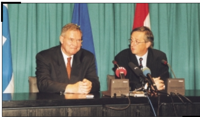
MM. Paavo Lipponen et Jean-Claude Juncker présentent les résultats de leur entrevue à la presse

Les deux chefs de gouvernement ont abordé les différents sujets qui seront à l'ordre du jour du Conseil de Tampere: l'harmonisation du droit d'asile, la problématique des réfugiés, la création d'un espace juridique européen, la coopération judiciaire, la lutte contre la criminalité organisée et le blanchiment d'argent ainsi que l'élargissement de l'Union européenne.