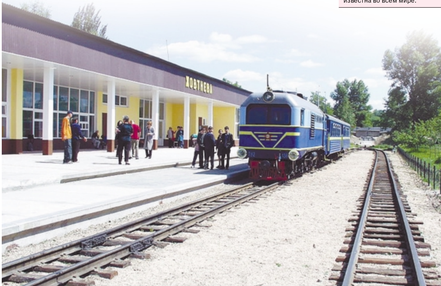
■ УНИКАЛЬНАЯ «ИЗЮМИНКА» ГОРОДА

Увеличилось и количество юных железнодорожников. В 1972 году на ДЖД занималось лишь 50 детей, 1973 г. – их количество превысило 900, а сегодня – 1270 мальчишек и девчонок в возрасте от 12 до 16 лет занимаются в 83 кружках на базе ДЖД.