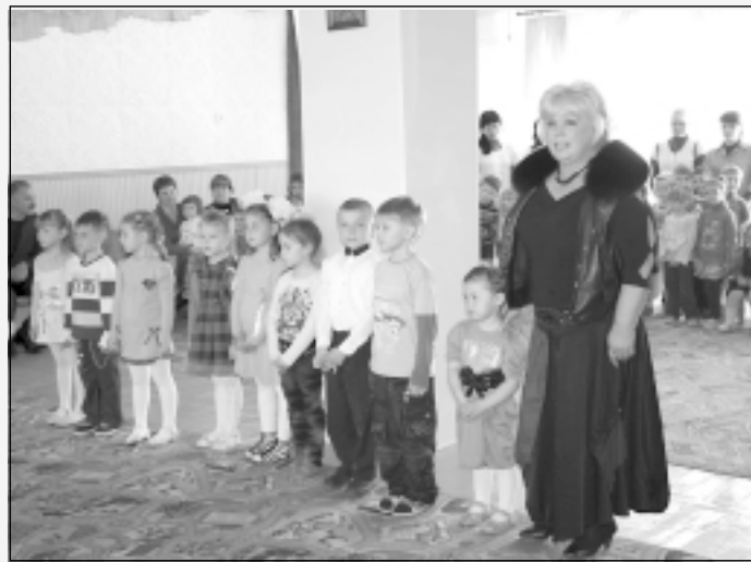
■ ОТКРЫТИЕ САДА – ПРАЗДНИК ДЛЯ ДЕТВОРЫ

на найближчій сесії буде виділено 33 тис. грн. на відкриття нової групи, для ще кращої роботи дитячого садка.