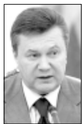
Виктор Янукович, Президент Украины:

Чиновники, которые не справляются с реализацией реформ, будут уволены