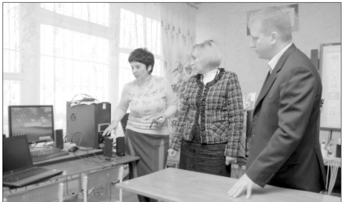
■ НОВЫЕ ТЕХНОЛОГИИ – ШКОЛЕ