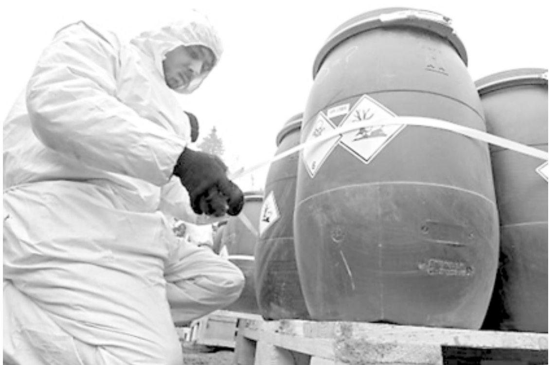
■ УТИЛИЗАЦИЯ ЯДОХИМИКАТОВ – ЗАДАЧА ГОСУДАРСТВЕННАЯ