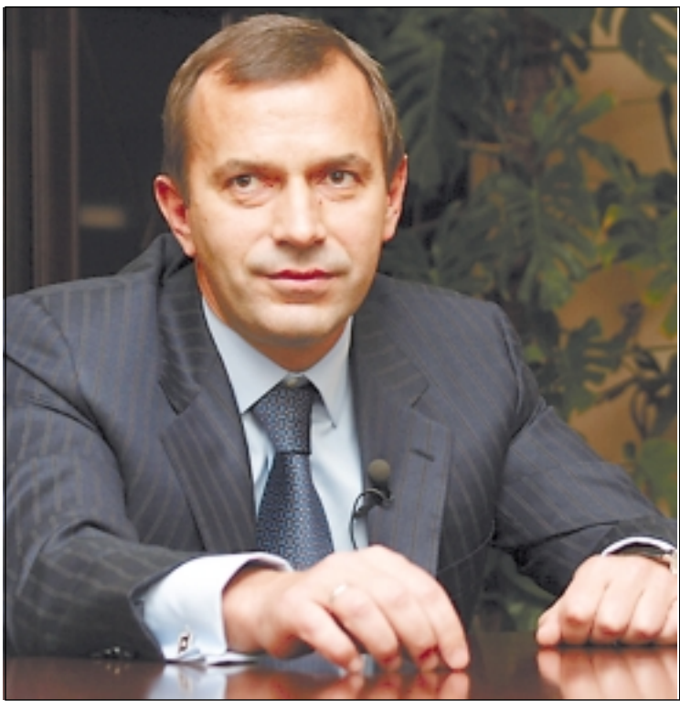
■ ЧЕСТНЫЙ ЧИНОВНИК – НОРМА

Перманентное политическое противостояние в Украине в двухтысячных годах способствовало разложению институтов власти. Демократию подменили вседозволенностью. Коррупция приобрела масштабы национального бедствия – подорвала веру граждан в собственное государство, значительно ограничила его развитие. Поломав управленческую дисциплину, стала одной из ключевых причин торможения любых реформ. Коррупционные действия убивают конкуренцию, снижают темпы модернизации экономики.