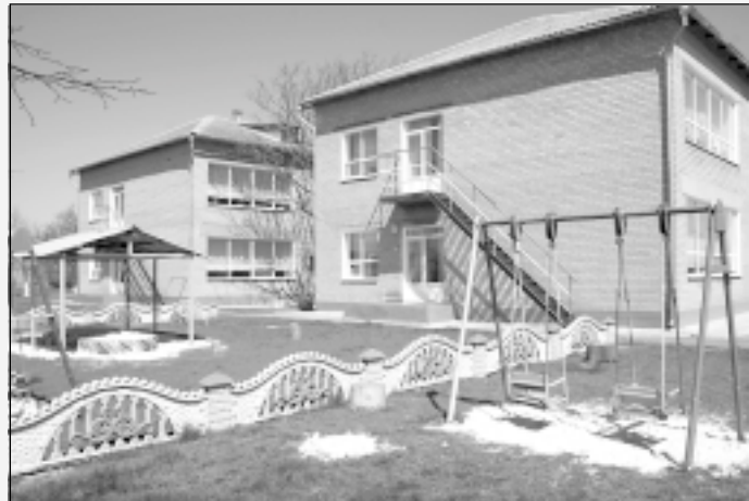
■ ОТРЕСТАВРИРОВАННОЕ ЗДАНИЕ ДЕТСАДА