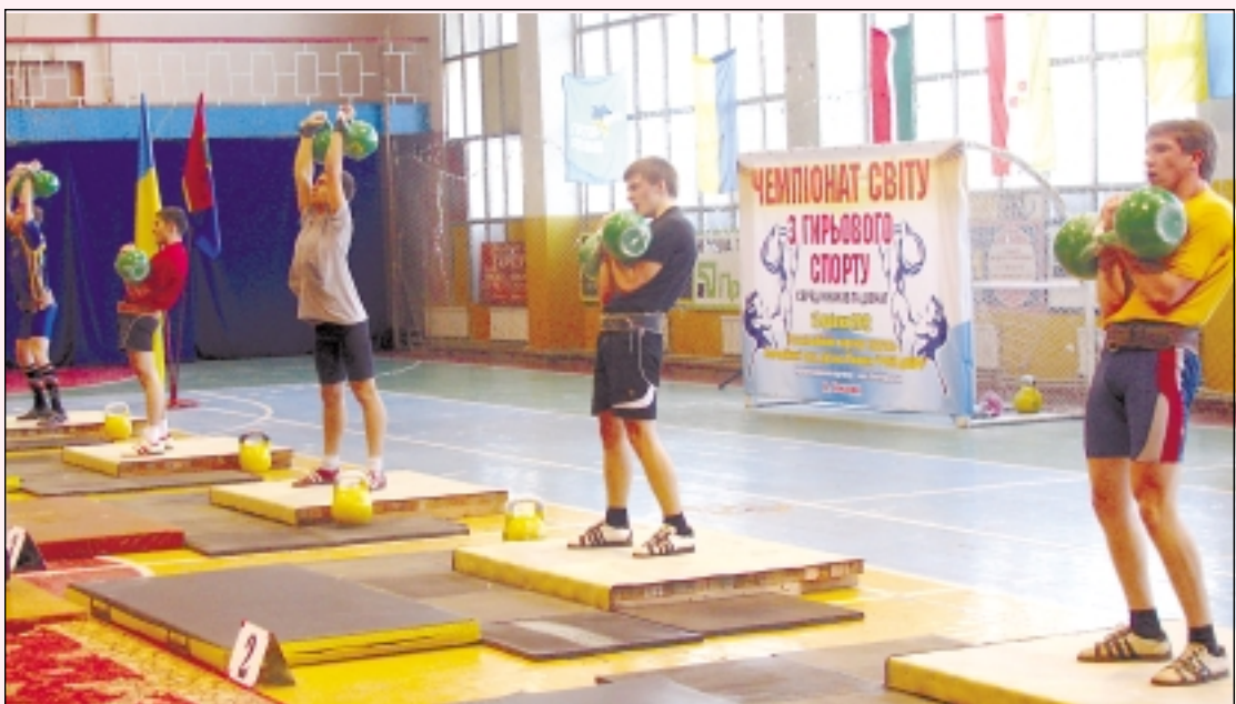
■ УКРАИНСКИЕ БОГАТЫРИ УСТАНОВИЛИ ДВА МИРОВЫХ РЕКОРДА

Организационным партнером чемпионата выступил благотворительный фонд «Делай добро».