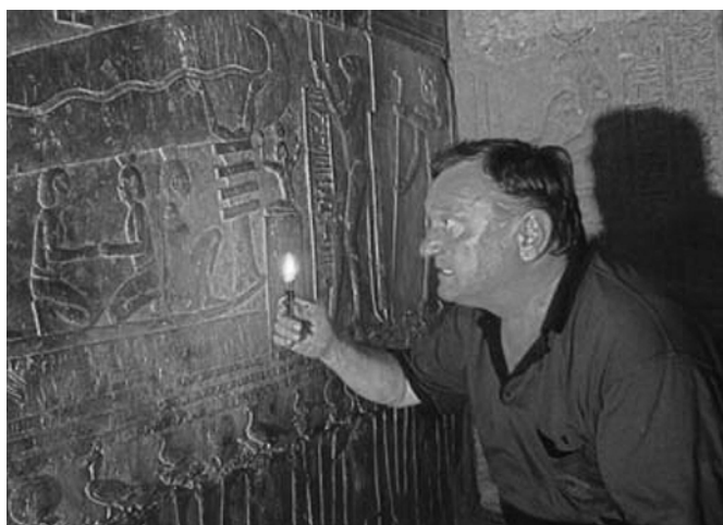
Erich Von Däniken

Velmi přátelský, hlavně k těm exaktním. S archeology a antropology je problém. Oni totiž věří, že nad jejich úhel pohledu není, a nedokáží přijmout žádné jiné hledisko.