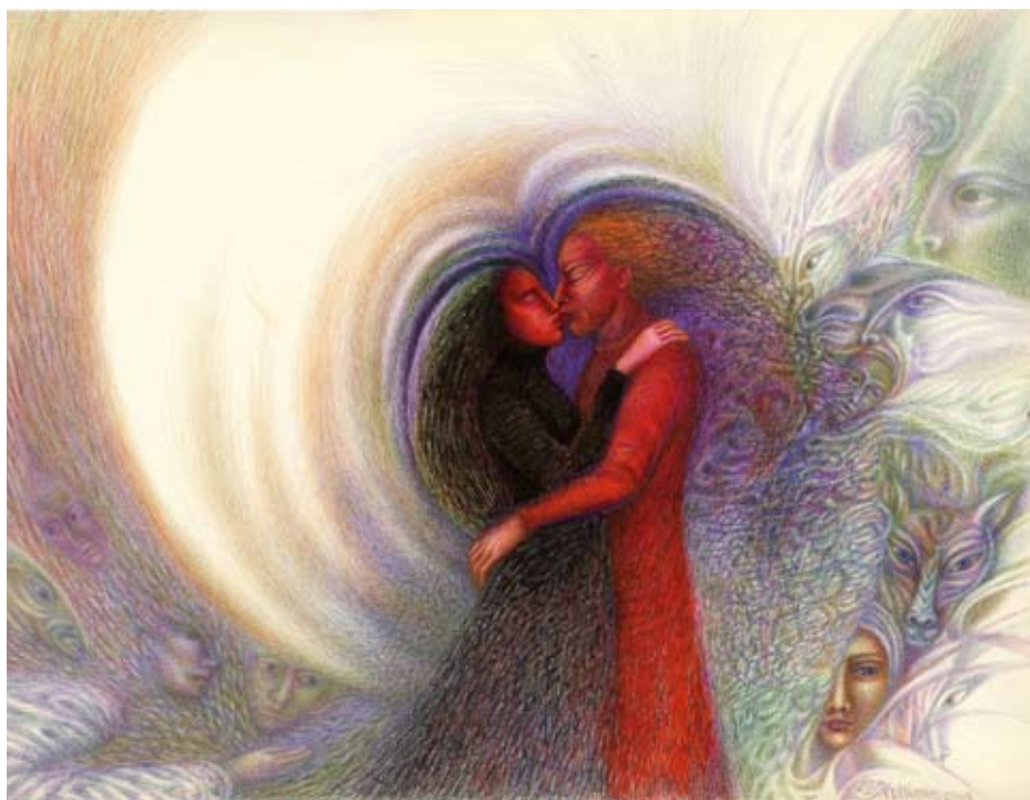
«SKŪPSTS», PAPIRS, KRĀSU ZĪMULIS, 2008.