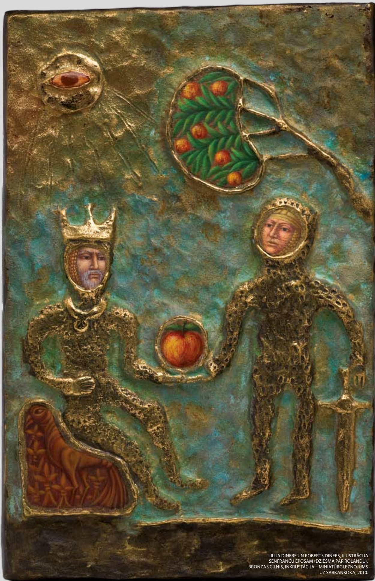
LILJA DINERE UN ROBERTS DINERS, ILUSTRĀCIJA SENFRANČU EPOSAM «DZIESMA PAR ROLANDU», BRONZAS CILNIS, INKRUSTĀCIJA – MINIATŪRGLEZNOJUMS UZ SARKANKOKA, 2010.