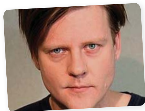
Fekete Ernő Színkritikusok díja – Az évad legjobb férfi főszereplőnek az Othellóban, A kétfejű fenevadban és a Mennyekbe vágató prolibuszban nyújtott alakításáért – 2010