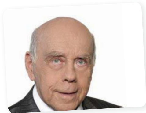
Lázár Egon Budapest díszpolgára – 2010