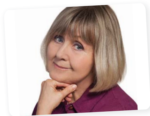
Halász Judit Hazám-díj – 2010