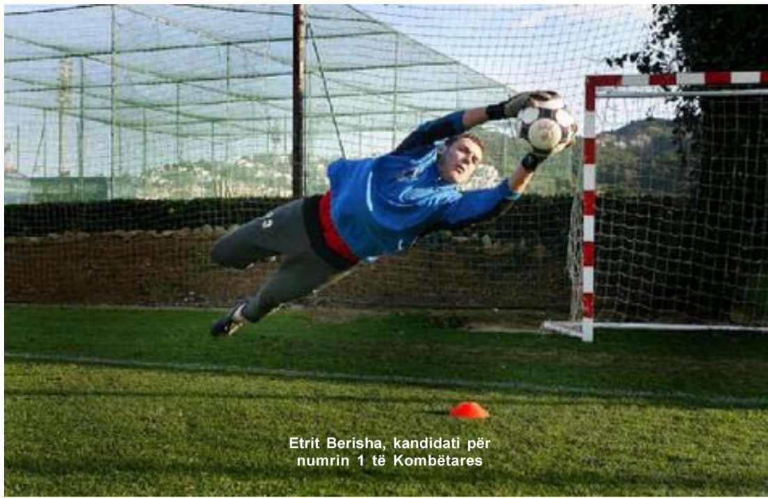
Etrit Berisha, kandidati për numrin 1 të Kombëtares