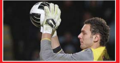
Është Etrit Berisha, gjiganti 194 cm i Kalmarit, kampion i Suedisë dhe titullar i Kombëtares së Kosovës