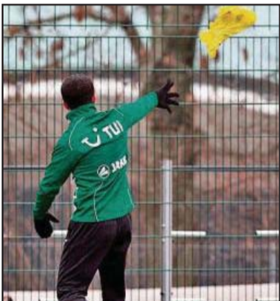
Lala, i nervozuar hedh jelekun e stërvitjes

Çernomorets do Bakajn, Dinamo Bukuresht e jep borxh vetëm në Rumani