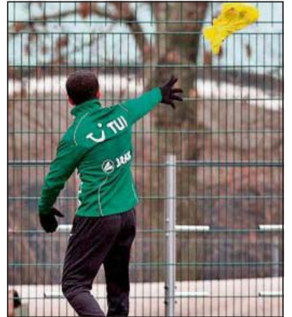
Lala, i nervozuar hedh jelekun e stërvitjes