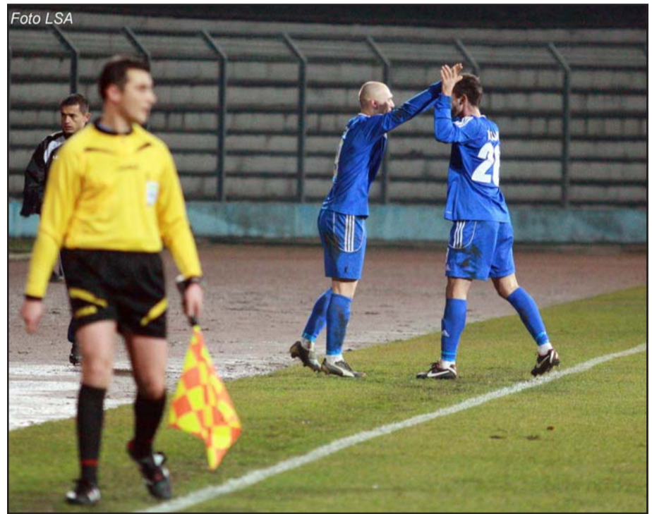
Në foto: Çota duke festuar golin e barazimit të përkohshëm me Tiranën. Në fund, bardheblutë fituan me rezultatin 2-1

Skuadra e Kastriotit nuk ka arritur dot të shkojë më tepër se një barazim 1-1 në takimin e parë të fazës së dytë në një fushë neutrale, atë të stadiumit "Ruzhdi Bizhuta" të Elbasanit. Ky barazim për skuadrën e Ndreut ishte i dyti radhazi, ku në takimin përmbyllës të fazës së parë ka arritur të barazojë në "Niko Dovanën" ndaj kryesuesve të Teutës, 1-1. Ndeshja e dy ditëve më parë ka pasur dy tablo. Një pjesë e parë në disavantazh të kundërshtarit dhe në pjesën e dytë skuadra e Kastriotit ka pa-