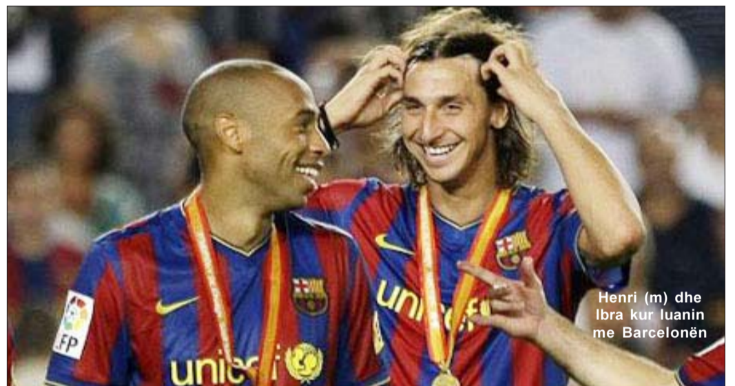
Henri (m) dhe Ibra kur iuanin me Barcelonën

Dikur shokë... - Ish-te sezoni 2009-2010 kur Barcelona vendosi të hiqte Samuel Eto'onë dhe, pasi Reali zyrtarizoi Ronaldon e Kakanë, bëri investimin gjigant prej 80 mln eurosh për të marrë Zlatan Ibrahimoviçin (Eto'onë dhe 50 mln euro). Ishte Barcelona që ëndërronte për Champions, por që nuk e fitoi. Megjithatë, Zlatani e ndihmoi të fitonte titullin dhe Superkupën e Spanjës. Bashkë me Ibrën, në atë Barcelonë, luante edhe Tierry Henri. Të dy kishin një raport të shkëlqyer me njëri-tjetrin dhe, në fund të sezonit, u larguan, njëri drejt Italisë, Milanit, tjetri drejt Amerikës, Los Anxhelos Galaksi. Sot, në Milano, do të ndeshen.