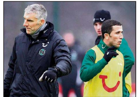
Lala sapo ka ofenduar zëvendëstrajnerin. Trajneri Slomka e dërgon para kohe në dushë