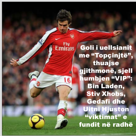
Goli i uellsianit me "Topçinjtë", thujse gjithmonë, sjell humbjen "VIP": Bin Laden, Stiv Xhobs, Gedafi dhe Uitni Hjuston "viktimit" e fundit në radhë