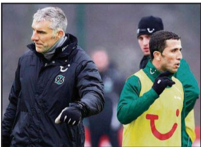
Lala sapo ka ofenduar zëvendëstrajnerin. Trajneri Slomka e dërgon para kohe në dushe