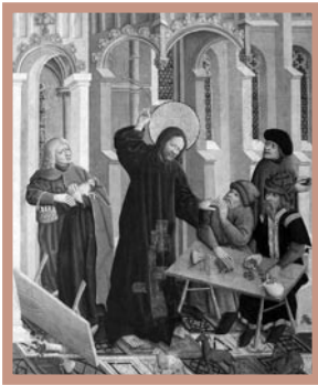
1. Wypędzenie przekupniów ze świątyni