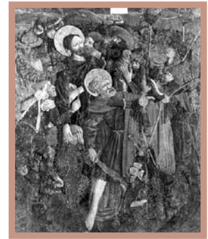
4. Pojmanie Chrystusa