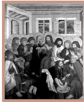
3. Umycie nóg w Wieczerniku