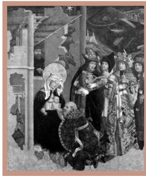
2. Pokłon Trzech Króli