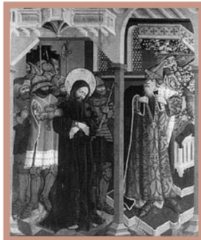
6. Chrystus przed Kajfaszem