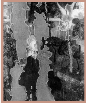
1. Rewers: Zwiastowanie św. Annie