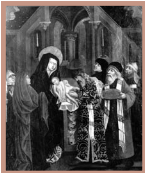
5. Rewers: Obrzezanie