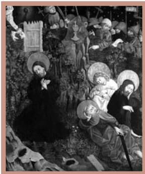
5. Modlitwa w Ogrojcu