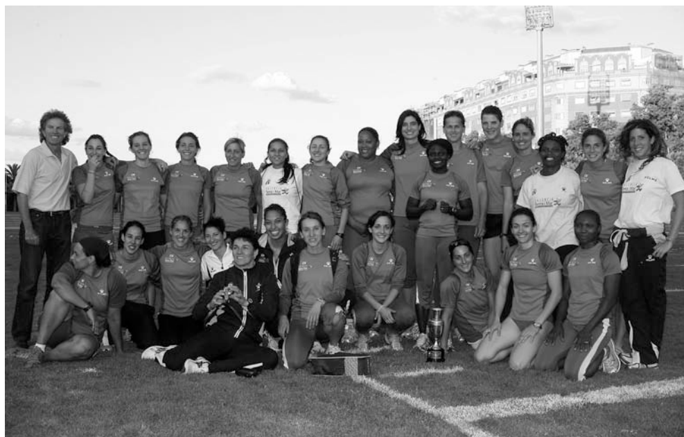
Los dos campeones del Campeonato de España de clubes 2009: El Playas de Castellón (hombres) por primera vez en su historia, y el Valencia Terra i Mar (mujeres), un dominio que dura ya 17 años.