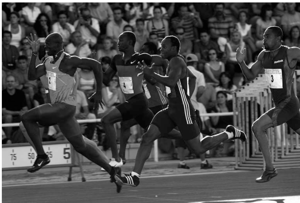
Francis Obikwelu imponiéndose en los 100m de la Reunión de Salamanca

5. Cathleen Tschirch GER 11.64 - 6. Carla Tavares POR 11.65 - 7. Schilonie Calvert JAM 11.66 - 8. Glory Alozie 11.76 - Serie B (+4,0): 1. Belén Recio 11.51 - 2. Gloria Santo POR 11.53 - 3. Silvia Riba 11.69 - 4. Tania Duarte POR 11.89 - Serie C (+0,8): 1. Paula María Caminero 12.54