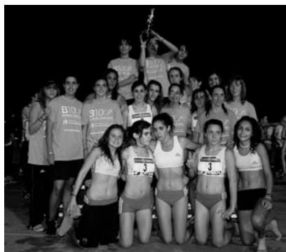
Los dos equipos vencedores: en hombres el C.A. Playas de Castellón y en mujeres, la A.A. Catalunya