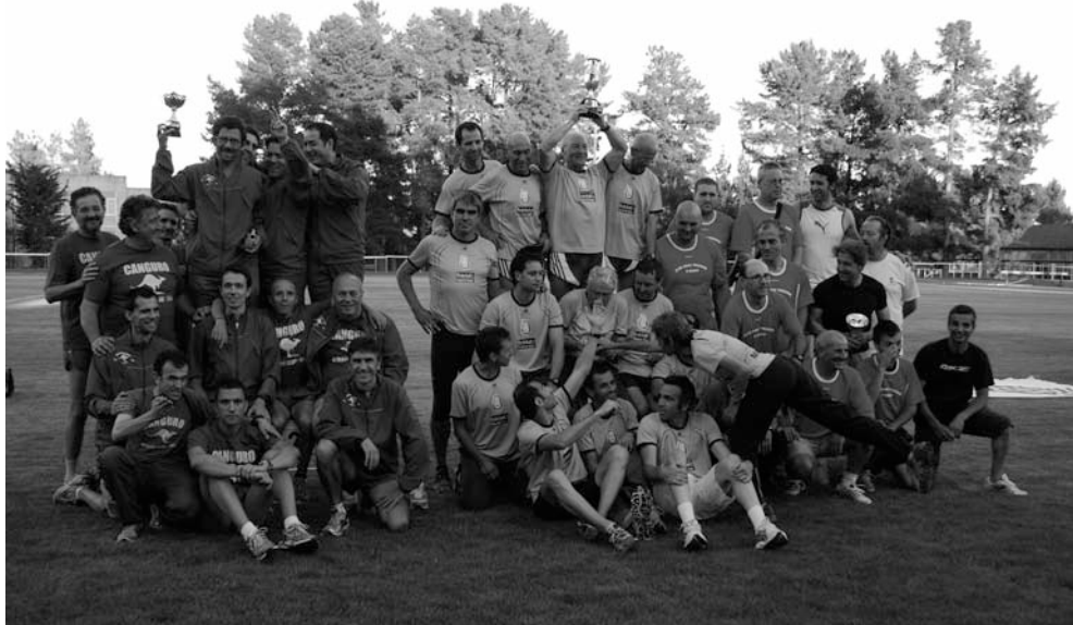
Podio masculino: de izquierda a derecha: Canguro A.C. (2º) C.A. Manresa (campeón) y ADAS Campo (3º)