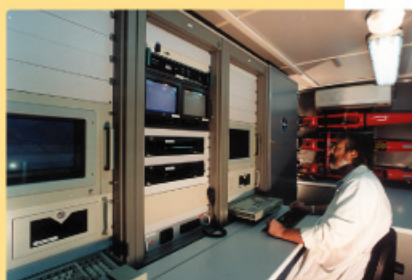
Estación de control.