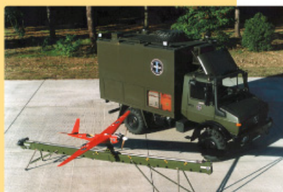
Sistema ALO completo: Estación, rampa de lanzamiento y vehículo aéreo (3).