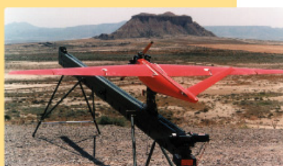
Vehículo aéreo ALO en rampa de lanzamiento.