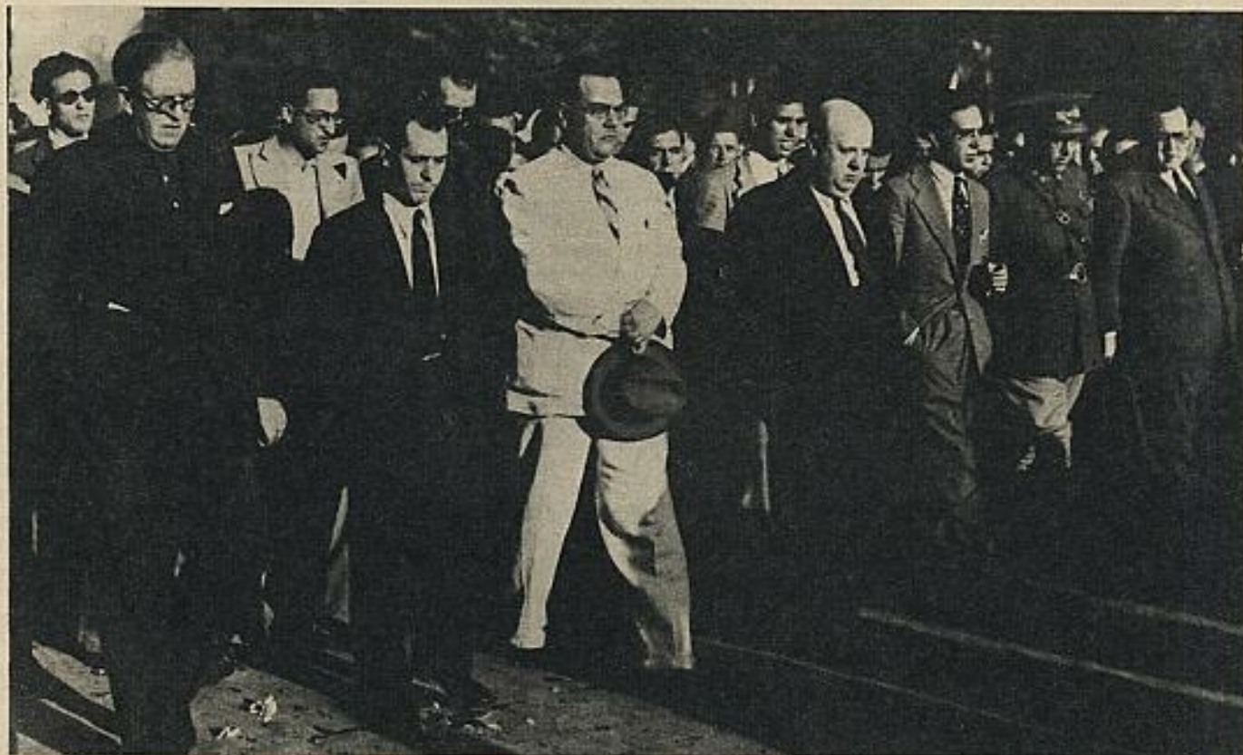
En el entierro del general Lukasc, en Valencia, Alvarez del Vayo, a la izquierda. Se ve también a Negrín, con traje blanco, Indalecio Prieto, Hernández y al coronel Rojo.