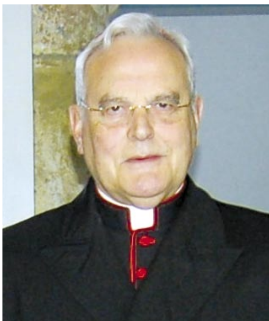
Cardenal Amigo Vallejo.

A su regreso, y tras un primer periodo de investiga-