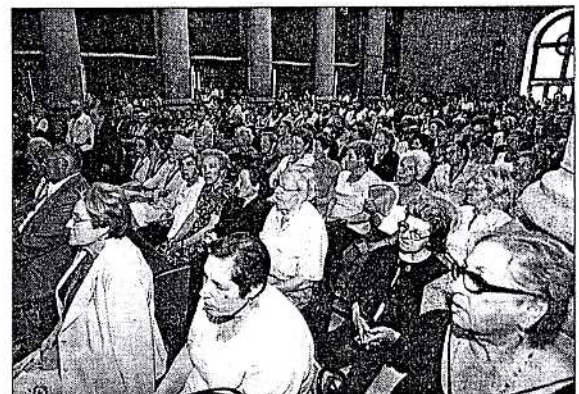
Celebración de la novena, ayer en la concatedral.

Continúan así los actos previos a la celebración del Cristo de la Victoria, que ya comenzaron el día 28 de julio, nueve antes del primer domingo de agosto, con la celebración de las novenas. Estas