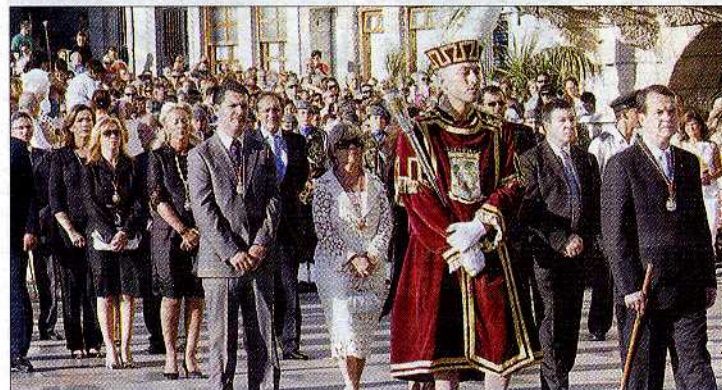
El alcalde, con el bastón municipal, y miembros de la Corporación, cerraban la comitiva; a la derecha, mujeres cofrades con peinetas y cirios participan solemnes en el desfile religioso.