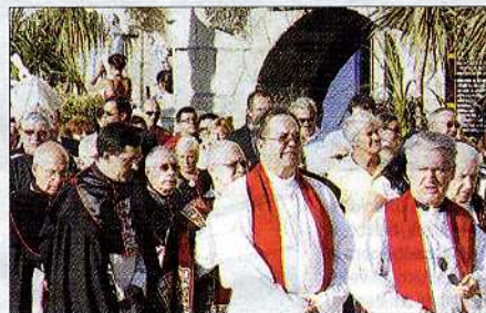
Las autoridades religiosas, con el obispo al fondo.

La comitiva llegó a Colón casi las diez de la noche, y a partir de ahí se aceleró el paso a pesar de que empezaba la pendiente. Cruzó la calle Príncipe por primera vez en casi dos décadas, y en la Porta do Sol se realizó la tradicional ofrenda al Cristo. El obispo de Tui-Vigo habló ante las miles de personas congregadas, y después los cofrades se encaminaron al Casco Vello para poner fin al multitudinario acto religioso con la entrada de la efigie en la Concatedral Santa María.