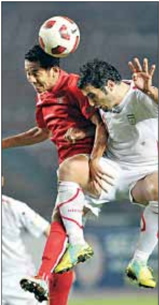
عملکرد تیم ملی در سال ۲۰۱۱