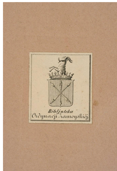
Eklibris: Z Biblioteki Ordynacji Zamojskiej z herbem „Jelita” BN rps BOZ 2054, t. 3