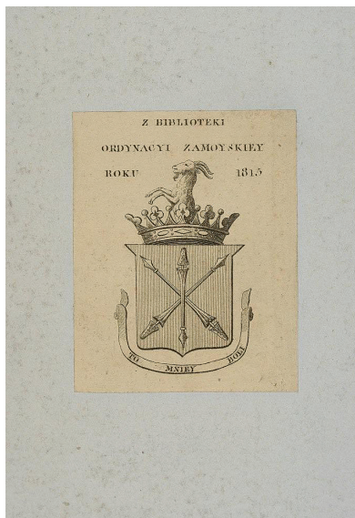
Eklibris: Z Biblioteki Ordynacji Zamojskiej Roku 1815 , w środku pola herb „Jelita” z Koźłorogiem nad koroną, pod tarczą herbową na wstępie zawołanie: To mniey boli BN rps BOZ 2054, t. 1