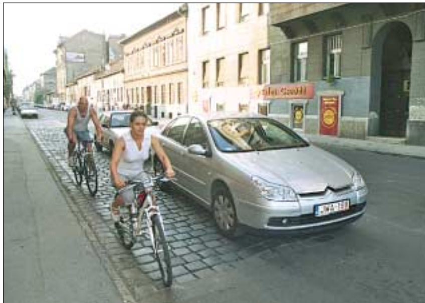
A biciklisek és az autók békés egymás mellett éléséhez több megértés kellene

- elől fehér, - oldalán borostyánsárga, - mindkét oldali lábpedálon elől és hátul borostyánsárga fényvisszaverővel, - a kerékpár bal oldalán elhelyezett szélességjelzővel, mely előre fehér, hátra piros színű fényvisszaverőt tartalmaz.