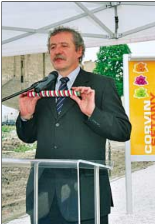
Az ideiglenes Corvin Sétány avatásakor a polgármester stafétabotot adott át a Futureal cég képviselőjének

- Minden megszorító gazdasági intézkedés szavatvesztéssel is jár, ez elkerülhetetlen. Azt gondolom azonban, hogy más a parlamenti és más az önkormányzati választás lelkülete. Az előbbinél elsősorban pártokra szavaznak a választók, az utóbbinál inkább személyekre. A törvények, a kormánydöntések teremtik meg mindannyiunk életének kereteit, de azon belül egy város, egy kerület milyen irányt vesz, hogyan gazdálkodik, él-e a