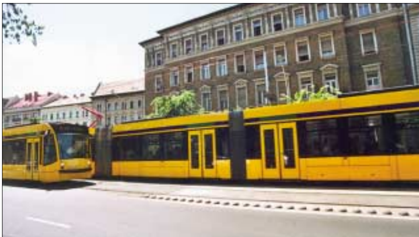
A dicső múlt és az elképzelt jövő. Kombinók ha működnek és találkoznak

A pályázat elbírálásának határideje 2006. október 15.