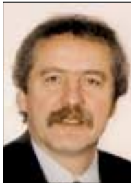
Csécsői Béla Józsefváros polgármestere

Minden lapszámunkban hét kérdést teszünk fel Csécsői Béla polgármesternek. E rovat célja, hogy a legilletékesebbnek tegyük föl mindazokat a kérdéseket, melyeket olvasóink lapunkhoz eljuttatnak, és melyeket szerkesztőségünk is fontos közügynek értekel.