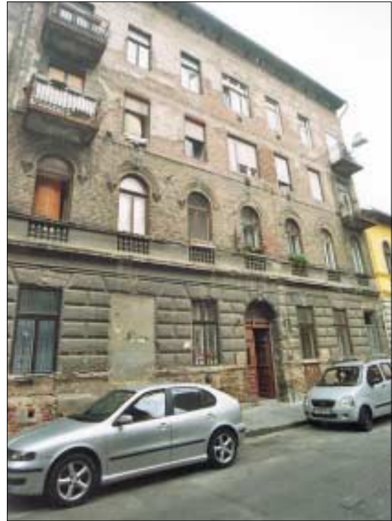
A Szigetvári utca 4. számú ház homlokzata

- A figyelmes járókelők apró változást vehetnek észre az Erdélyi utcai iskola előtt sétálva. Új tábla került a kapu mellé: Általános Iskola és Gimnázium, Erdélyi utca. Persze nem a tábla a fontos. Szeptembertől mindenki, aki az Erdélyi utcai iskolába írhatja első gyermekét, biztos lehet benne, hogy ha elég jól tanul, akkor 12 év múlva