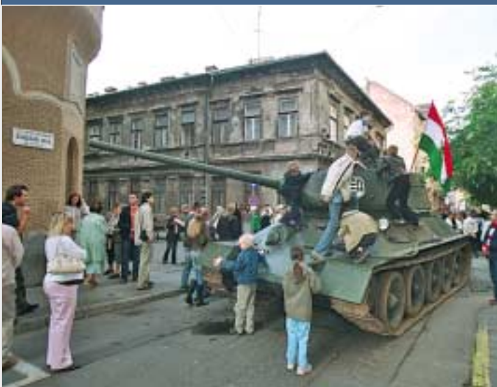
Az 1956. október 23-i eseményeket elevenítették fel korhű kellékekkel a Kisfaludy utcában