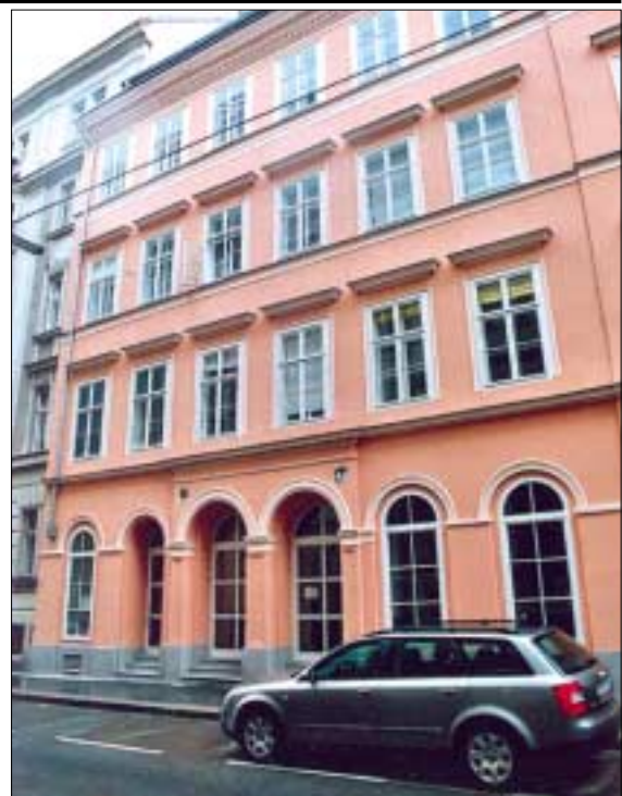
Ebben a házban élt Bécsben egy évet Munkácsy Mihály