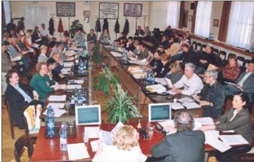
Új alakzatban ülnek a képviselők a 300-as teremben. Visszatértek az O alakú asztal rendezéshez. Az „asztalfőn” foglal helyet a polgármester és a jegyző, a többi helyen pedig a képviselők ülnek.

A képviselő-testület úgy döntött, hogy létrehozza a Pénzügyi Ellenőrző Bizottságot, amelynek a tag-