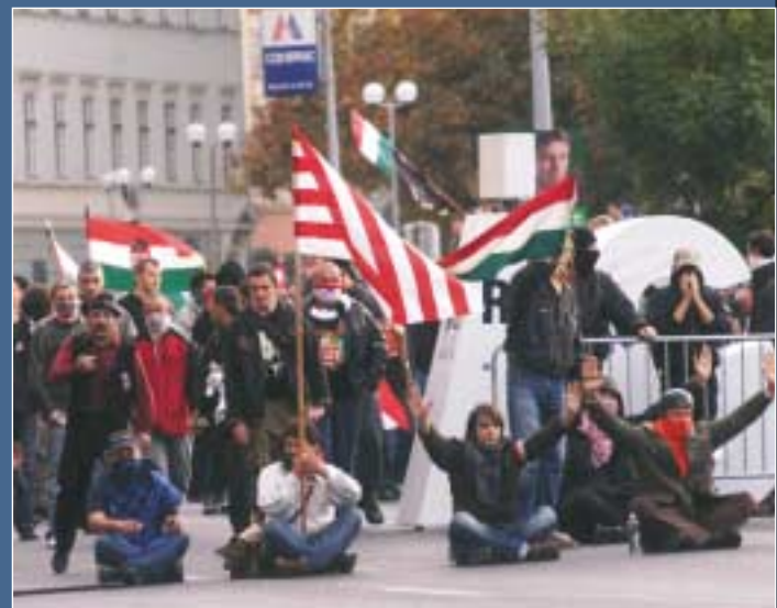
A forradalom jubileumának ünneplése utcai tüntetésekbe torkollott. Józsefvárosban több helyen is tüntetők gyülekeztek