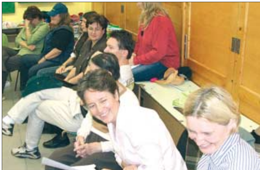
Vajdás pedagógusok a „Multikulturális nevelés“ tréningen

A sikeres pályázatnak köszönhetően, nemcsak anyagi, hanem szellemi forrásokkal is gazdagodtak az iskolák. A három intézményben kilenc különböző képzésen, szinte minden pedagógus részt vesz. A képzések napjaink pedagógiai „slágertémáit“ dolgozzák fel: multikulturális nevelés, tanári kommunikáció, kooperatív nevelés, differenciálás, hatékony tanulómegismerési tech-