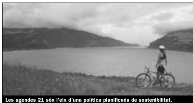
Les agendas 21 són l'eix d'una política planificada de sostenibilitat.

Els responsables de la Xarxa de Ciutats i Pobles cap a la Sostenibilitat , que agrupa 172 ajuntaments i ens locals catalans, exigeixen més competències i recursos per als ajuntaments en matèria ambiental. Sols així serà possible l'aplicació de polítiques que facilitin el desenvolupament sostenible en el camp municipal. La Xarxa, creada el 1997, ha celebrat recentment la seva 2a Assemblea general per debatre i aprovar el pla de treball per al període 2000-2001. Aquest pla de treball es fonamenta bàsicament en el desplegament de les Agendes 21 Locals com a instruments