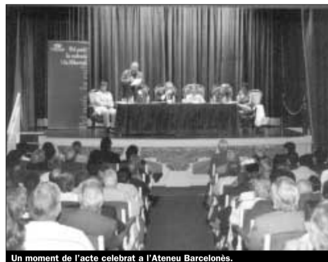
Un moment de l'acte celebrat a l'Ateneu Barcelonès.

Carod-Rovira va instar a respondre al «rearmament» d'un nacionalisme espanyol «que aposta per criminalitzar la resta d'opcions nacionals, malgrat que s'expressin per vies estrictament democràtiques».