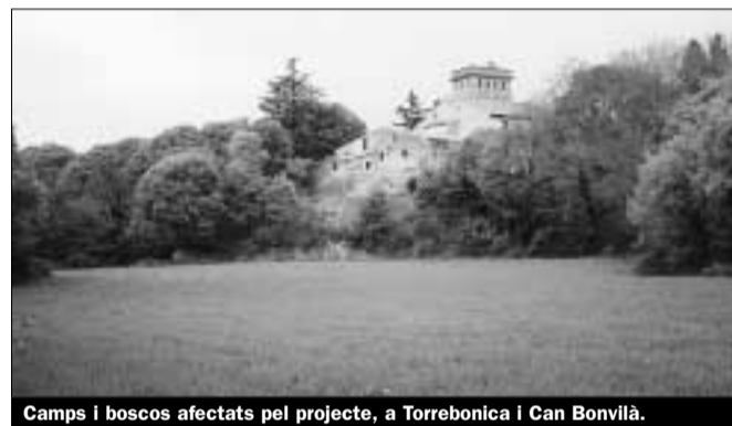
Camps i boscos afectats pel projecte, a Torrebonica i Can Bonvilà.

Ara bé, el rebuig popular a aquest projecte ha quedat ben palès. Ja s'han recollit més de 13.000 signatures de ciutadans i ciutadanes demanant la retirada d'aquest projecte, 156 entitats socials s'han adherit al manifest per la conservació de Torrebonica i el 3 d'octubre de 1999 es va manifestar més de 5.000 persones a Terrassa. És evident que la voluntat popular i les mobilitzacions han estat la resposta ciutadana a la darrera agressió que pateix el Vallès. Esperem que el Govern de Catalunya actui amb diligència per tal que tothom pugui continuar gaudint de Torrebonica i Can Bonvilà.