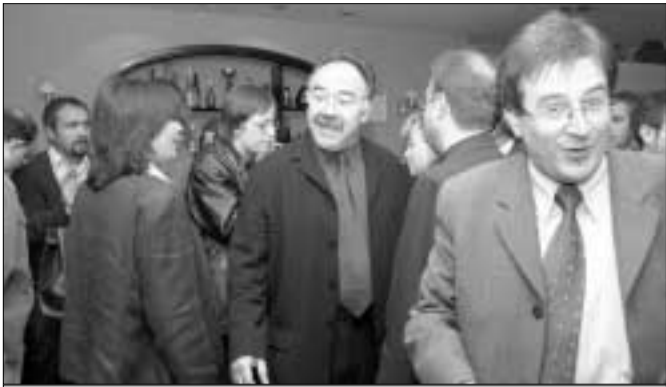
© SILVA BÜTTA / LA MARMARA