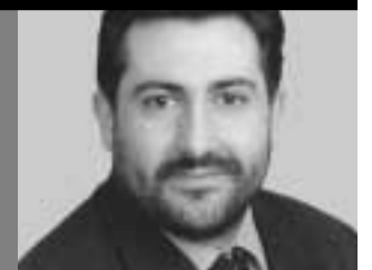
→ JOAN PUIGCERCÓS