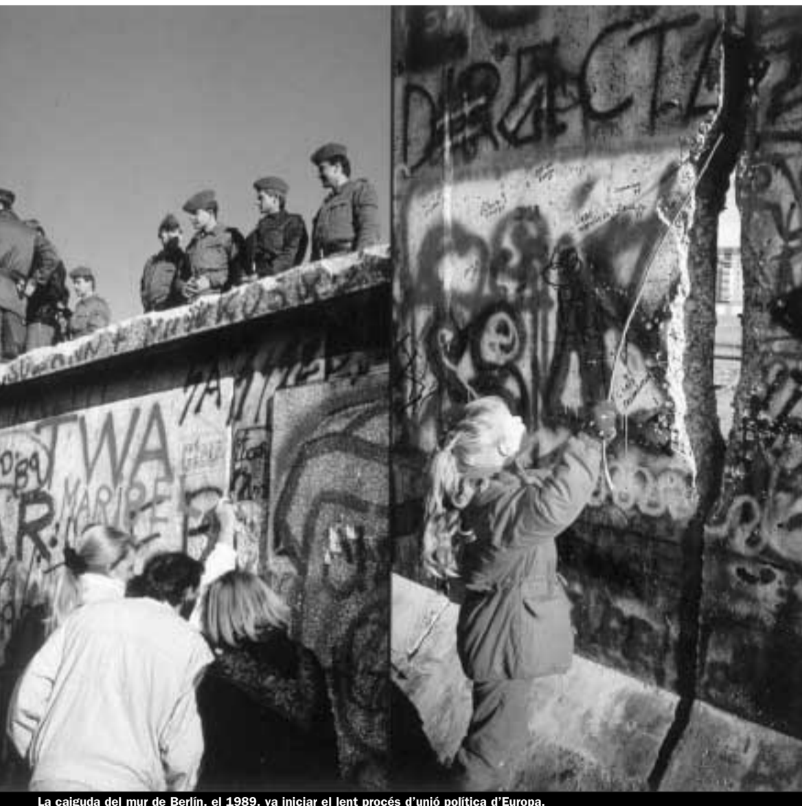
La caiguda del mur de Berlín, el 1989, va iniciar el lent procés d'unió política d'Europa.

Caldria aprofitar aquest període «constitucional» per assegurar la democratització de la institució. L'euro és una bona cosa si és un pas cap a la consecució de l'Estat català membre, a igualtat de drets i deures, d'una Unió solidària.