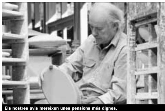
Els nostres avis mereixen unes pensions més dignes.

El Ple del 24 de maig rebutjà amb els vots de CiU i PP una proposta legislativa d'ERC perquè les pensions no contributives i assistencials s'apugessin al nivell de l'IPC català.