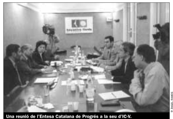
Una reunió de l'Entesa Catalana de Progrés a la seu d'IC-V.

Malgrat aquests contratemps, el grup ha començat el seu treball centrat en la reforma del reglament del