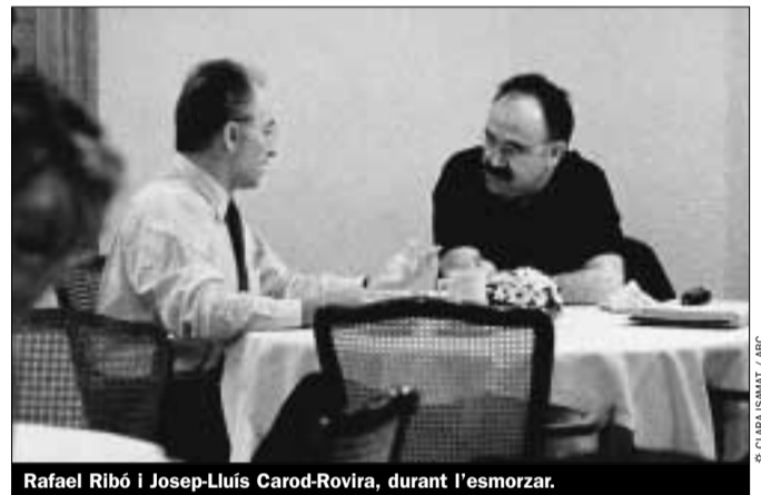
Rafael Ribó i Josep-Lluís Carod-Rovira, durant l'esmorzar.

Carod-Rovira subratllà que « ERC és una formació amb identitat pròpia, i des de la nostra identitat i autonomia, estem oberts a col·laborar amb totes les forces catalanes de tradició democràtica » però que « en cap