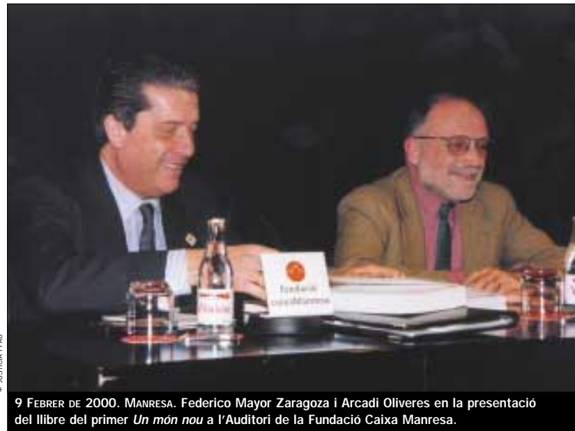
9 FEBRER DE 2000. MANRESA. Federico Mayor Zaragoza i Arcadi Oliveres en la presentació del llibre del primer Un món nou a l'Auditori de la Fundació Caixa Manresa.

Vaig tenir la sort de ser a Seattle. A mi em va rejuvenir. Primer va ser una protesta contra el procés de globalització. I a més, la protesta sorgia des dels beneficiaris d'aquesta globalització. Hem vist altres tipus de protesta com ara a Chiapas, però a Seattle, era gent que té fei-