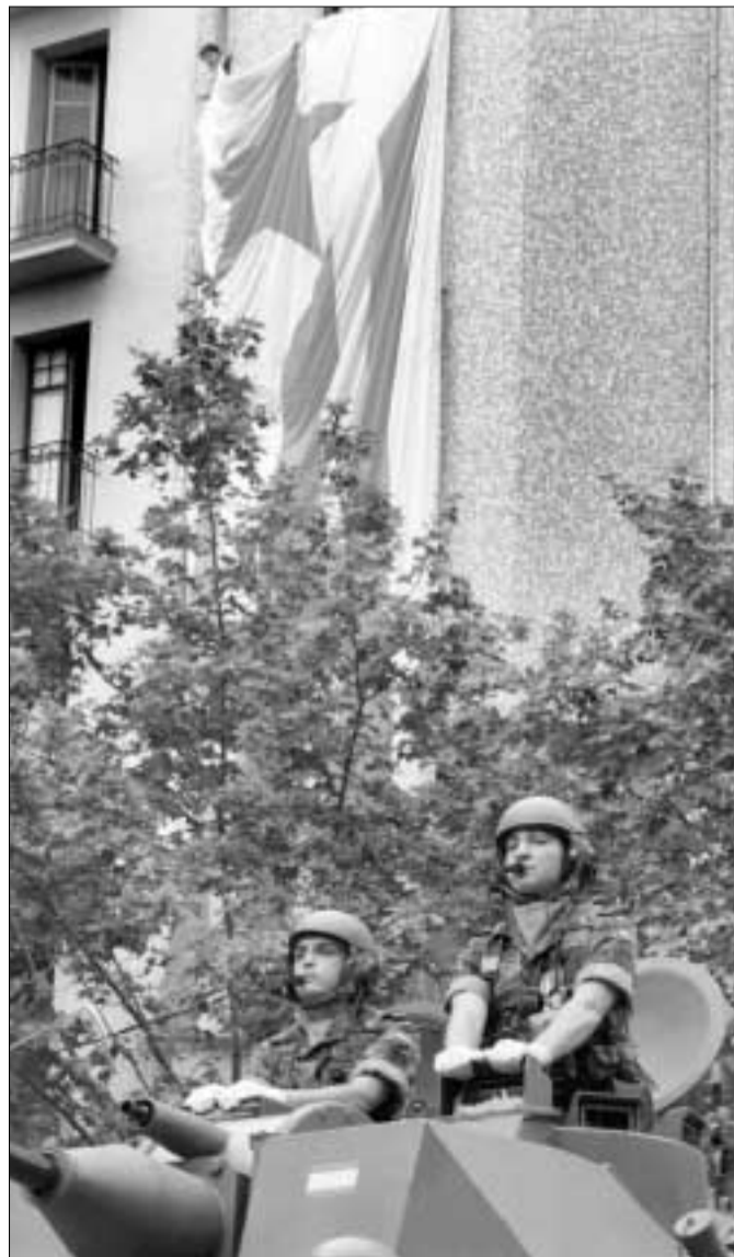
Una immensa estelada independentista recordà a l'exèrcit espanyol que la seva presència pels carrers de Barcelona no era ben rebuda.

Finalment, el mateix 27 de maig, mentre l'exèrcit espanyol desfilava finalment però sense aviació, tancs, legió ni guàrdia civil, el Parc de la Ciutadella acollia més de 45.000 persones en un festival per la pau que, més enllà de l'èxit d'assistència, esdevenia el millor contrapunt d'una jornada que havia ja fracassat definitivament com a operació política del PP a Catalunya.