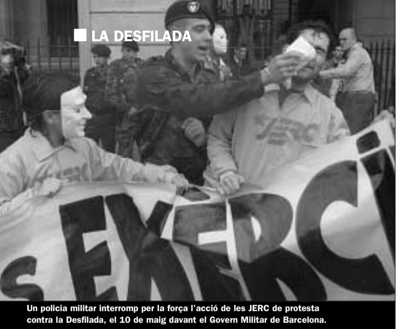
Un policia militar interromp per la força l'acció de les JERC de protesta contra la Desfilada, el 10 de maig davant el Govern Militar de Barcelona.