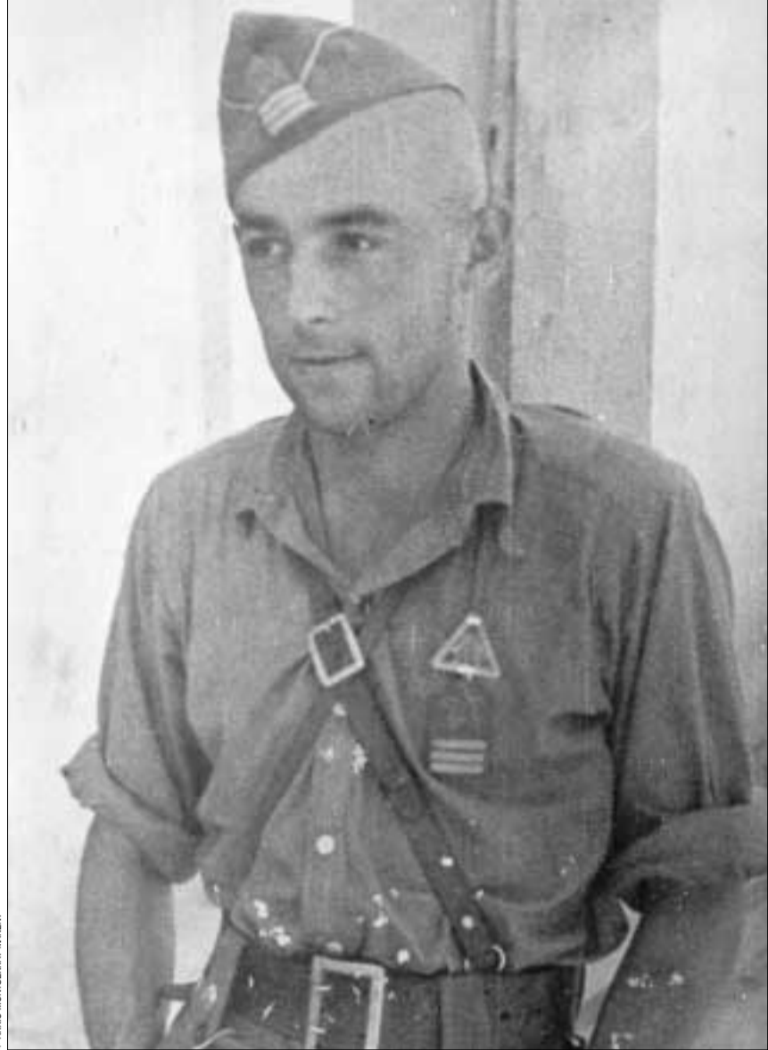
Tísner, en una imatge de la Guerra Civil.

El febrer del 1992 ingressava a ERC encapçalant conjuntament amb Jordi Carbonell el Manifest dels Nacionalistes d'Esquerra on, després d'arribar a la conclusió que Iniciativa per Catalunya —formació de la qual formava part l'Entesa dels Nacionalistes d'Esquerra, hereva de NE— « no ha portar a terme la transformació que les