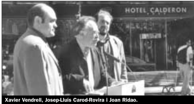
Xavier Vendrell, Josep-Lluís Carod-Rovira i Joan Ridao.