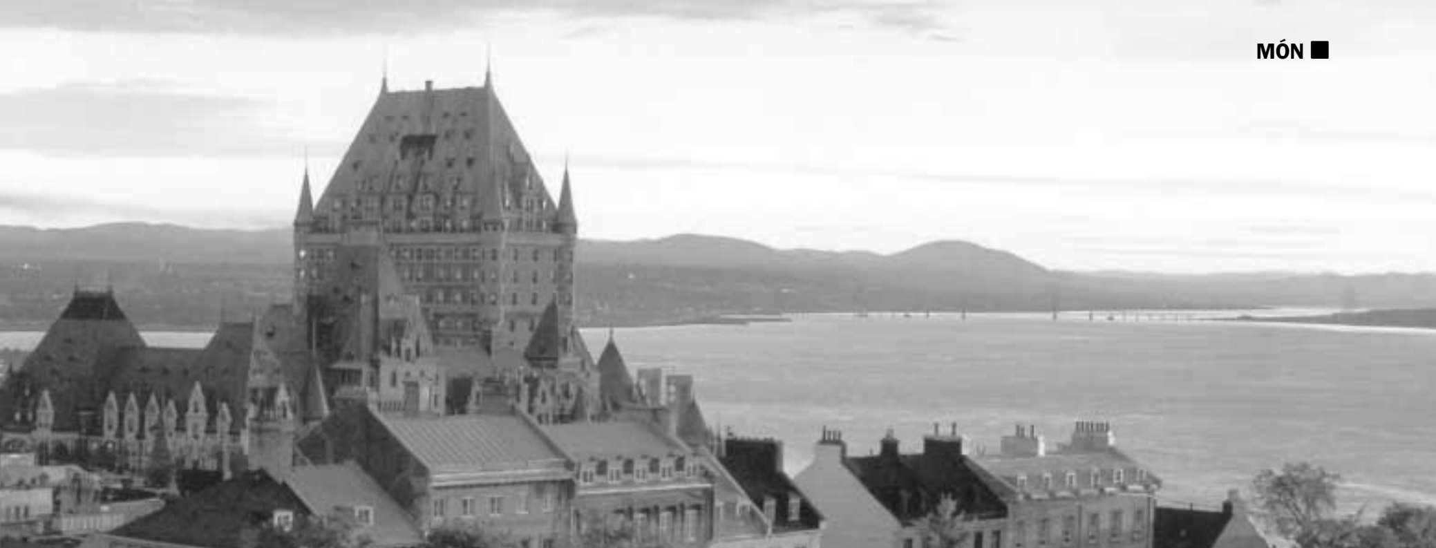
Una vista de la ciutat de Quebec, amb el castell de Frontenac en primer terme.