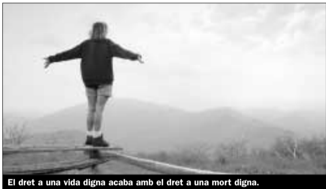
El dret a una vida digna acaba amb el dret a una mort digna.

El Ple del 26 d'abril tornà a rebutjar com ho havia fet just dos anys abans una proposta d'ERC per a la despenalització de l'eutanàsia activa exactament per la mateixa mínima diferència de vots: dos.