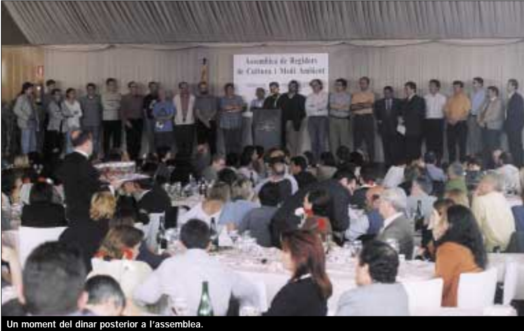
Un moment del dinar posterior a l'assemblea.