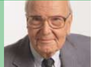
→ HERIBERT BARRERA

PRESIDENT DEL PARLAMENT DE CATALUNYA (1980-1984)