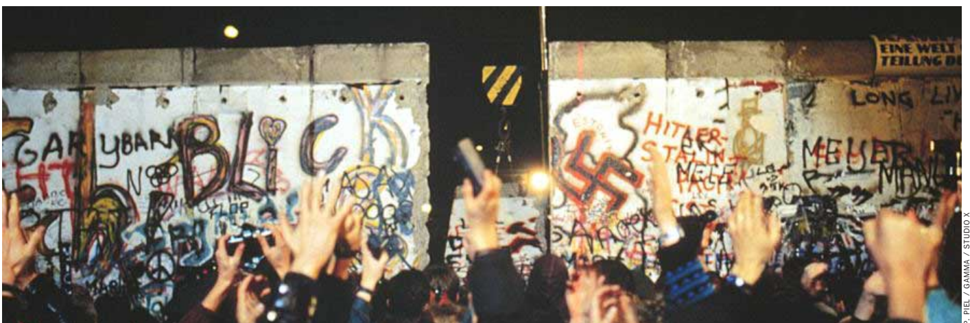
Maueröffnung in Berlin (1989): „Die deutsche Frage steht nicht auf der Tagesordnung“