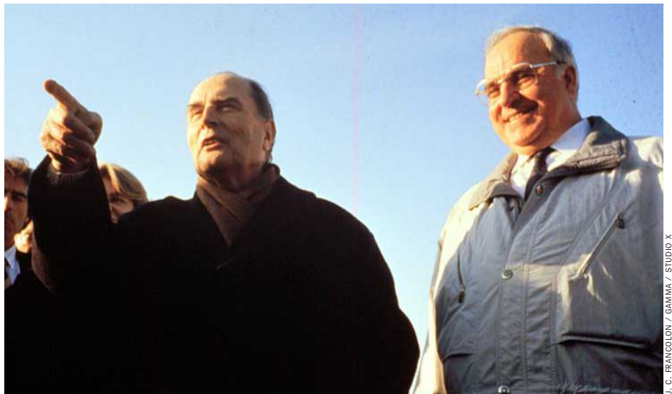
Europäer Mitterrand, Kohl in Latche (1990): Kampf um Macht und Interessen

Die bislang streng unter Verschuß gehaltenen Akten aus dem Bonner Kanzleramt zeigen, wie schwer sich Kohl und der französische Staatspräsident François Mit-