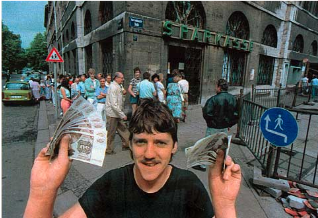
D-Mark-Umtausch in Leipzig (1990): Ohne Euro keine Einheit

Kohl hätte es genügt, auf dem Gipfel in Hannover unverbindlich den Fortschritt in der politischen Einigung Europas zu beschwören. Auf einen festen Zeitplan wollte er sich unter keinen Umständen einlassen.