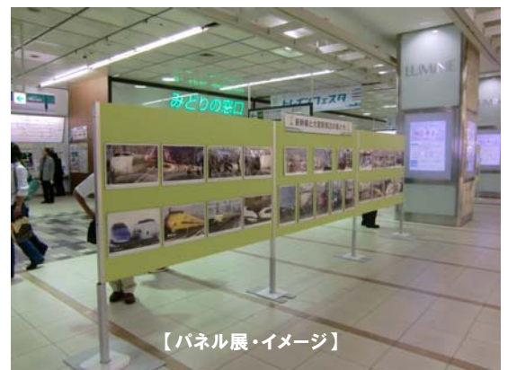
【パネル展・イメージ】