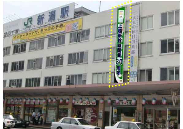
【大型懸垂幕・イメージ】