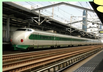
【200系開業当時色(イメージ)】