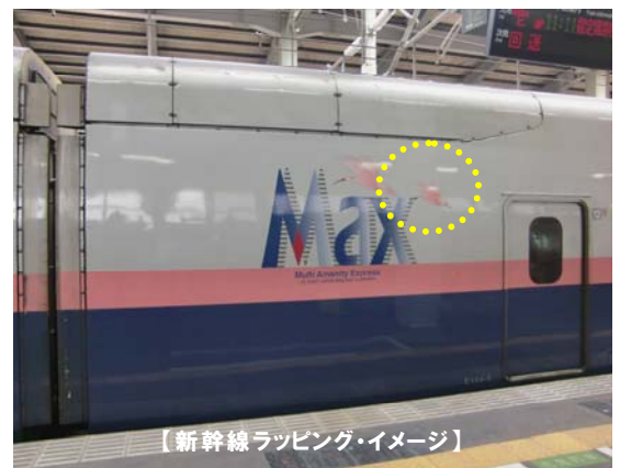
【新幹線ラッピング・イメージ】