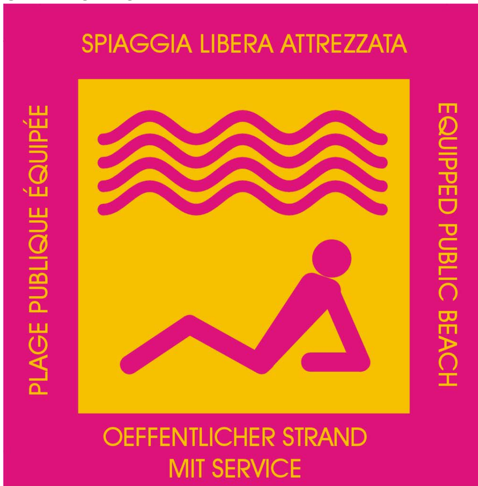
Tavola 2 CARTELLO TIPO