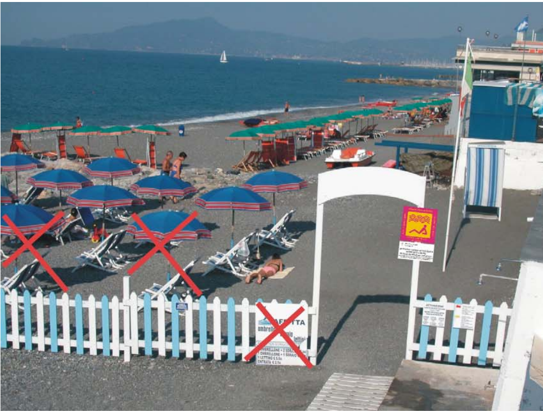
Tavola 3 ESEMPI DI POSIZIONAMENTO DEL CARTELLO