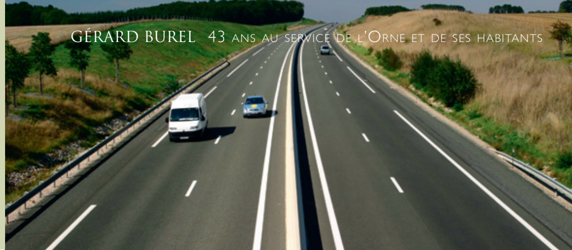
Parmi les importants chantiers routiers impulsés, celui de l'autoroute A28, mise en service en 2005