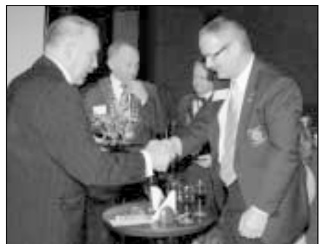
Valdytojas dėmesio centre atsiduria dar iki prasidedant jo kadencijai. Nuotraukoje: RK "Kauno tauras" dešimtmečio šventė 2007 m. kovą

Taip pat reikia nusiteikti, kad tavo namai vienerius metus yra valdytojo namais. Tai reiškia, kad jie atviri rotariečiams, juose dažniau nei įprastai vyksta vakarienės. Tavo rūpestis pasirūpinti ne tik vakariene, bet ir vynu bei kitomis smulkmenomis, ko nefinansuoja Rotary.