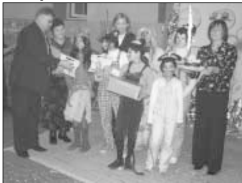
Švenčių išvakarėse Šiaulių RK nariai globojamas įstaigas lankė su dovanomis

2006 m. įgyvendinę Matching Grant projektą Šiaulių RK nariai dovanavo sportininkams specialius poreikius atitinkančią autobusą bei kitų reikalingų priemonių.