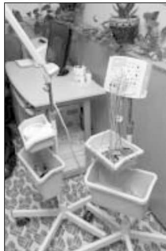
Smegenų bioelektrinių impulsų sekimo elektroencefalografo vertė - beveik 50 tūkst. litų

Sausio 3 d. Marijampolės RK apskrities ligoninei padovanojo šiuolaikišką smegenų bioelektrinių impulsų sekimo elektroencefalografą – nepakeičiamą prietaisą diagnozuojant auglius, epilepsiją ir kitas neurologines ligas. Įrangos vertė – beveik 50 tūkst. litų. Šį Matching Grant projektą marijampoliečiai įgyvendino drauge su Vyborg Asvold RK, Danija.