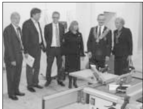
Valdytojas kiekvieną dieną su rotariečiais pietauja, vakarieniauja ar lanko vykdomus projektus skirtinguose miestuose ir skirtingose šalyse. Nuotraukoje: Vilniaus International RK projekto pabaigtuvės Vilniaus Kurčiųjų ir neprisigirdinčiųjų reabilitaciniame profesinio mokymo centre

P.: Gal sunku patikėti, tačiau viskas, kas nėra Rotary, per šiuos metus yra tiesiog atidedama: šeima, va-