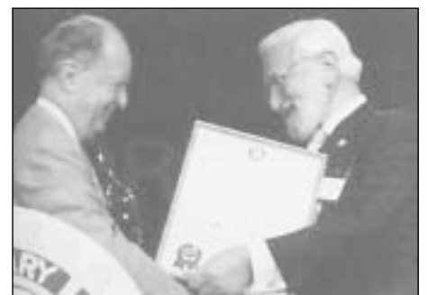
1985 m. Konvencijoje RI prezidentas C.Canseco (kairėje) teikia metinį Rotary apdovanojimą už pasaulinio supratimo ir taikos skatinimą daktarui A.Sabinui, sukūrusiam vakciną prieš poliomieliitą

Praktiškai per naktį poliomieliitas buvo sunaikintas išsivysčiusiose šalyse, kurių vyriausybės turėjo pakankamus išteklius organizuoti masines skiepų akcijas. Tačiau ligos protrūčiai nesiliovė mažiau išsivysčiusiose šalyse, kur buvo skiepijami tik pavieniai kūdikiai.