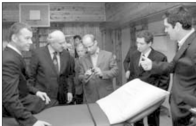
Projekte dalyvavusių klubų prezidentai ir nariai susidomėję vertino naująją įrangą

Vasario 8 d. Vilniaus universiteto ligoninės Santariškių klinikų Reabilitacijos, fizinės ir sporto medicinos centrui buvo oficialiai perduota medicininė reabilitacijos įranga. Ją dovanavo dešimt Lietuvos, Danijos ir Vokietijos Rotary klubų. Bendra projekto „Reabilitacijos įranga. Būkime kartu“ vertė – daugiau nei 130 tūkst. litų.