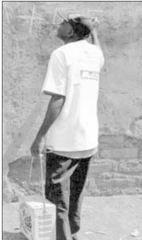
Šis užrašas reiškia, jog namo gyventojai buvo paskiepyti nuo poliomieliato

Jei Rotary 1985 m. nebūtų pradėjusi PolioPlus, iki organizacijos šimtojo jubiliejaus 2005 m. pasaulyje būtų buvę 8 milijonais daugiau vaikų su poliomieliato pėdsakais. Ir, ko gero, apie 800 tūkst. poliomieliato aukų.