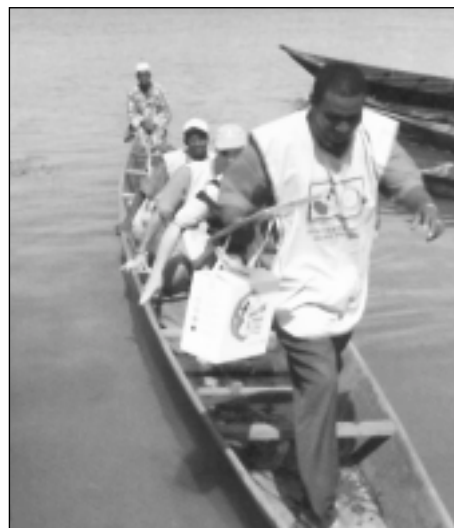
Kad pasiektų atokias vietas, Rotary skiepų akcijų savanoriams tenka keliauti įvairiais būdais, taip pat ir kanojomis

Galiausiai 43 komitetų pasiekimai jau švietė lentoje: surinkta 100.163.580 JAV dolerių. Liko paskutinis 44 ko-