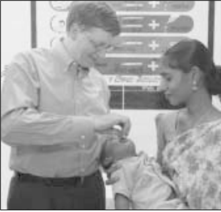
Billas Gatesas yra pasirengęs padėti Rotary pasiekti užsibrėžtą tikslą

Didžioji pirminio – 100 mln. JAV dolerių – įnašo dalis bus panaudota masinėms skiepų kampanijoms, poliomieliito viruso sekimo procesams, bendruomenių švietimui bei paslaugų centrams. Dalis lėšų bus panaudota poliomieliito viruso perdavimo galimybių tyrimams bei prevencijai. Rotary dotacijų forma lėšas skirstys PSO ir UNICEF.