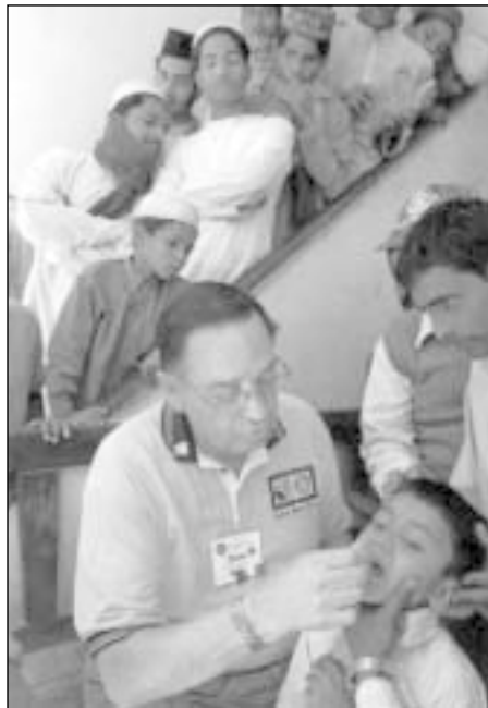
Rotary organizuojamos nacionalinės skiepų dienos kėlė ir susidomėjimą, ir nerimą vietos gyventojams tarpe

Nors susitikimas užtruko, rotariečiams pavyko įtikinti ponią Marcos pasirašyti leidimą. Su reikiamu dokumentu RI pareigūnai nuvyko tiesiai į artimiausią įrengtą skiepavimo centrą, kur jau laukė šimtai motinų su vaikais. J.L.Bomaras mažai mergaitėi į burnytę įlašino pirmuosius du vakcinos lašus.