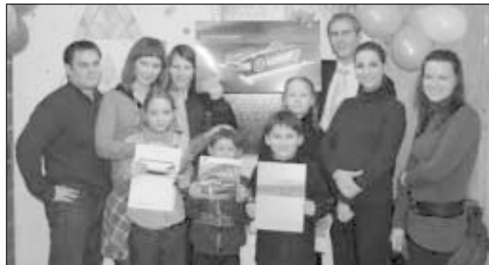
Vaikai verslininkus stebino savo žiniomis apie automobilius

Š.m. sausio 17 d. Vilniaus SOS vaikų kaimo klube lankėsi kompanijos „Verus auto“ atstovai. Vaikučiai nuo penkių iki penkiolikos metų susidomėję klausėsi istorijų apie automobilių kūrimą, žiūrėjo filmukus ir nuotraukas su naujausiais automobilių modeliais, drauge su svečiais diskutavo apie automobilių saugumą, didžiausią išvystomą greitį, aplinkos taršą bei saugų eismą.