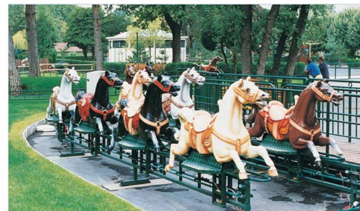
Ballade forestière au Jardin d'acclimatation - Paris (75)