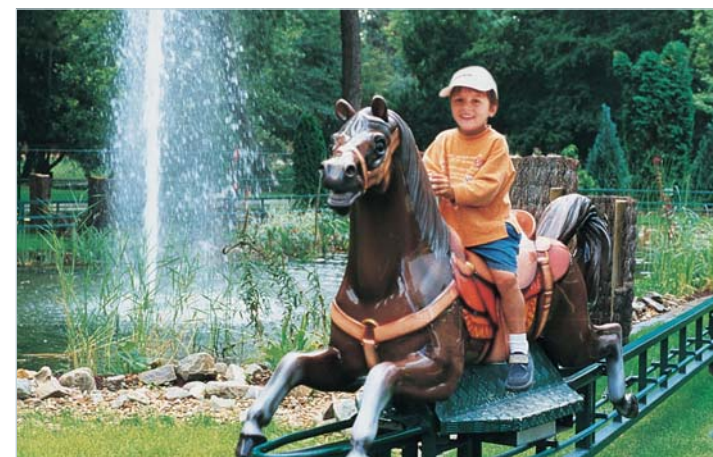
Chevauchée Western à Papea city (72)