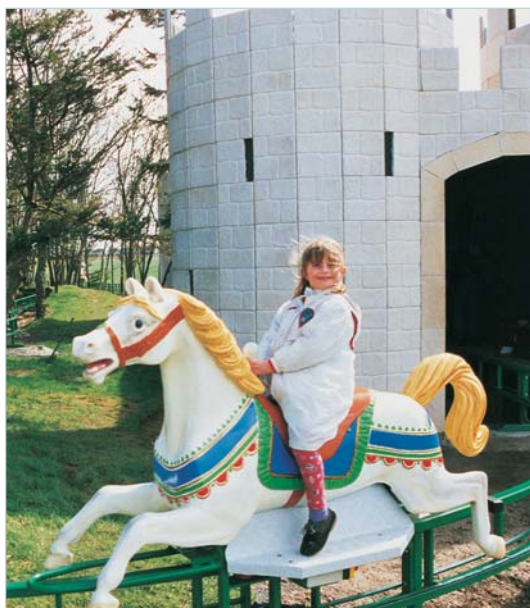
La chevauchée de Guillaume le Conquérant à Festyland (14)