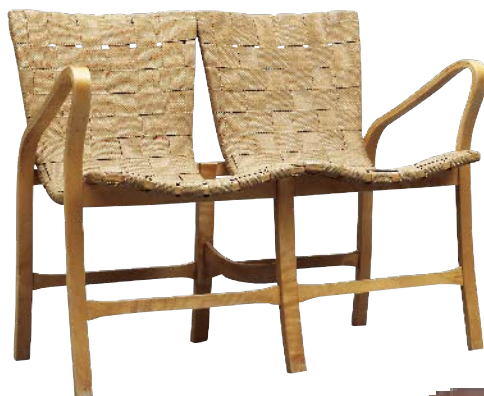
Konferensstolen som soffa.