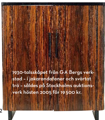
1930-talsskåpet från GA Bergs verkstad - i jakarandafaner och svartat trä - såldes på Stockholms auktionsverk hösten 2005 för 19 500 kr.