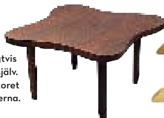
Typisk GA-bord med organisk form. Att en möbel är märkt GA Berg innebär inte nödvändigtvis att den ritades av GA Berg själv. Arkitekten Olof Östberg på kontoret ritade flera av möblerna.