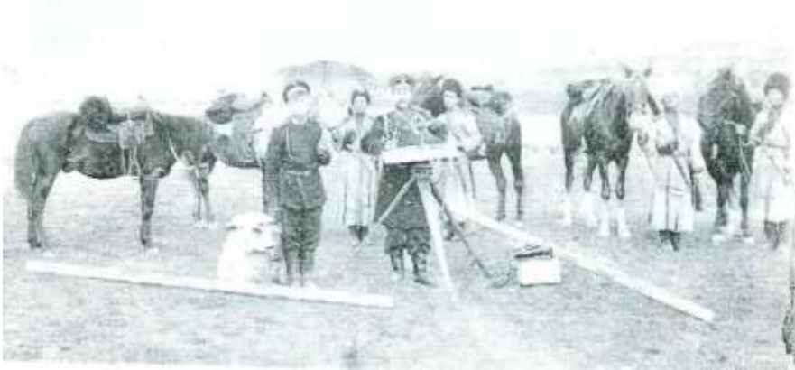
Mayor İbrahim ağa Vəkilov – 30 avqust, 1901-ci il, Qars şəhəri yaxınlığında topoqrafiya çəkilişində.