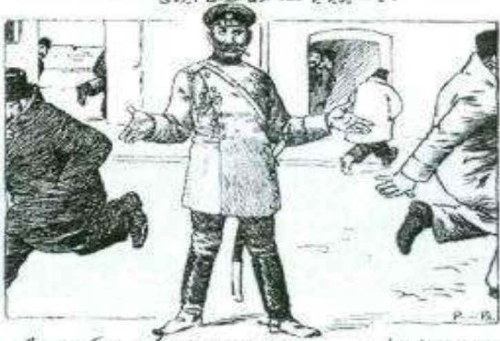
Na oyo fiammaboyamamama na oyo fiammaboyamamama. J. A. I. Afegoragameci na oyo fiammaboyamamama