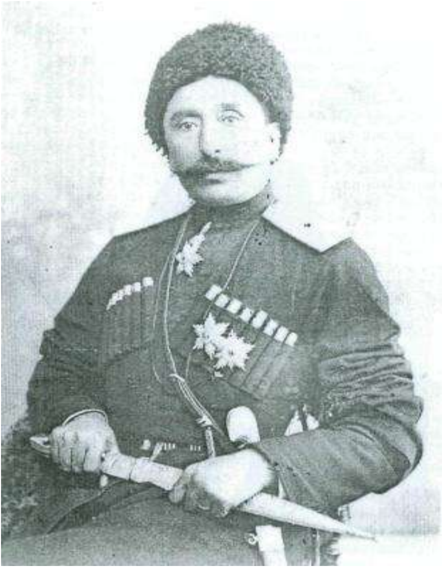
General Əliğa Hacı İsmayıl oğlu Şıxlinski (1865-1943). Şəkil 12 may 1900-cü ildə Qəzvin şəhərində çəkilib. Şəkil ilk dəfə dərc olunur.