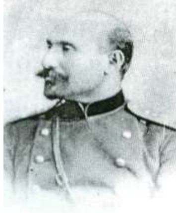
Podpolkovnik Əliqə Şıxlinski (1865-1943).