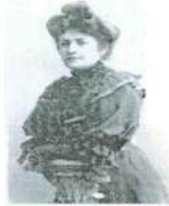
İlk azərbaycanlı şəfqət bacısı Nigar xanım Mirzə Hüseyn qızı Şıxlinskaya (1870-1931).