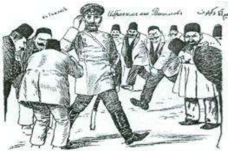
Kinga na bini Afegoragameci na oyo fiammaboyamamama Afegoragameci. J. A. I. Afegoragameci na oyo fiammaboyamamama