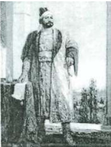
Fətəli xan Hüseynəli xan oğlu Qubalı (1735-1789).