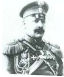
General Hüseyn xan Naxçıvanski (1863-1919).