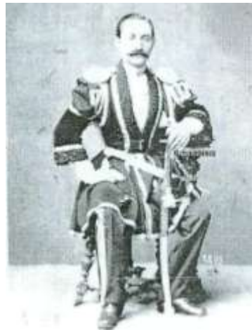
General-leytenant Fərəc bəy Ağayev (1811-1897).