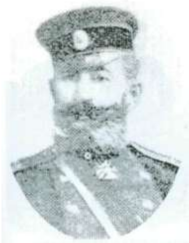
General Səməd bəy Sadıq bəy oğlu Mehmandarov (1855-1931).