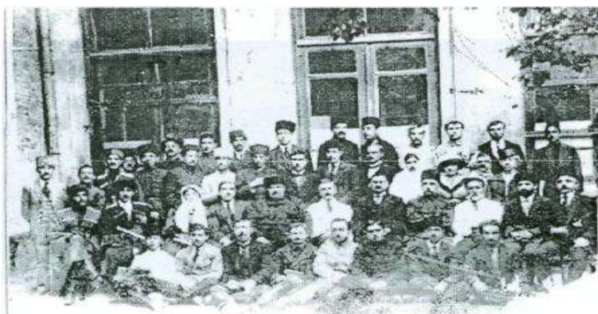
Parlamentin dəftərxana üzvləri.