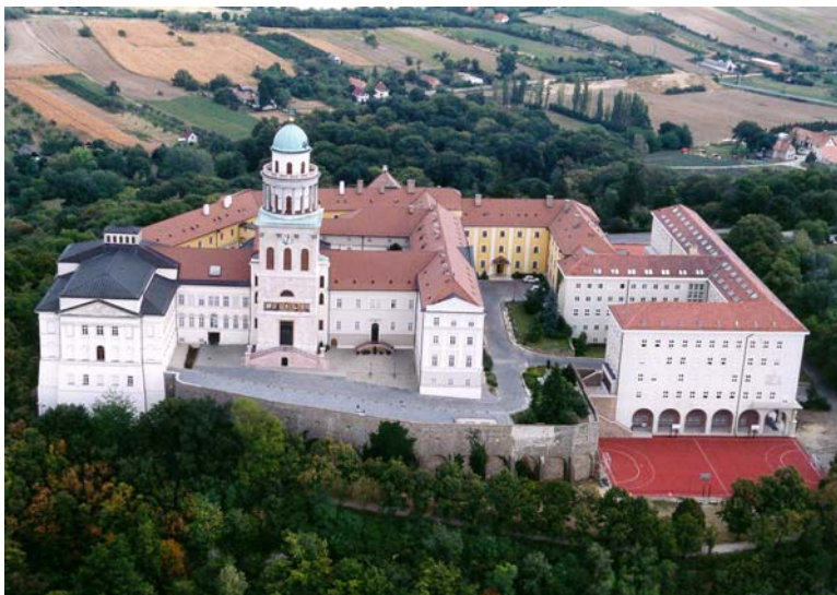
A pannonthalmi apátság madártávlatból

kelt kiváltságlevele szerint édesapja, Géza fejedelem alapította valószínűleg 996 -ban. Olyan kiváltságokat kapott, mint amilyeneket a bencések anyamonostora: Monte Cassino. A kiváltságlevelen kívül ma levéltárában őrzik legrégebb nyelvemlékünket: a tihanyi apátság 1055-ből származó alapítólevelét is.