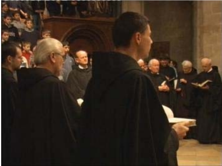
Vesperas: esti ima

ráztam, kertészkedtem és gazdálkodtam, érdekelt a galamb-és baromfitenyésztés és állatszelidítő is akartam lenni. Sokat olvastam.