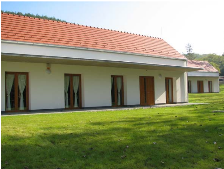
Szent Jakab Zarándokház a Cseider völgyben

A gondnok már hallott valamit, úgy tudja, hogy a Levéltárba jöttem tudományos kutatóként állambiztonsági ügyekben, az Apátsági Pincészet lelkes ifjú menedzsere a sajtómunkások nagyüzemi forgalmához illő rutinszerű kérdészt teszi fel: "Melyik sajtószervnek lesz a nyilatkozat?" Ezzel szemben a Látogató Központ fogadóépületénél beállunk a sorba, fizetünk a kasszánál, s a TriCollis Apátsági Tárlatvezető Iroda csoportjaival járjuk be a világorökség részét. Előbb egy negyedórás filmet vetítenek, ez készít elö a másfél évezredes életformával, a szerzetesközösség mindennapi életével való találkozást, azzal a szellemiséggel és hagyomány világgal, melybe a XXI. századi turista belecsöppen, amikor belép a monostorba. Két napi utunk állomásai idegenforgalmi reklám nélkül: Bazilika, altemplom; Porta Speciosa és a ke-rengő; Boldogasszony kápolna; Millenniumi emlékmű; Könyvtár; Levéltár; Gyűjtemények; Arborétum; Apátsági Pincészet; Apátsági termékek. Nem látogatható a barokk ebédlő, mert "... a szerze-