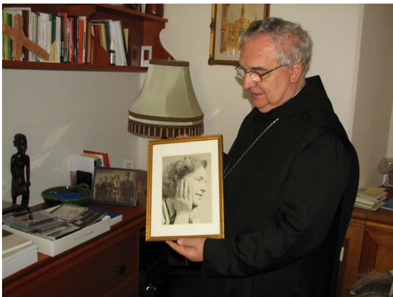
„Édesanyám salamonfai, illetve csepregi”