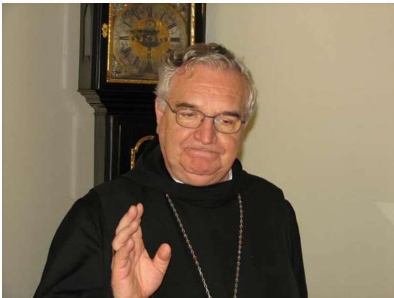
„Figyelmeztettek: 'Jó lesz, ha befogod a pofád!'”

Akárcsak akkor, amikor 1989-ben esztergomi segédpüspökként Bécsben az Actio Catholicában nyilatkoztam a sajtónak a hazai változásokról, s arra a kérdésre, hogy miért oly lassú Magyarországon a katolikus egyház, azt válaszoltam: azért, mert a Belügyminisztérium túl aktív. Hazajöttem, ezt követően bejött egy ismerős pap és jóindulatúan figyelmeztetett: „ Jó lesz, ha befogod a pofád! ” Nyomban kihallgatást kértem az akkori művelődési minisztertől, Glatz Ferencről, s elpanaszoltam, hogy megfélemtettek igazmondásomért. Kutatóként tán tudod, hogy megsemmisített megfigyelési dossziémról azt mondták, akik még látták: tele volt „rendszerellenes” kritikai kijelentéseimmel. Más dossziém pedig nem található az ÁBTL-ben.