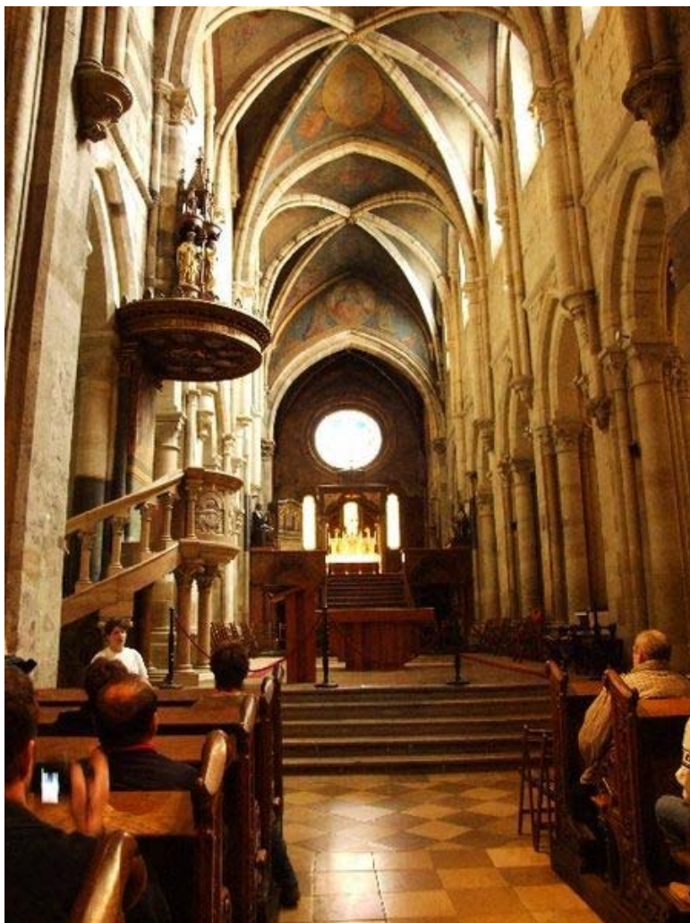
A Bazilika belülről

A Magyar Bencés Kongregáció tagjai: Pannonhalmi Főapátság, tihanyi, bakonybéli és győri perjelség, Sao Pauloi-i Szent Gellért Apátság, budapesti és révkomáromi rendház, tiszalpäri Szent Benedek Leányai Társaság kolostora. A Magyar Bencés