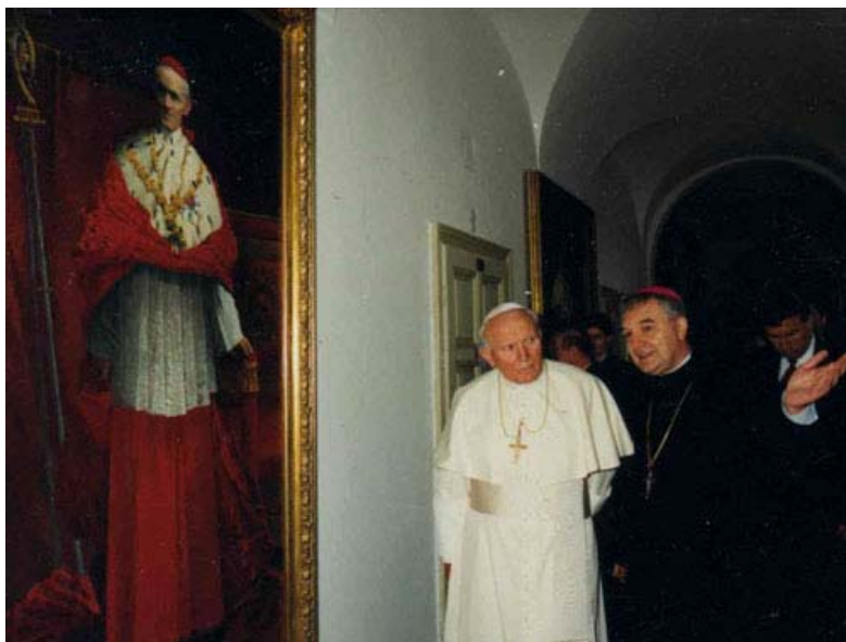
II. János Pál pápa látogatása

Kapaszkodik kis kocsim a Dózsa György út felől a Cseider völgyön keresztül szállásomhoz az erdő alján frissen épült Szent Jakab Házhoz . Rázós a horhós út vége, kövek és gyökerek tarkítják, de a legnagyobb baj az, ha szemből jön egy másik kocsis, valakinek vissza kell fordulnia, mert ketten nem férünk el egymás mellett. Egyszerű, tiszta és olcsó a szálláshely egyéni és csoportos zarándokoknak, nagycsaládoknak, kerékpárosoknak, testileg-lelkileg feltöltődni vágyóknak. Az öt különálló földszintes épületében 67 vendéget tudnak egyszerre elhelyezni, akadálymentes bejáratokkal is. Ketten vagyunk Kedvesemmel egy nyolc személyes szobában; emeletes ágyak, padlófűtés, zuhanyzó, wc., teakonyha, benne hűtőszekrény. A központi épületegyüttesben ebédlő és közösségi terem, igaz, büfé és étterem nélkül, ám kocsival tíz percre, az Apátság melletti Kosaras dombon modern, európai színvonalú, igényes étterem és borbár létesült a Látogató Központ két-szintes épületében, zöld tetőterasszal, nyitott és fedett parkolóval, kerékpártárolóval és csomagmegőrzővel. A Viator nevet kapta,