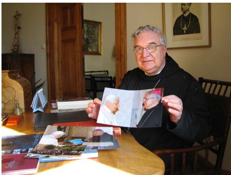
XVI. Benedek pápánál a Vatikánban

2000-ben és 2009-ben a főmonostori konvent tagjai titkos szavazással újra megerősítették főapátnak.