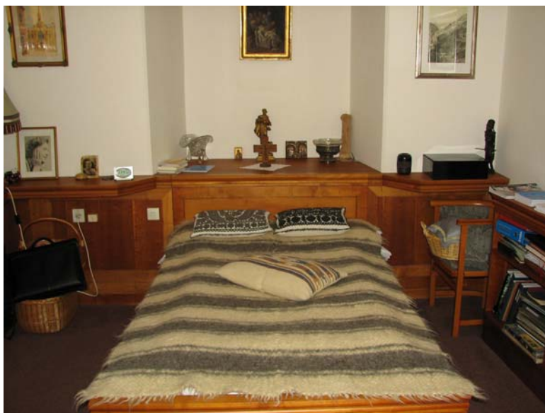
A püspök hálószobája