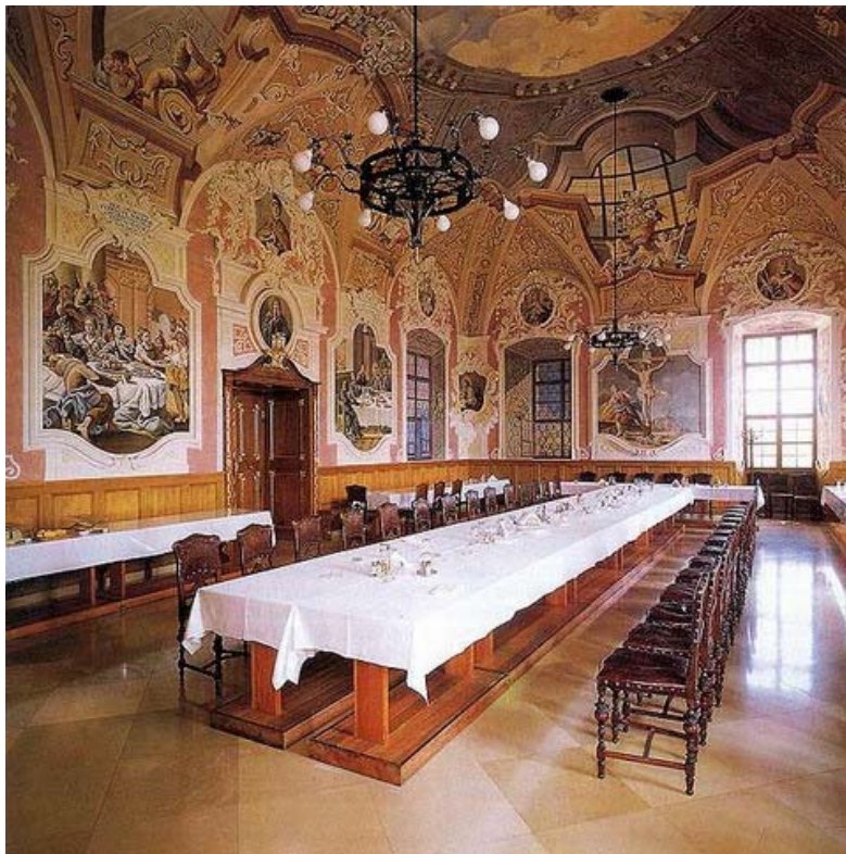
A nem látogatható ebédlő

tesközösség szűkebb életteréhez tartozik..."