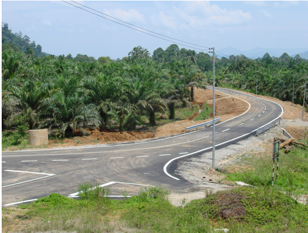
PEMBINAAN JALAN LUAR BANDAR