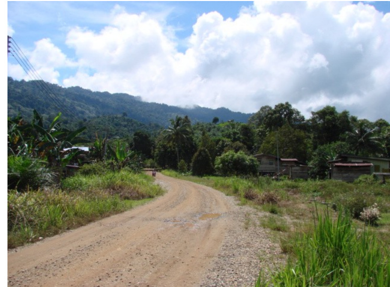
JALAN LUMOU -KEPURON