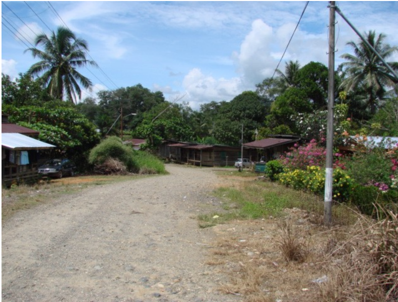
JALAN WONOD MELAPI

GAMBAR JALAN DI BAWAH SELIAAN JKR TELUPID YANG TELAH DICADANGKAN UNTUK DINAIK TARAF