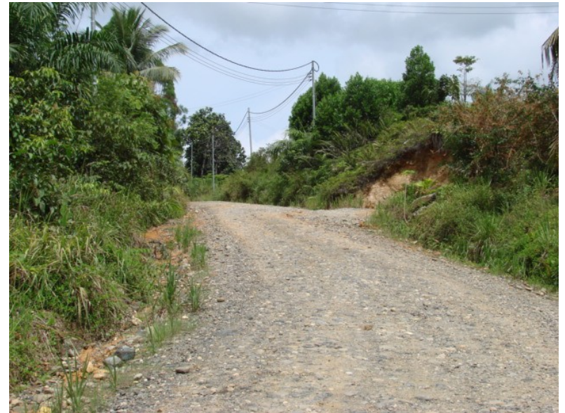
JALAN BUIS KIABAU