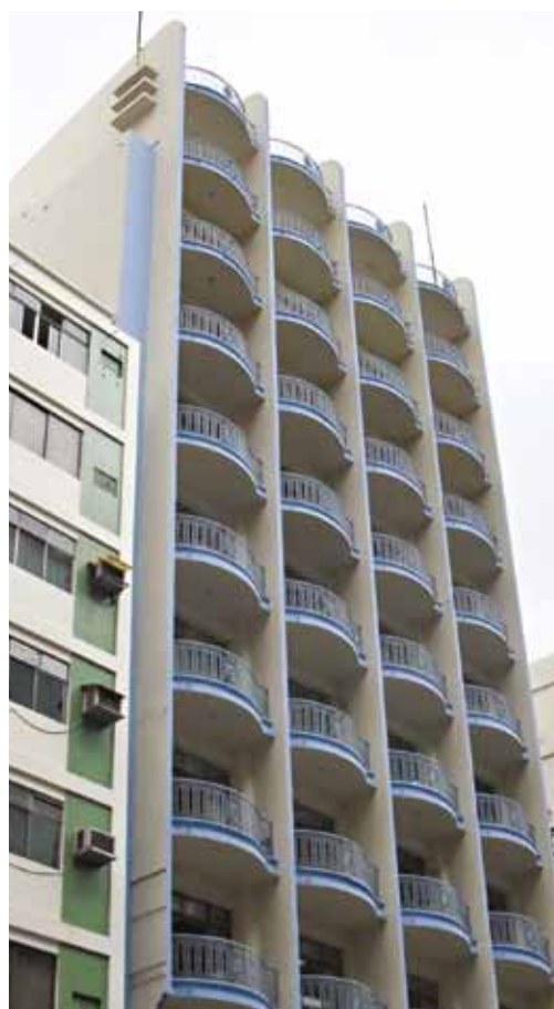
Foto: Edificio Cóndor