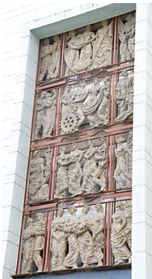
Foto: Edificio Superintendencia de Compañías