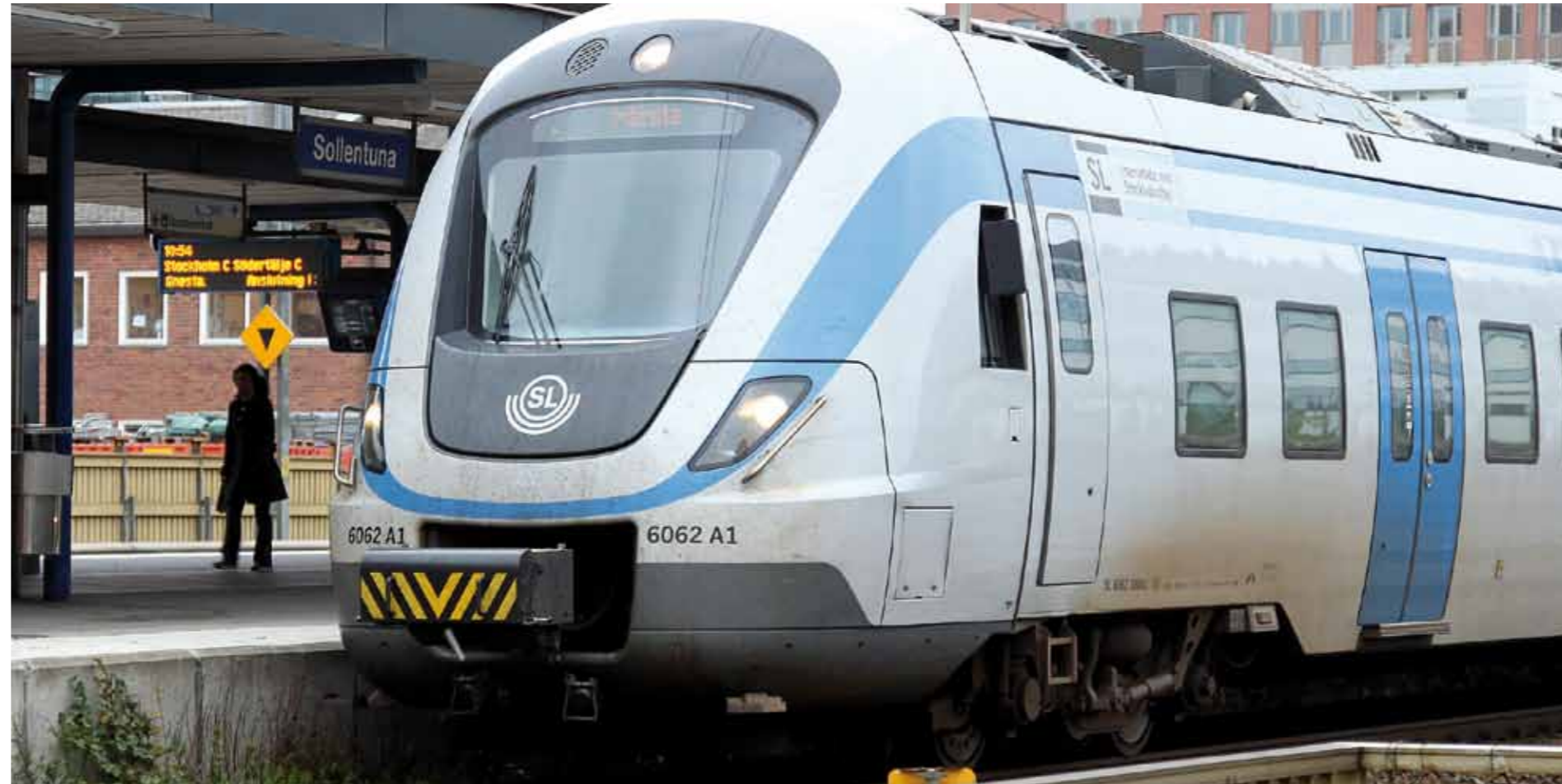
Utöver befintlig pendeltågstrafik pratar man mycket om spårvägar nu. Citybanan håller på att byggas, och en förlängning av Tvärbanan till Kista och senare till Sollentuna diskuteras.

En annan nära förestående förbättring är att pendeltågen redan 2012 kan komma att förlängas till Uppsala och då även stanna på Arlanda. Olika taxor kommer att gälla beroende på hur långt man ska, men det kommer om inte annat att bli enklare att resa kollektivt.