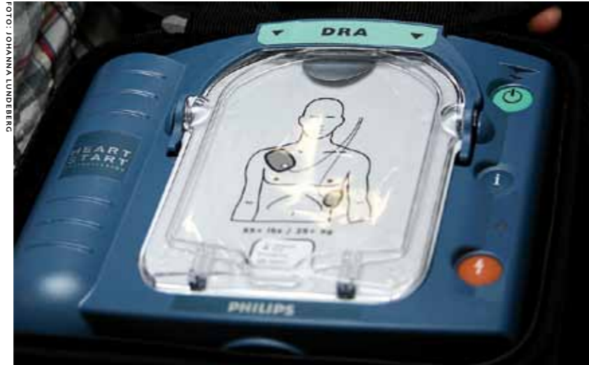
Hjärtdefibrillatorer finns nu på Sollentunavallen och Arena Satelliten.

Samtliga anställda på Sollentunavallen och Arena Satellitens hallvärdar,