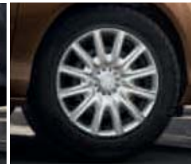
Stahlräder 6 J x 15 mit Radzierblenden „Style“ (Serienausstattung für Trend)