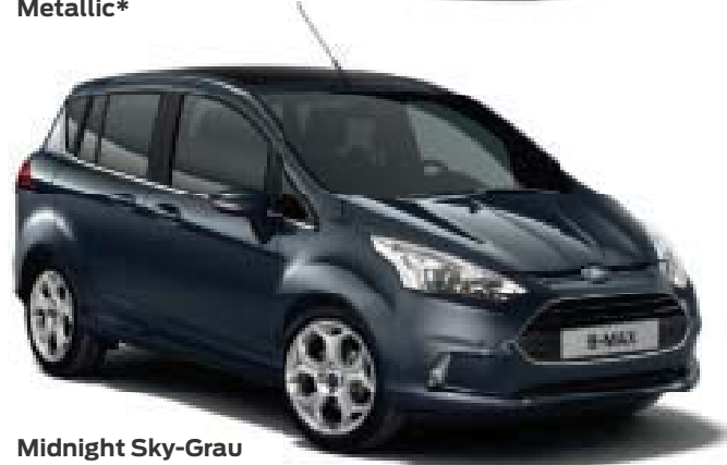
Midnight Sky-Grau Metallic*