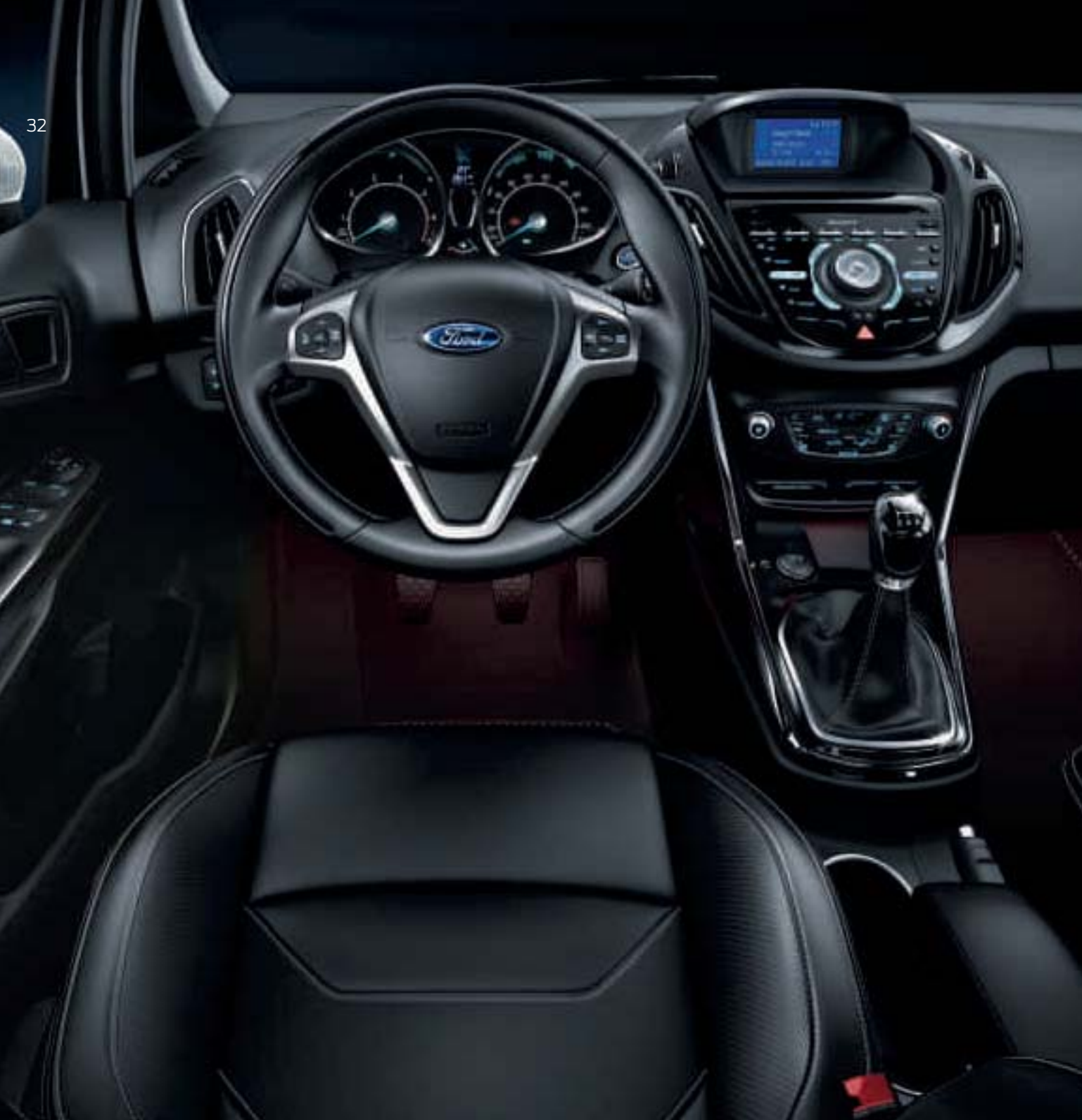
Teppichfußmatten in Luxusausführung vorn und hinten, Velours