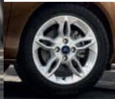
Leichtmetallräder 6 1/2 J x 16 im 5x2-Speichen-Design (Serienausstattung für Individual und Zubehör, Bestell-Nr. 179253)