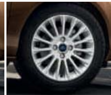
Leichtmetallräder 6 1/2 J x 16 im 15-Speichen-Design (Serienausstattung für Titanium und Zubehör, Bestell-Nr. 1791259)