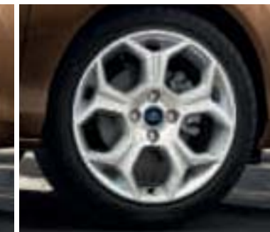
Leichtmetallräder 7 J x 17 im 5-Speichen-Design* (Wunschausstattung für Titanium und Individual und erhältlich als Zubehör, Bestell-Nr. 1791260)

Hinweis: Die für den Ford B-MAX erhältlichen 17"-Leichtmetallräder unterstützen die dynamischen und sportlichen Fahreigenschaften und sorgen für ein strafferes Fahrkomfortempfinden.