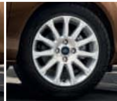
Leichtmetallräder 6 1/2 J x 16 im 11-Speichen-Design (Wunschausstattung für Trend und Zubehör, Bestell-Nr. 1791713)