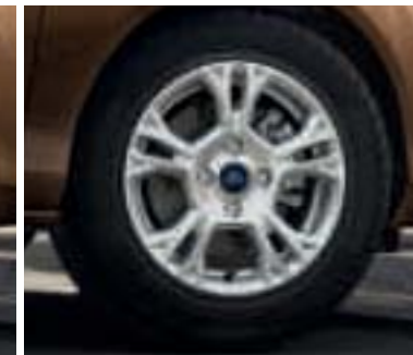
Leichtmetallräder 6 J x 15 im 5x2-Speichen-Design (Wunschausstattung für Trend und Zubehör, Bestell-Nr. 1791257)