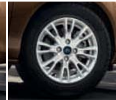
Leichtmetallräder 6 J x 15 im 8x2-Speichen-Design (Zubehör, Bestell-Nr. 1791258)