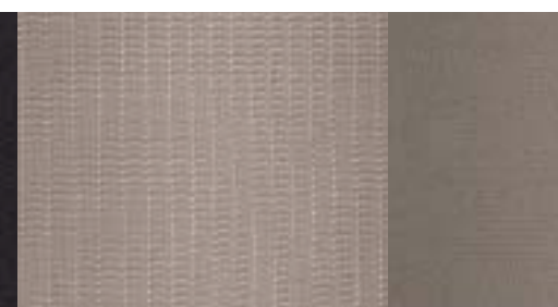
Titanium Sitzmittelbahnen und Sitzwangen in Beige