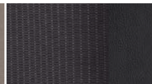
Titanium Leder-Stoff-Polsterung in Anthrazit* (Sitzwangen in Leder)