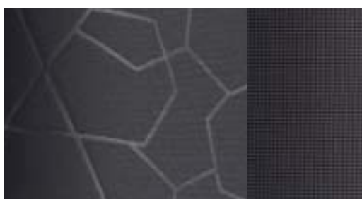
Trend Sitzmittelbahnen und Sitzwangen in Grau