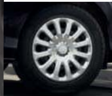
Stahlräder 6 J x 15 mit Radzierblenden (Serienausstattung für Ambiente)