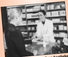
Kompetente Beratung in Ihrer Apotheke.

„Die Apotheken nehmen bis zum 15. Oktober die ausländischen Währungen entgegen. So soll sicher gestellt werden, dass auch die Restwährungen, die aus den Herbstferien mitgebracht werden, diesem guten Zweck noch zugeführt werden können“, betonte Keller. Dabei werden die Apotheken wieder von den pharmazeutischen Großhandlungen unterstützt, die das Geld in den 21.500 Apotheken einsammeln und bis zur Abholung durch UNICEF zwischenslagern. Dabei kam im letzten Jahr ein Gewicht von mehr als 20 Tonnen zustande.