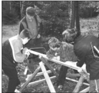
... um anschließend die Einzelteile korrekt zurechtzusagen.

drei hintereinanderstehende Fluchtstangenpaare, und an der Station 10 waren die grauen Zellen gefragt, als die Schülerinnen und Schüler sechs in einem Satz versteckte Baum- und Strauchnahmen „herausfiltern“ mußten. Brennholzspätle transportieren und sauber aufschichten, ein selbstkomponiertes Lied trällern und in einem Luponbecher echte Zecken von Insekten unterscheiden sowie Bäume und Sträucher erkennen und ein Zusatzrätsel lösen gehörten zu den weiteren Aufgaben.