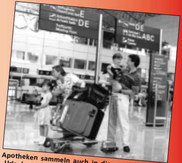
Apotheken sammeln auch in diesem Jahr wieder „Urlaubsgroschen“ für UNICEF.