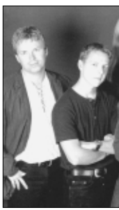
Sorgen am Samstagabend für einen musikalischen Oldie-Trip: Die Mitglieder der Gruppe Return.