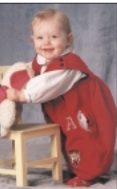
Auch in diesem Jahr suchen HK-Leser den „süßesten Fratz“.