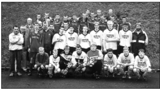
Mit Spaß bei der Sache: Die B-Jugendfußballer des MTV Soltau und die Kicker aus Zielona Gora.