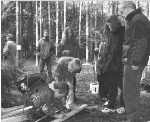
An der Station „Jagdstand bauen“ mußten die Schülerinnen und Schüler zunächst genau messen ...