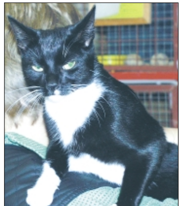
Im Soltauer Damaschkeweg wurde diese schwarzweiße, tragende Kätz gefunden. Sie ist zutraulich und sehr ruhig. Ins Soltauer Tierheim Tiegen wurde sie am 14. September gebracht, wo sie jetzt auf ihren Besitzer wartet.