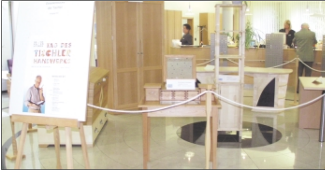
Bei einer Ausstellung von Tischler-Gesellenstücken in der Soltauer Volksbank machten die beteiligten Firmen bereits per Plakat auf den „Tag des Tischlerhandwerks“ aufmerksam.

LANDKREIS. Seit einigen Jahren öffnen engagierte Betriebe des Tischlerhandwerks ihre Porten, um der Bevölkerung am „Tag des Tischlerhandwerks“ einen umfassenden Einblick in ihre Arbeit zu geben. Auch in diesem Jahr wollen zwölf Tischlerwerkstätten aus dem Bereich der Kreishandwerkerschaft Soltau-Fallingb. am 22. und 23. September in der Zeit von 11 bis 17 Uhr ihre interessante Tätigkeit vorstellen.