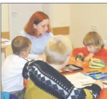
Nach wie vor bietet der Kinderschutzbund in Soltau zweimal pro Woche Hausaufgabenhilfe an. Ein Angebot, das regen Zuspruch findet: An kleinen „Klienten“ jedenfalls mangelt es nicht.