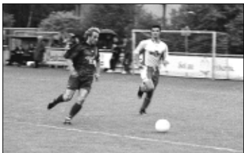
Fußball-Landesligist MTV Soltau mußte am vergangenen Wochenende eine bittere 1:4-Heimniederlage gegen TSV Neukirchen hinnehmen. Der TSV Neukirchen hingegen bezwang den TV Meckelfeld auswärts mit 3:1. In der Bezirksklasse gewann der TV Jan Schneverdingen gegen den TSV Wietze mit 4:2. Der in dieser Klasse bis dato ungeschlagene TSV Neukirchen II kassierte beim Kreisrivalen SV Schwarmstedt eine deftige 0:5-Packung.