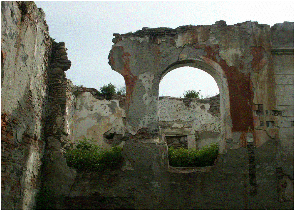
Curtea Cândeștilor, com. Râu de Mori, jud. Hunedoara (2003)