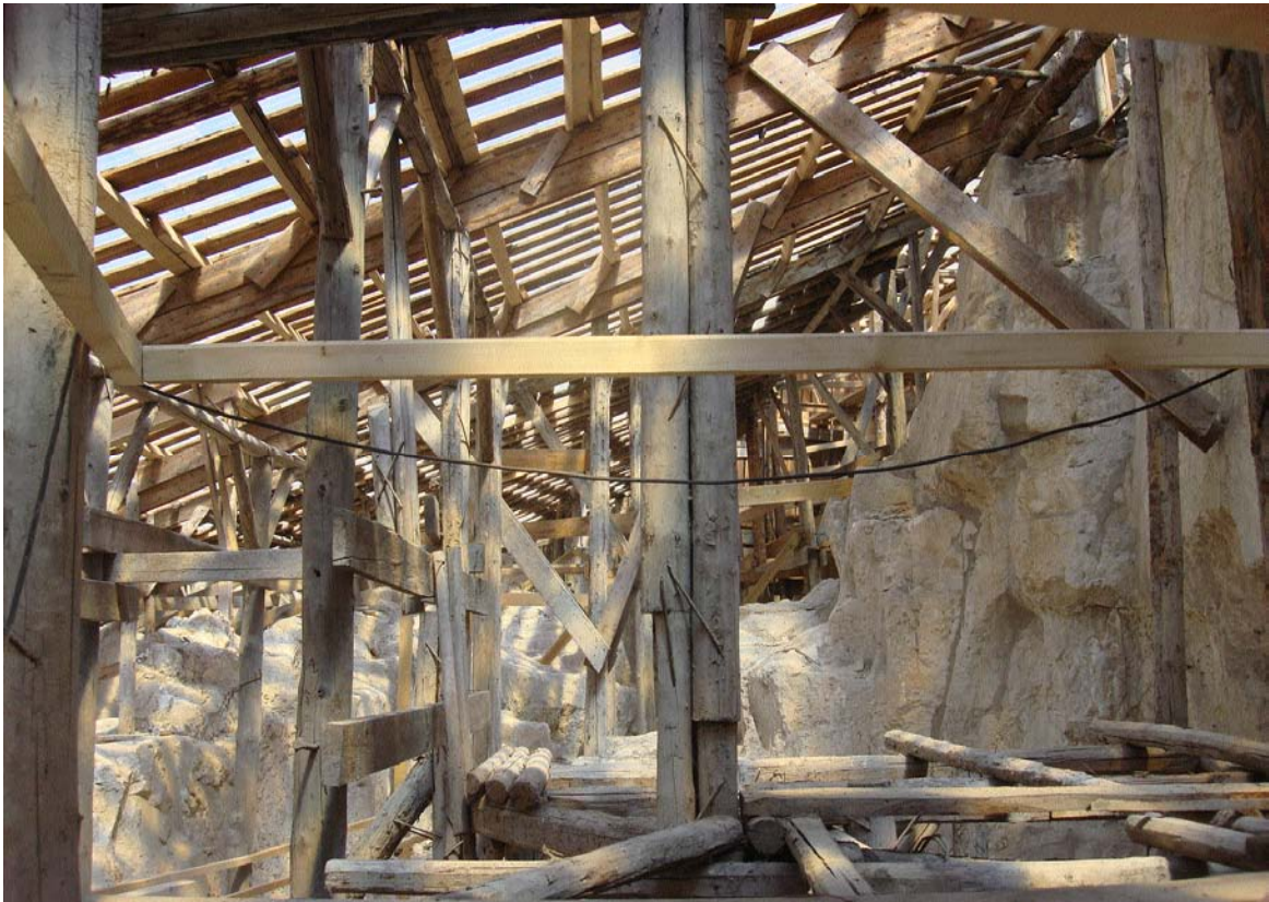
Monumentul rupestru de la Basarabi, acoperire de protecție improvizată, interior