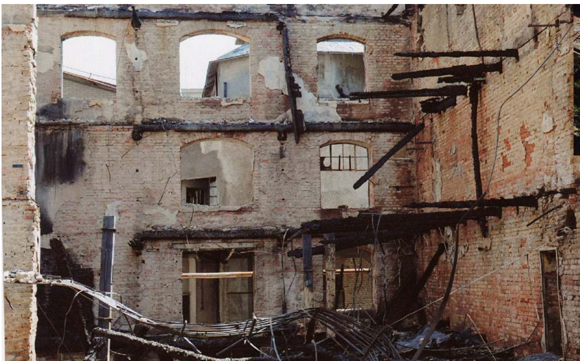
Moara lui Assan, str. Silozului nr. 25, sector 2 (16 mai 2008)