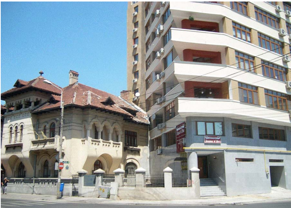
Intersecția Str. Maria Rosetti cu Str. Toamnei, sector 2, București (iulie 2008)