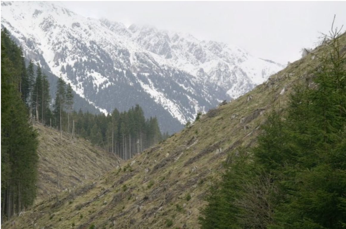
Despăduriri în Parcul Național Piatra Craiului

Despăduririle din Piatra Craiului au fost făcute mai ales după ce acest masiv a fost declarat parc național, din 2000 și până în prezent, de către Regia Națională a Pădurilor - Argeș și de către primăria Zărnești, Brașov.