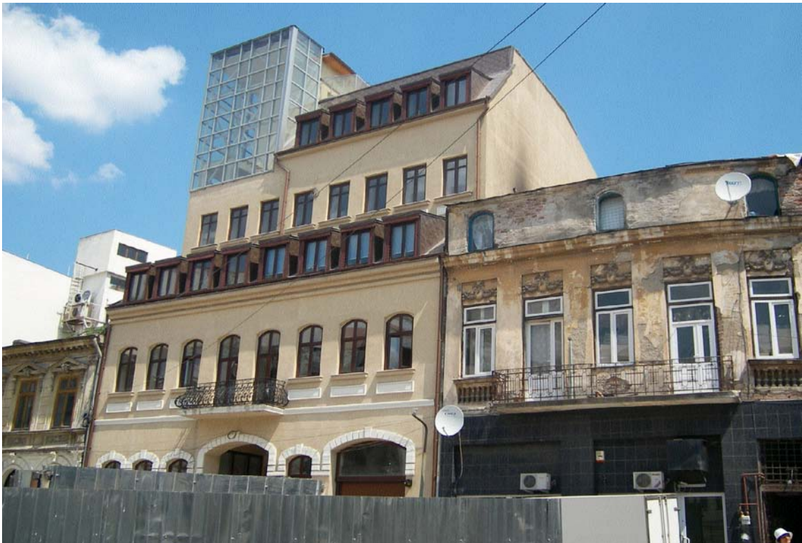
Imobilul din str. Bărăției nr. 35, sector 3, București (iulie 2008)