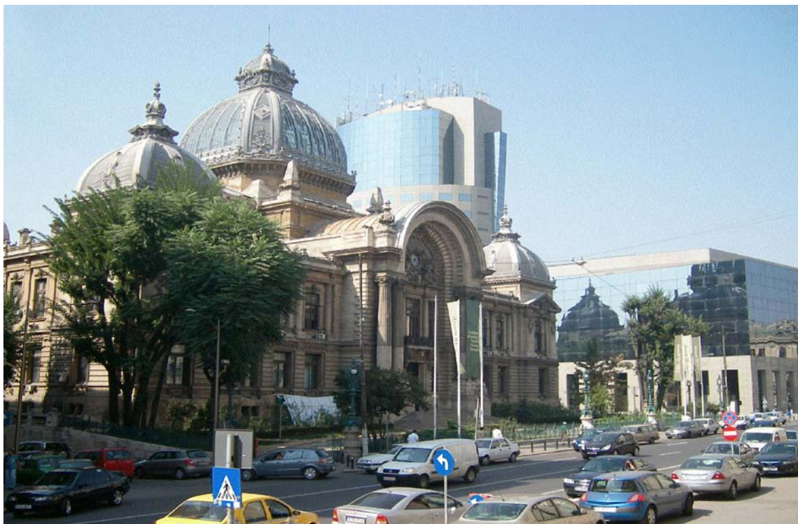
Palatul CEC și Bucharest Financial Plaza, Calea Victoriei, București

„Cathedral Plaza” este un imobil cu parter și 19 etaje, având o înălțime maximă de 75 metri. Atât avizele pentru documentația de urbanism și pentru proiectul tehnic, cât și autorizația de construcție au fost emise în condiții neclare din punct de vedere procedural, într-o perioadă cuprinsă între 1999 și 2006. Justiția urmează să se pronunțe asupra legalității construcției, lucrările fiind pentru moment oprite.