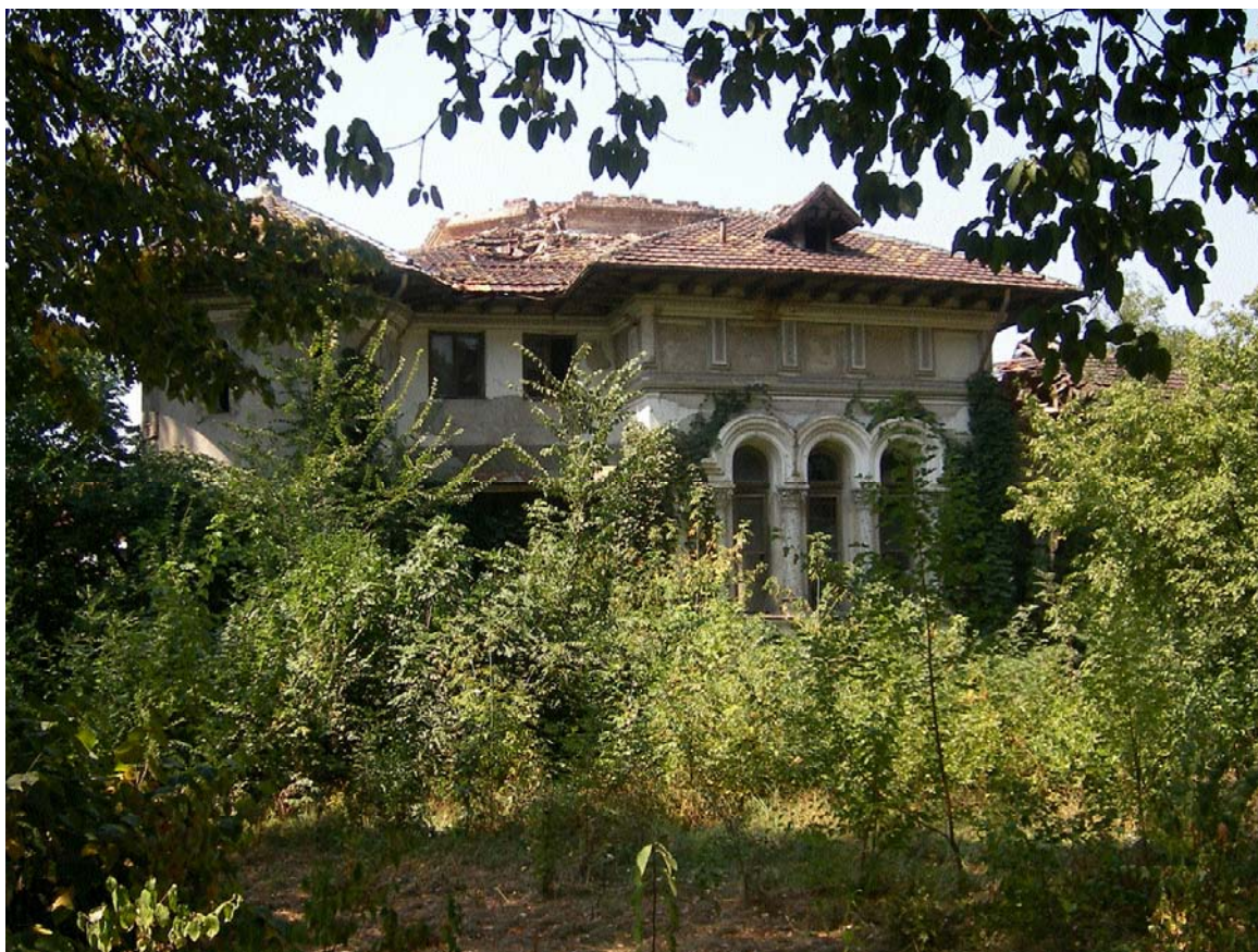
Casa Mirea - Miclescu din Șos. Kiseleff nr. 37, sector 1, București (august 2008)

Ministerul Culturii și Cultelor a solicitat Consiliului General al Municipiului București, în repetate rânduri, declanșarea procedurii de expropriere pentru cauză de utilitate publică, fără să obțină însă nici un rezultat.