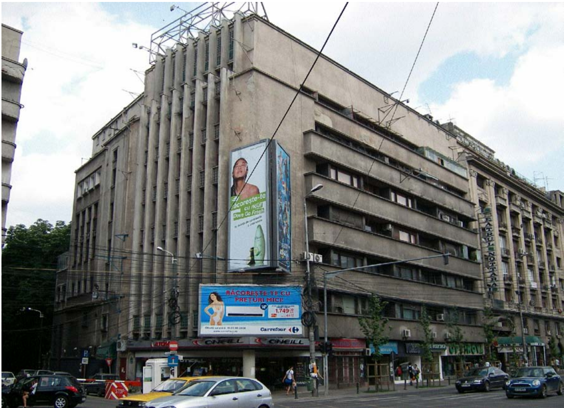
Casa Magistraților (arh. Duiliu Marcu), sector 1, București (iulie 2008)