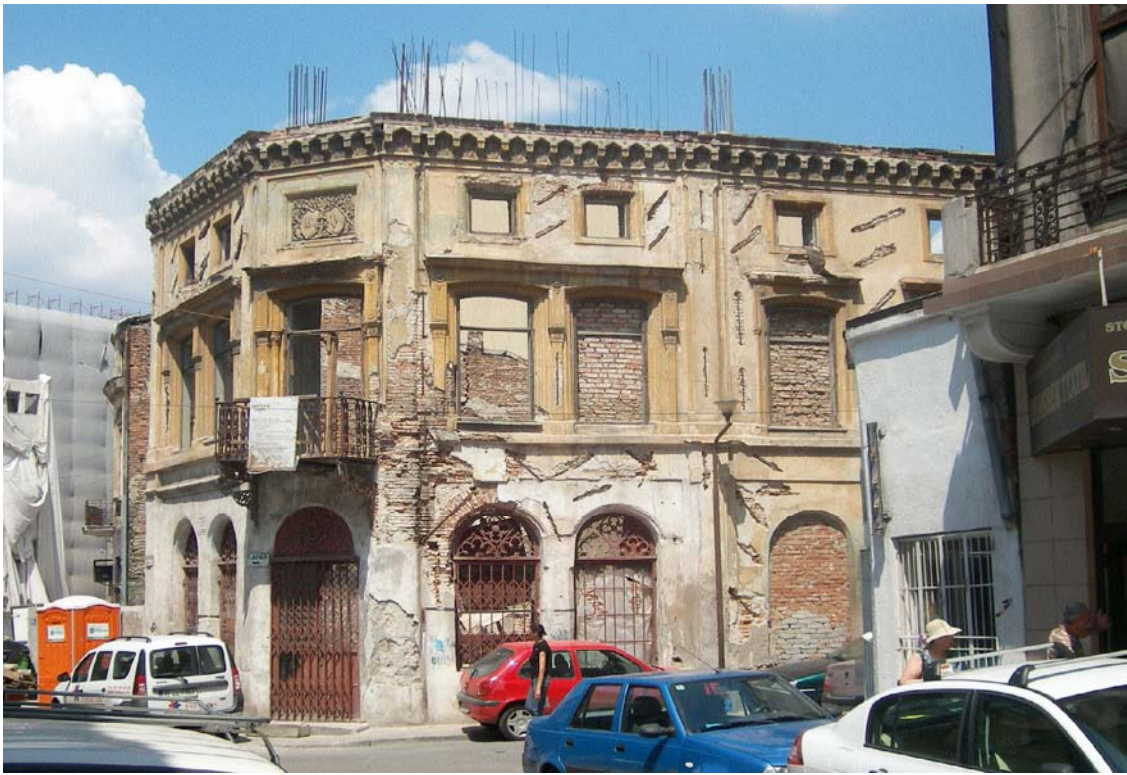
Imobilul din str. Baia de Fier nr. 3, sector 3, București (iulie 2008)