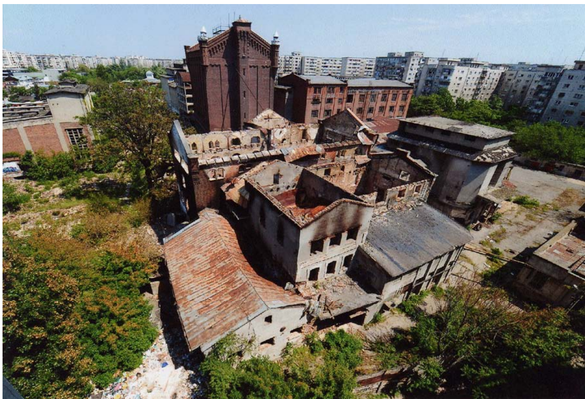
Moara lui Assan, str. Silozului nr. 25, sector 2, București (16 mai 2008)

Dacă cele două recente incendii (mai și iunie 2008), care au distrus o parte importantă a clădirilor, au fost provocate, rămâne a fi stabilit prin ancheta care se află în desfășurare. Până atunci, lipsa de preocupare pentru întreținerea și punerea în valoare a monumentului, distrugerile intenționate, flagranta ineficiență a procedurilor administrative de control, ar trebui ferm sancționate.