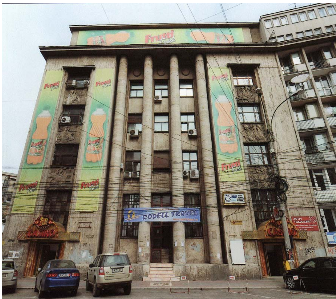
Imobilul „CUGIR” (arh. C. Mosinschi, ing. E. Prager) din str. G. Enescu nr. 27, sector 1, București (iulie 2008)

Acesta este un tratament barbar, care nu numai că ascunde și urățește fațadele clădirilor, dar le și degradează, distrugând prin elementele metalice de prindere finisajele exterioare, de multe ori de o calitate greu de egalat astăzi.