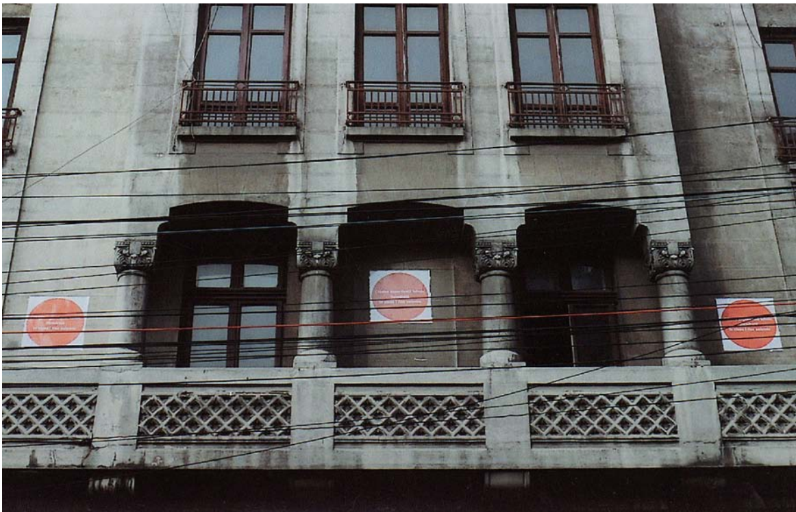
Pasajul Victoria și Hotel Muntenia, str. Academiei nr. 17-19, sector 1, București