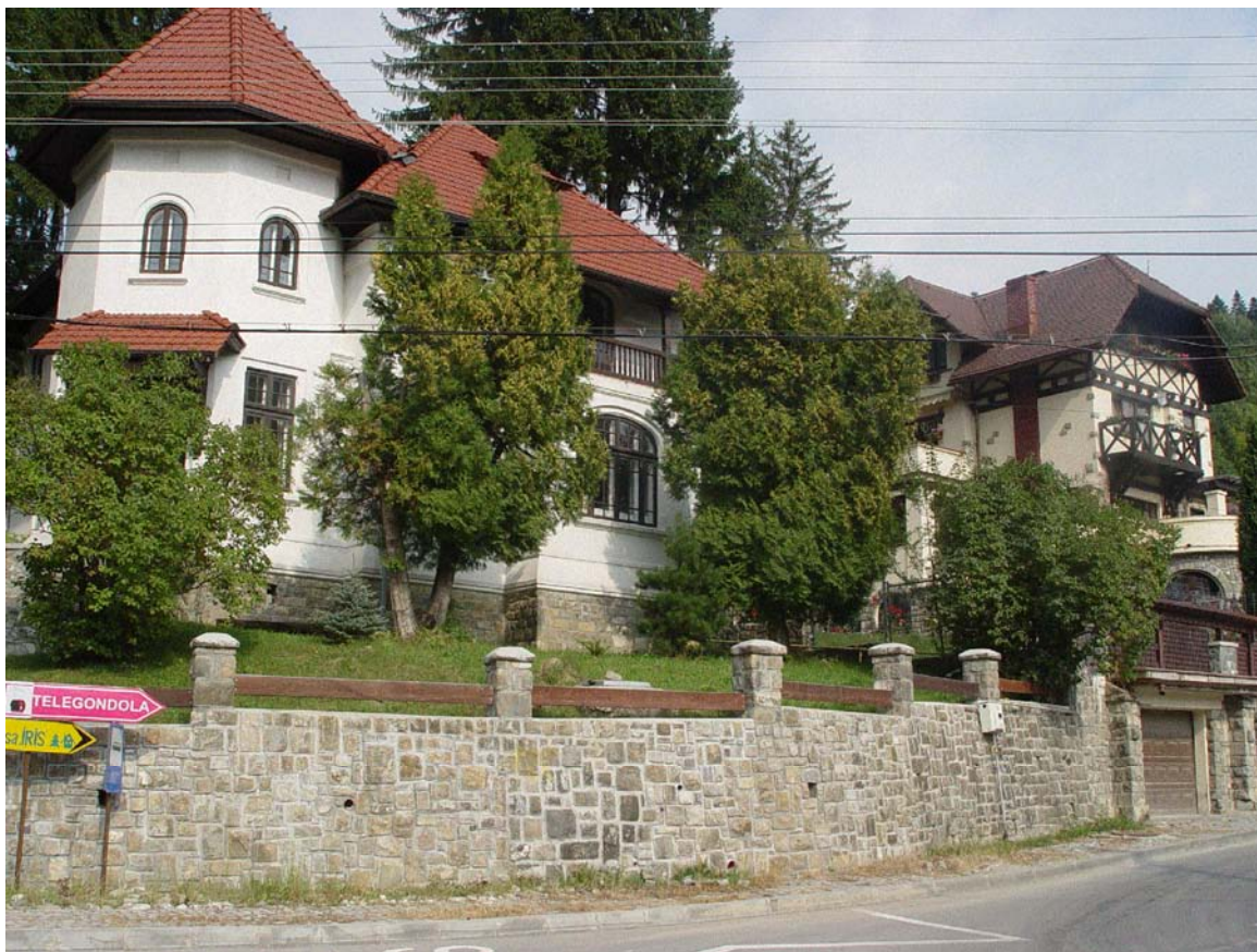
Ambient arhitectural și peisaj specific, Sinaia (august 2008)

Devenită cu timpul al doilea centru politic important în România, Sinaia a găzduit multe luni pe an întruniri ale Guvernului și consultări de anvergură. Marile familii aristocratice din România (Cantacuzino, Stirbey, Sturdza), precum și cei mai importanți politicieni ai vremii (Brătianu, Costinescu, Argetoianu, Tache Ionescu) au ținut să aibă aici reședințe secundare, apelând la cei mai mari arhitecți ai începutului de secol al XX-lea: Ion Mincu, Petre Antonescu, Paul Smărăndescu, Duiliu Marcu.