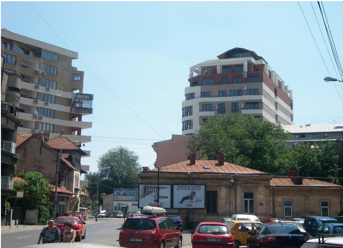
Intersecția Str. Maria Rosetti cu Str. Toamnei, sector 2, București (iulie 2008)