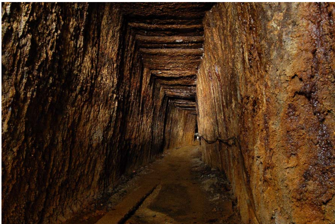
Galerie romană, com. Roșia Montană, jud. Alba

„vestitei mine de la Roșia” fiind imortali-zată în gravuri de epocă. Se păstrează elementele exploatării miniere moderne, preindustriale și industriale, cu rețele trasate regulat, lacuri de acumulare, canale de dirijare a apei etc, precum și vestigiile arheologice de suprafață care însumează vaste necropole, monumente funerare de excepție, edificii sacre, edificii publice cu hypocaust etc.