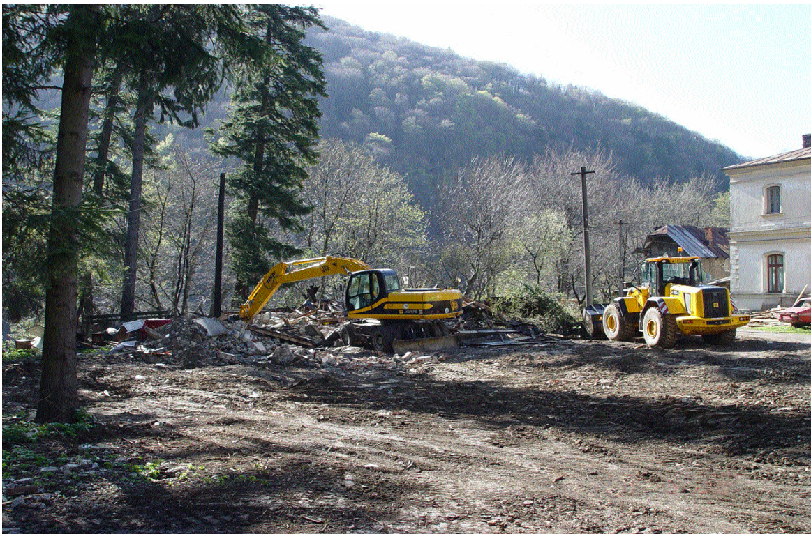
Același amplasament, după demolare (aprilie 2008)