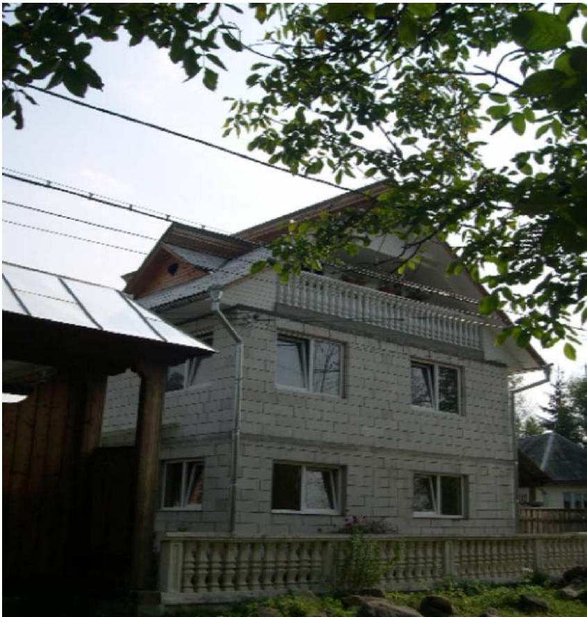
Locuință nouă maramureșeană