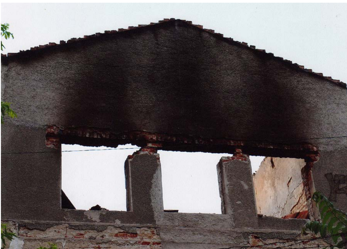
Moara lui Assan, str. Silozului nr. 25, sector 2 (16 mai 2008)