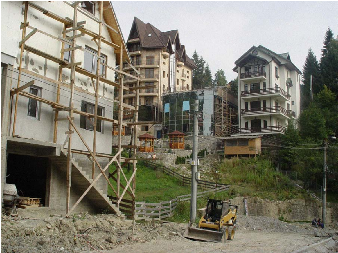
Arhitectura nouă din Sinaia (2008)