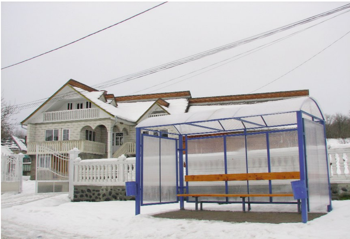
Locuință nouă maramureșeană