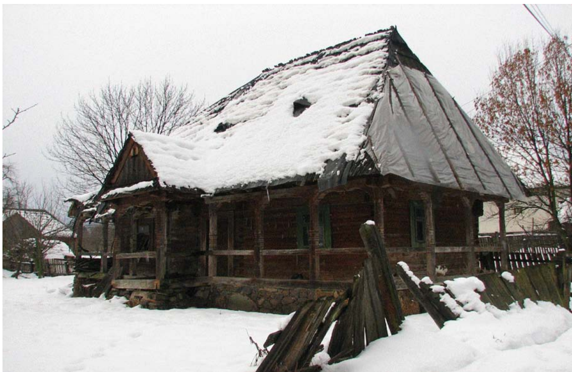
Locuința tradițională maramureșeană abandonată

Această nouă arhitectură, expresia perfectă a kitsch-ului, demonstrează, pe de o parte, existența unor importante resurse materiale, dar și, pe de altă parte, lipsa oricărei preocupări a comunității sau a autorităților locale pentru păstrarea valorilor tradiționale.