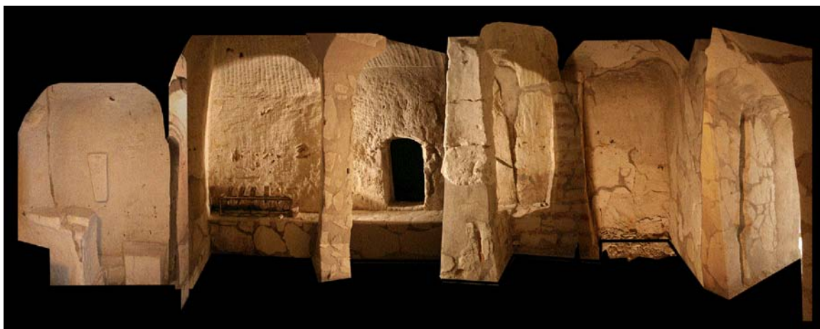
Monumentul rupestru de la Basarabi, jud. Constanța, interior

Autoritățile locale au amenajat în imediata vecinătate a ansamblului o groapă de gunoi de mari dimensiuni, către care utilaje de tonaj greu transportă zilnic deșeuri și resturi menajere, provocând vibrații și alterând grav cadrul ambient al monumentului.