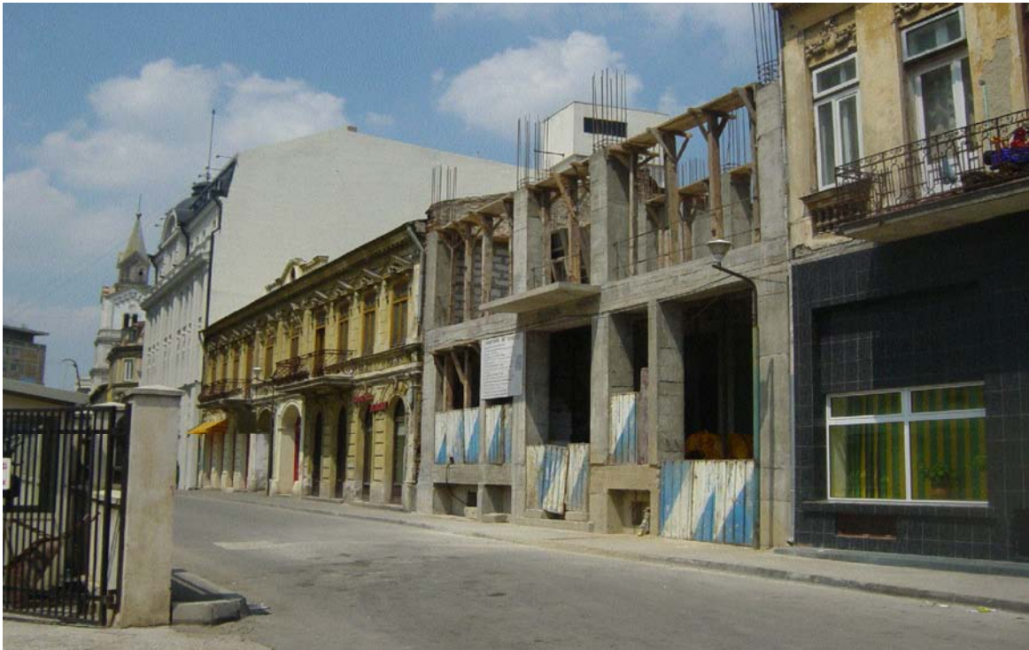
Imobilul din str. Bărăției nr. 35, sector 3, București (martie 2004)