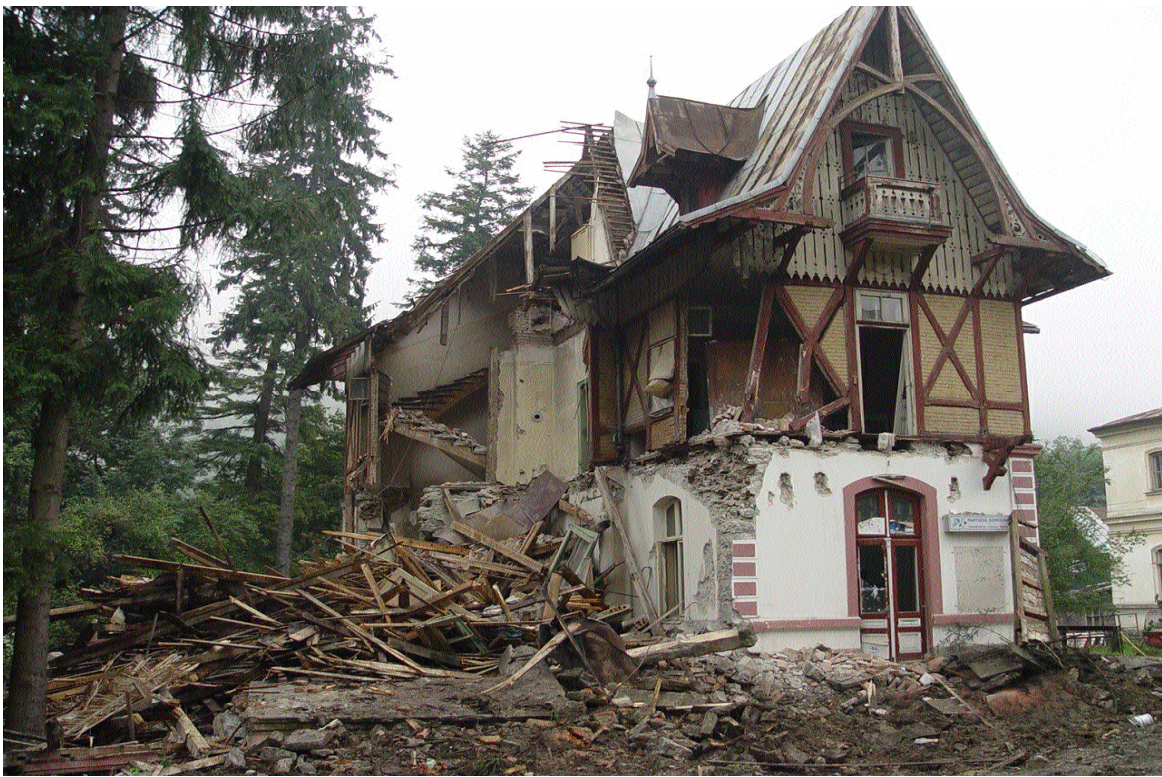
Demolarea unui imobil în zona istorică, Sinaia (septembrie 2007, foto: arh. Dan Manea)