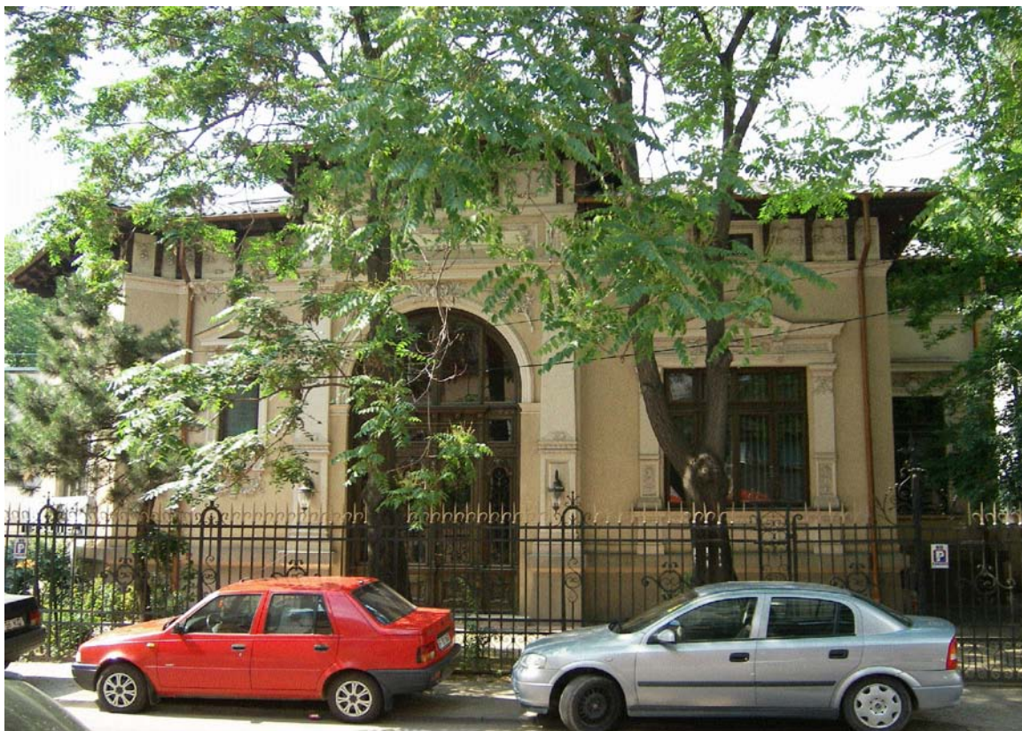
Casa Filitis-Golescu, str. M. Eminescu nr. 27, sector 1, București (iulie 2008)

Imobilele din București situate pe str. M. Eminescu nr. 27 (casa Filitis-Golescu) și Calea Dorobanți nr. 16 (casa Dinu Brătianu) constituie un astfel de caz. Filiala București a Ordinului Arhitecților și Comisia Zonală a Monumentelor Istorice București au solicitat clasarea lor de urgență dar, în lipsa fotografiilor de interior și a expertizei tehnice, procedura legală nu mai poate fi îndeplinită.