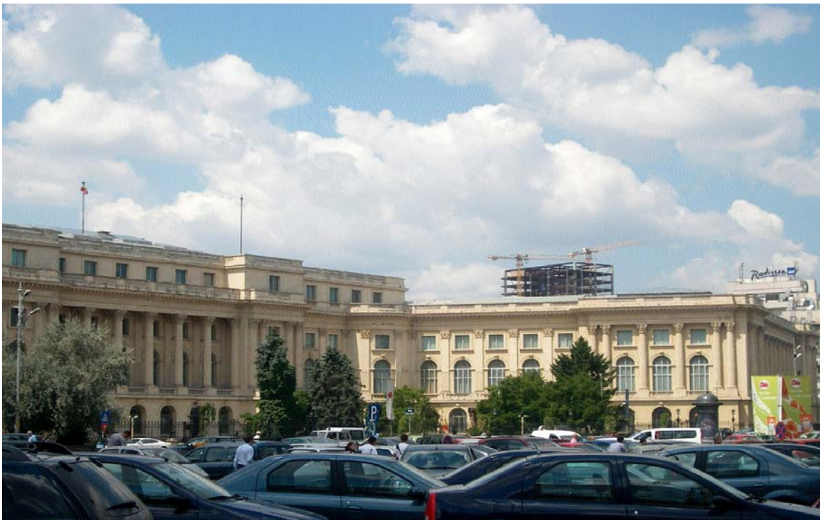
Muzeul Național de Artă al României și Cathedral Plaza, București