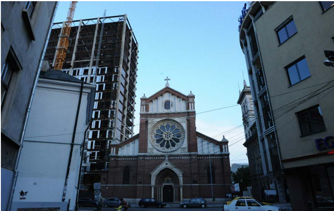
Catedrala romano-catolică „Sf. Iosif” și Cathedral Plaza, București