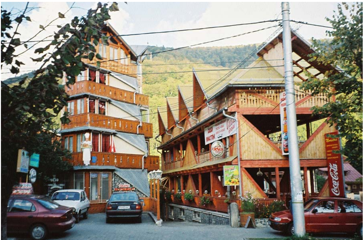
Arhitectura nouă din Sinaia (2008)