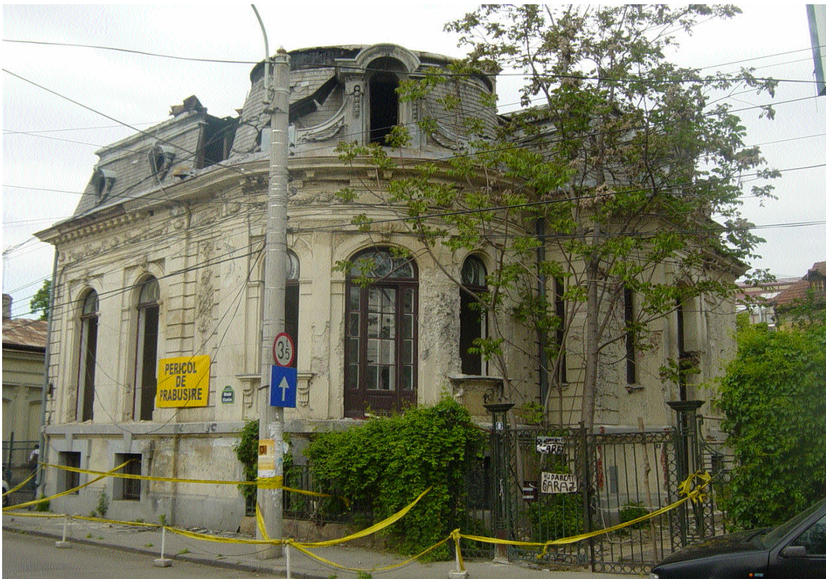
Imobilul din str. Visarion nr. 8, sector 1, Bucuresti (mai 2007)