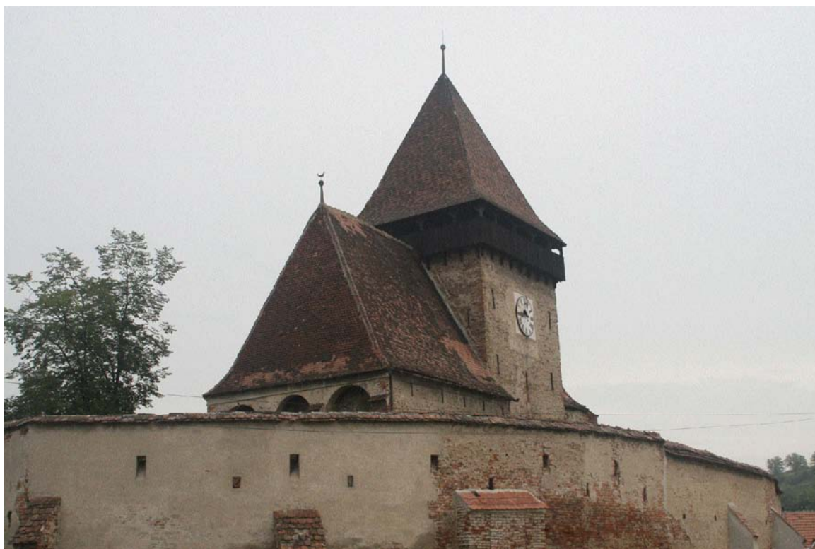
Biserica fortificată din com. Axente Sever, jud. Sibiu

Numeroase reședințe nobiliare – castele, palate, conace – sau lăcașuri de cult de pe întreg cuprinsul României se află în aceeași situație.