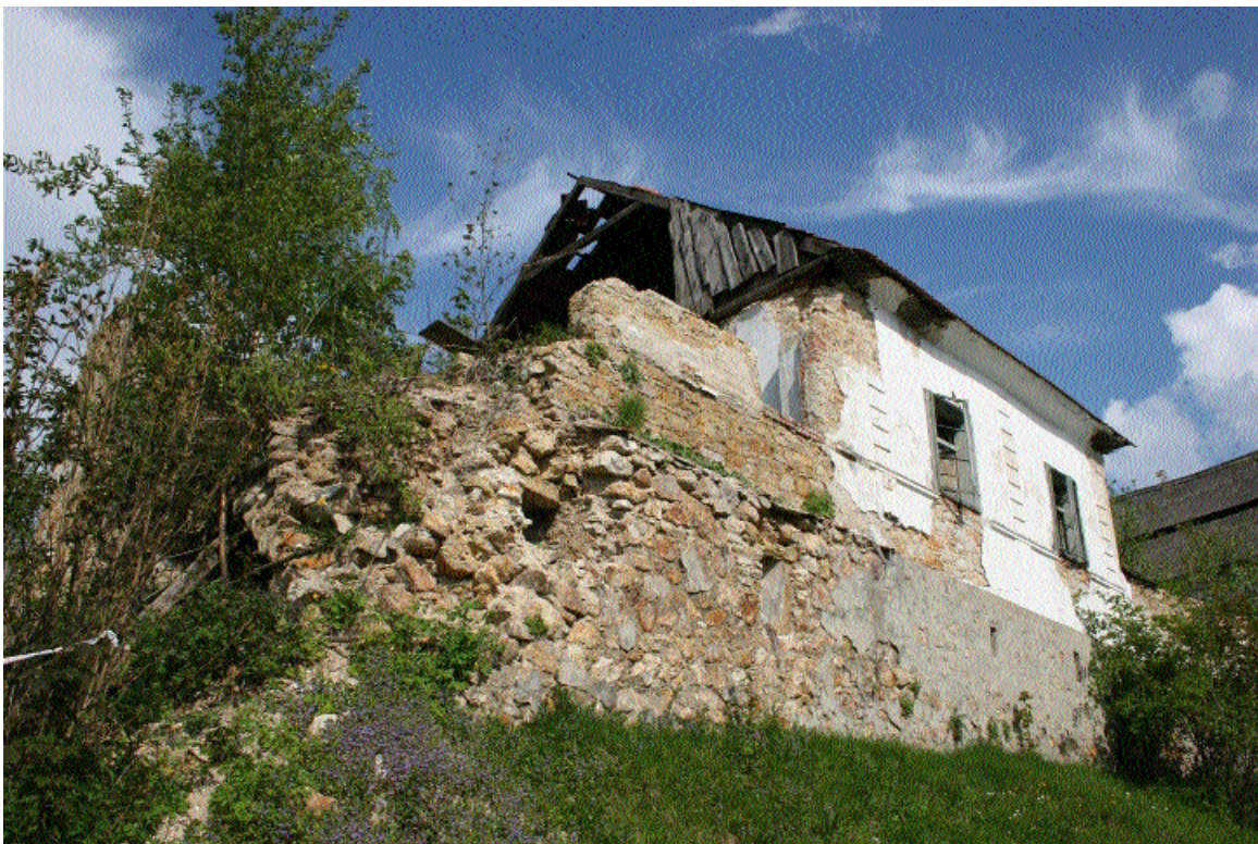
Imobil clasat din centrul monument istoric (casa nr. 449), Roșia Montană, jud. Alba

Un caz special îl reprezintă abandonarea și distrugerea intenționată a imobilelor din Roșia Montană, unde, în ultimii ani, au dispărut peste 100 case, exemple de arhitectură rurală de certă valoare.