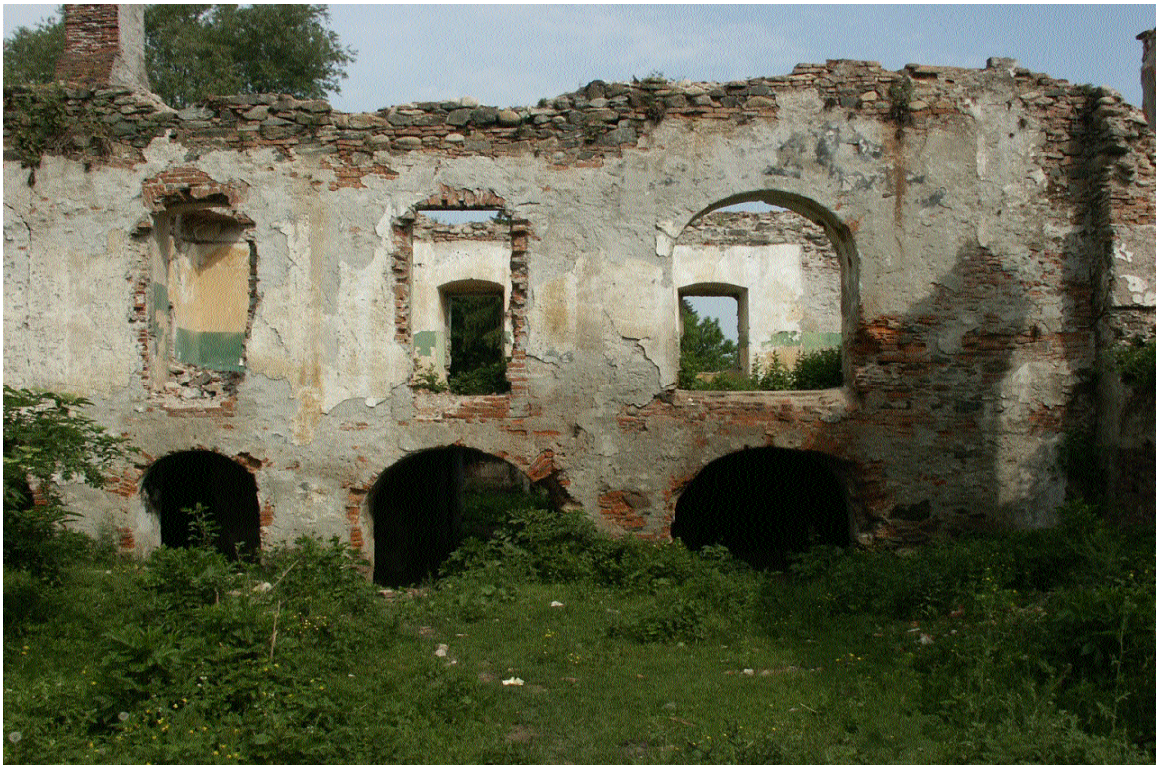
Curtea Cândeștilor, com. Râu de Mori, jud. Hunedoara (2003)