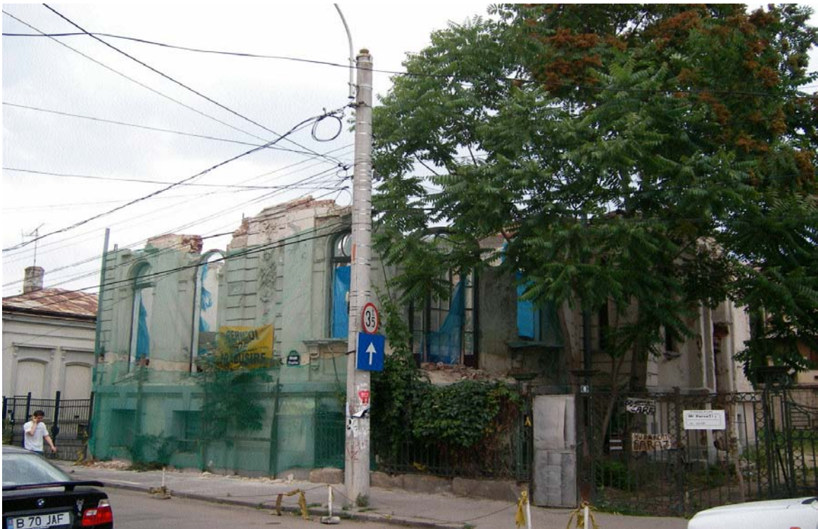
Imobilul din str. Visarion nr. 8, sector 1, București (iulie 2008)