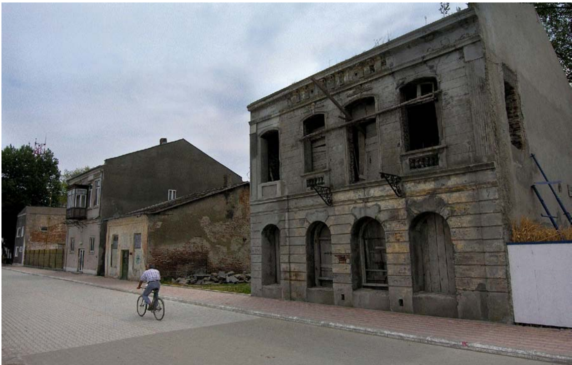
Clădire monument istoric abandonată, Sulina, jud. Tulcea