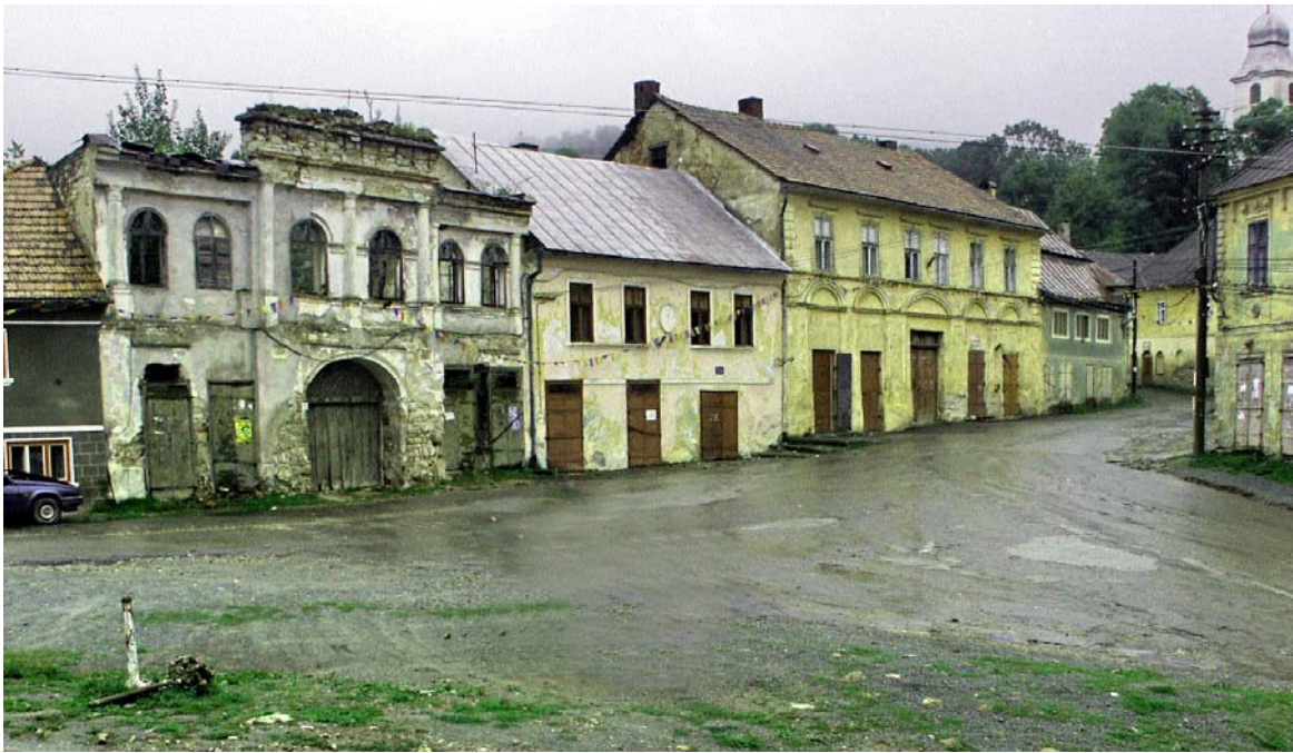
Frontul de nord al centrului monument istoric, Roșia Montană, jud. Alba