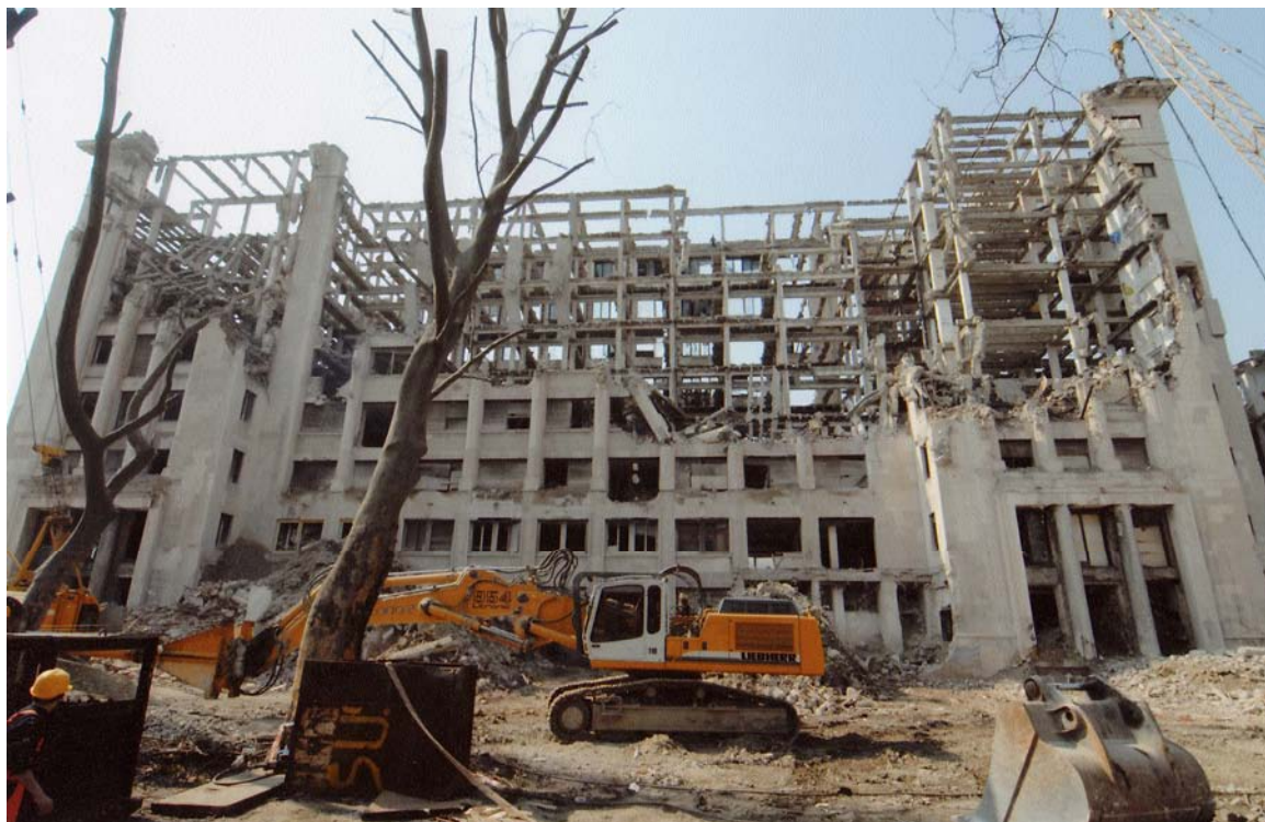
Sediul fostului Minister al Industriei Constructoare de Mașini, Calea Victoriei nr. 133-135, sector 1, București (demolat 2008)

Simbolul „clădire expertizată tehnic încadrată în clasa 1 de risc seismic” a devenit unul dintre cele mai „solide” argumente pentru demolarea clădirilor în centrul capitalei și în zonele protejate, anulându-se astfel sensul originar: prioritate de consolidare seismică și de punere în siguranță. Folosirea abuzivă a simbolului „risc seismic clasa 1” în cazul clădirilor vechi ar putea lichida în câțiva ani fondul istoric de clădiri vechi și frumoase ale capitalei.