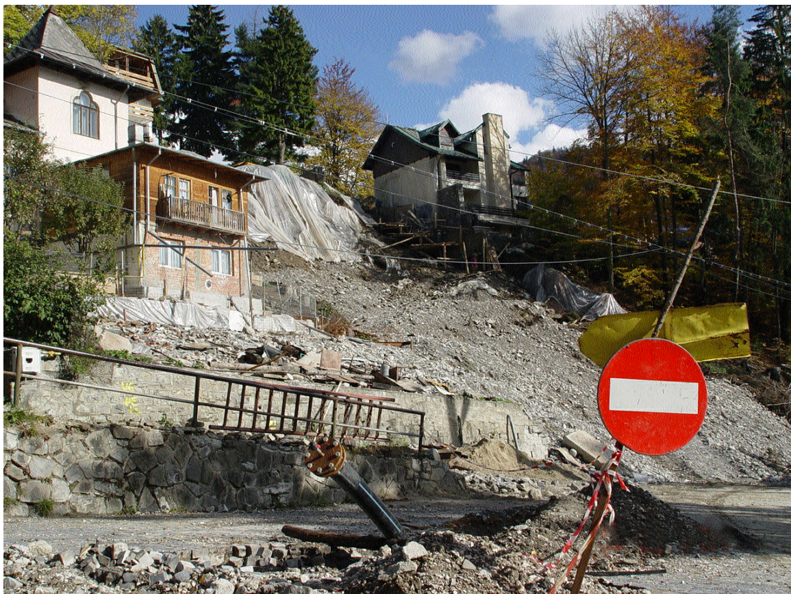
Devastarea reliefului și imaginii urbane prin implantări contemporane, Sinaia (octombrie 2008)

Același lucru se poate spune și în legătură cu tăierea iresponsabilă a arborilor, cu defrișările masive și sălbătice, cu realizarea de săpături pentru noi fundații în versanți, fără să se țină seama de datele geologice ale terenului, totul în vederea îndeșirii construcțiilor. Acestea se ridică pe taluzuri, pe terenuri în pantă mare, despădurindu-se suprafețe enorme în câteva ore.