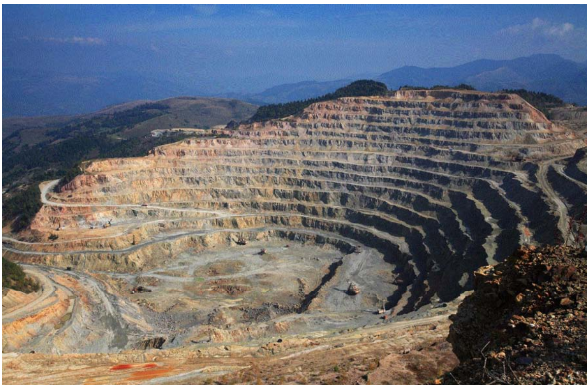
Exploatare minieră de suprafață, com. Roșia Montană, jud. Alba

Un caz special îl reprezintă abandonarea și distrugerea intenționată a imobilelor din Roșia Montană, unde, în ultimii ani, au dispărut peste 100 case, exemple de arhitectură rurală de certă valoare.