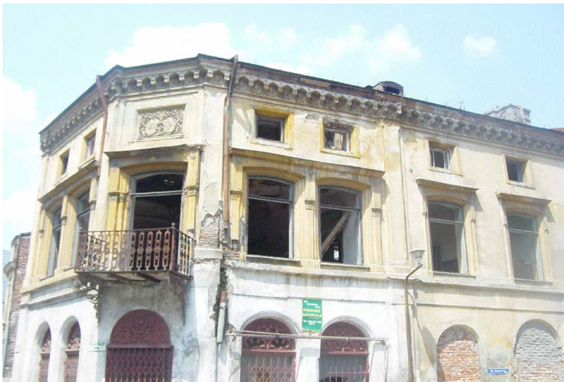
Imobilul din str. Baia de Fier nr. 3, sector 3, București ( martie 2004)

Vederea din spate, cu terenul liber de construcții, indică însă clar intenția realizării unei construcții noi, parazitând ceea ce a rămas din vechiul imobil și având aceeași calitate arhitecturală ca și cea a intervenției de pe str. Bărăției 35.