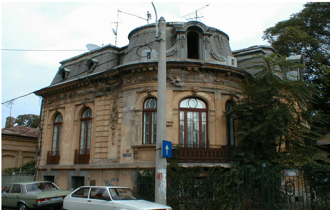
Imobilul din str. Visarion nr. 8, sector 1, București (octombrie 2001)

În aceste condiții, devastarea imobilului continuă fără ca autoritățile să intervină pentru salvarea sa.