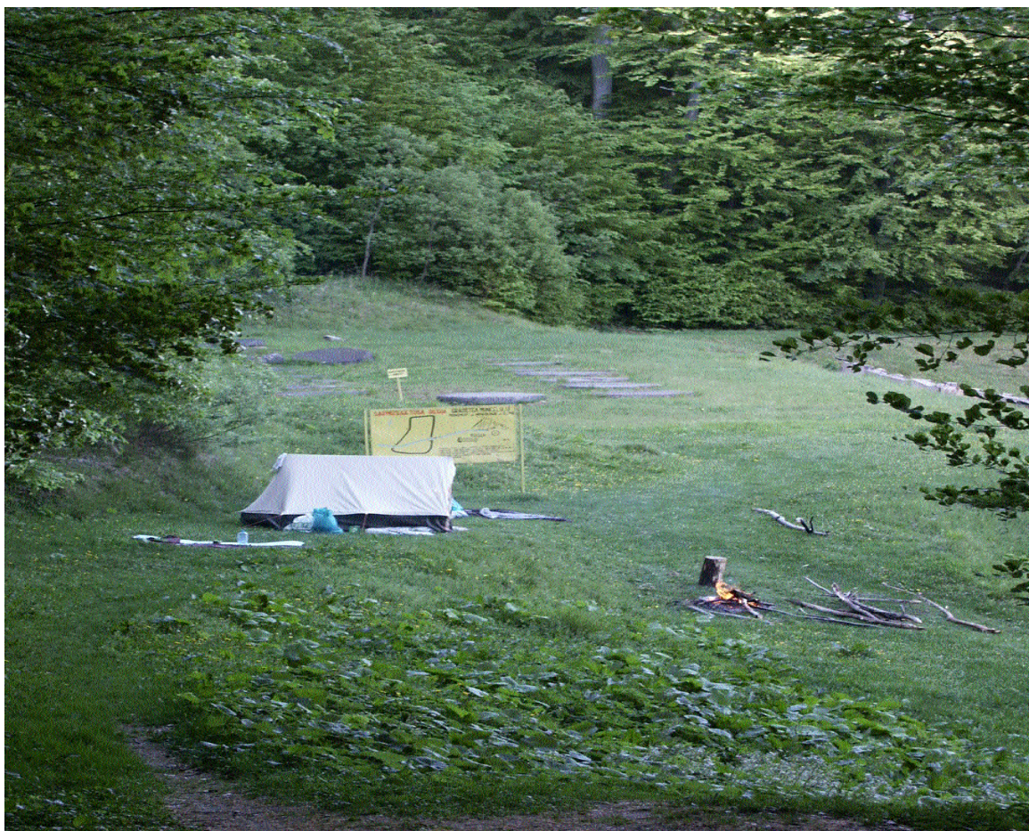
Turism în perimetrul sitului arheologic Sarmisegetusa Regia, jud. Hunedoara

Neconcordanțele dintre mecanismele de protecție aferente celor două tipuri diferite de patrimoniu – natural și arheologic – fac ca pentru acesta din urmă să nu poată fi efectuate nici măcar operațiunile de protecție, fără a mai vorbi de toate operațiunile de cercetare, conservare și restaurare necesare.