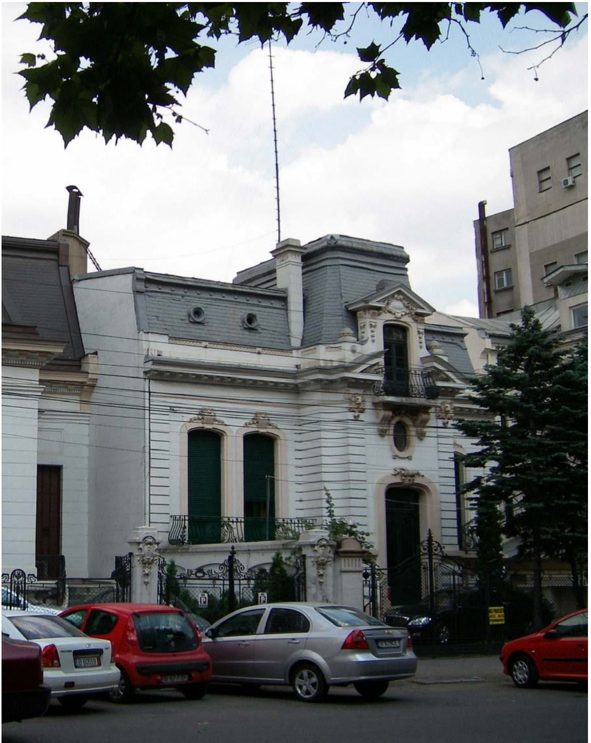
Casa Dinu Brătianu, Calea Dorobanți nr. 16, sector 1, București (iulie 2008)