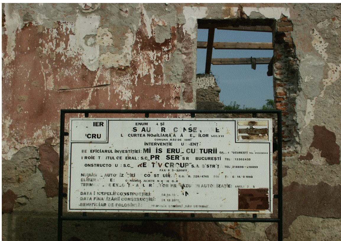
Curtea Cândeștilor, com. Râu de Mori, jud. Hunedoara (2003)

Notăm că această curte nobiliară se află în apropierea bisericii cneziale a Cândeștilor (a cărei pictură, una din cele mai vechi atestate în Transilvania, a fost distrusă odată cu restaurarea bisericii) și a castelului „Colț”, lăsat și el pradă distrugerii.