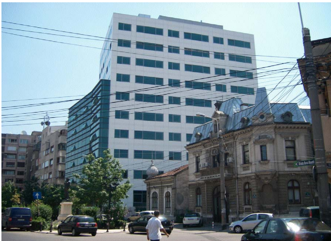
Str. Maria Rosetti nr. 6, sector 2, București (iulie 2008)

Două exemple de pe strada Maria Rosetti sunt relevante pentru acest tip brutal de intervenție. La nr. 6, un valoros imobil neoromânesc a fost demolat și înlocuit cu un masiv imobil de birouri P+9E, care distorsionează complet scara locului. Nu departe, la intersecția cu strada Toamnei, au fost construite două imobile P+8E, care încalcă orice regulă de urbanism și de bună vecinătate.