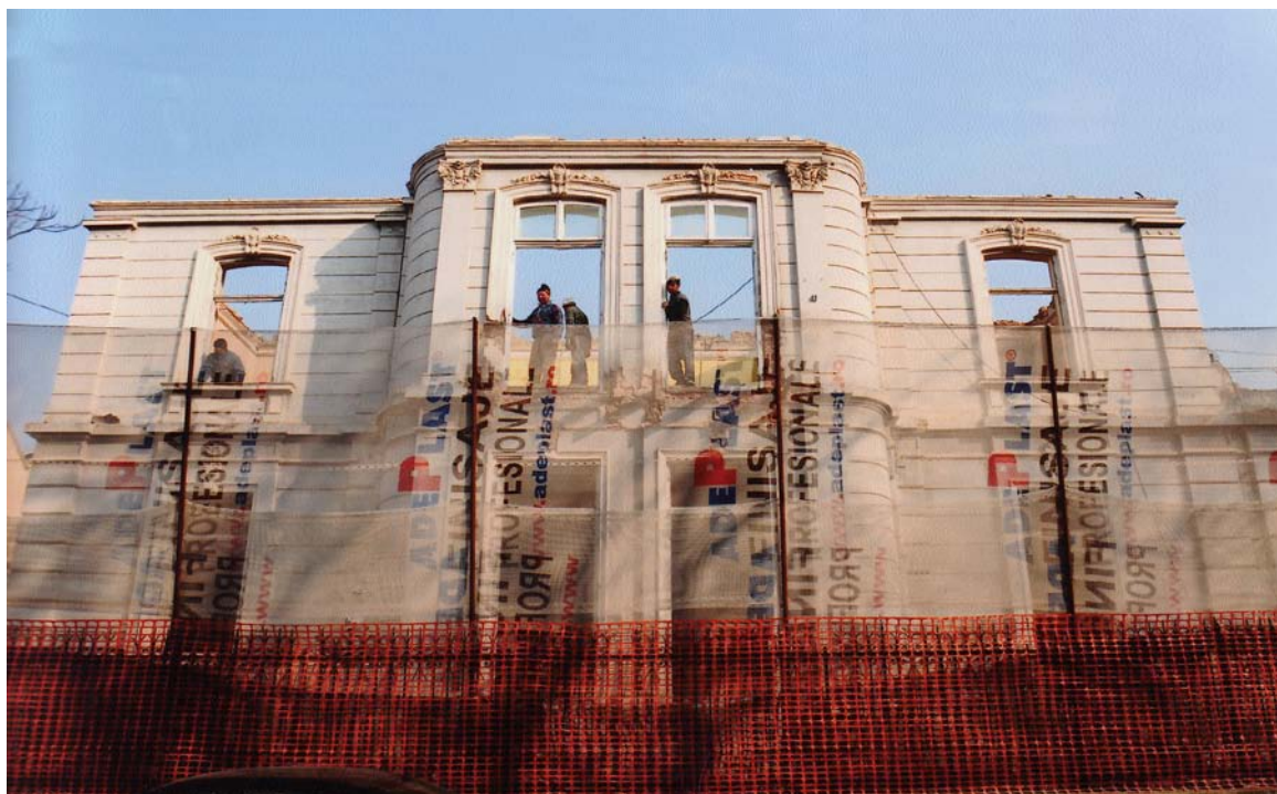
Imobilul de pe str. G. Clemenceau nr.8-10, sector 1, București, în curs de demolare (primăvara anului 2008)

Deși este situat într-o zonă protejată, în imediata vecinătate a Atheneului Român, și deși nu existau rațiuni arhitecturale - și în mare măsură nici urbanistice - pentru a justifica demolarea sa, imobilul de la nr. 8 - 10 a dispărut în baza unei autorizații de desființare legale.