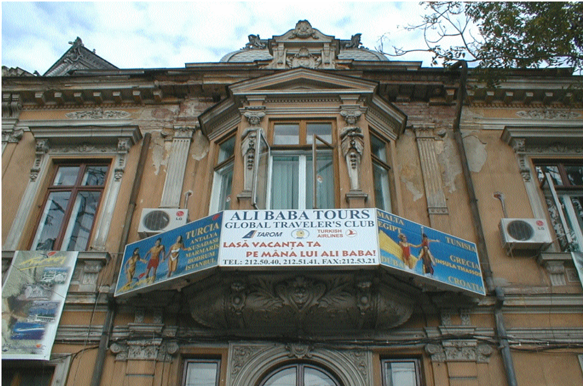
Bd. Lascăr Catargiu, sector 1, București (iulie 2008)