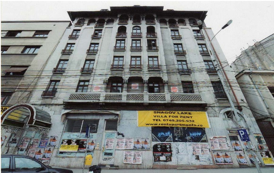
Pasajul Victoria și Hotel Muntenia, str. Academiei nr. 17-19, sector 1, București