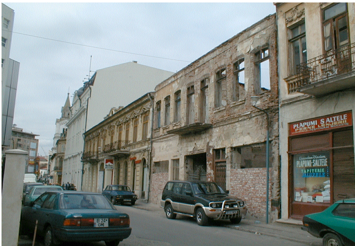
Imobilul din str. Bărăției nr. 35, sector 3, București (octombrie 2001)

Rezultatul unei astfel de intervenții poate fi ușor observat astăzi: distrugerea completă a substanței istorice și înlocuirea ei cu o construcție supradimensionată, cu un volum agresiv și o fațadă pastișă, care încearcă să o amintească pe cea originală.