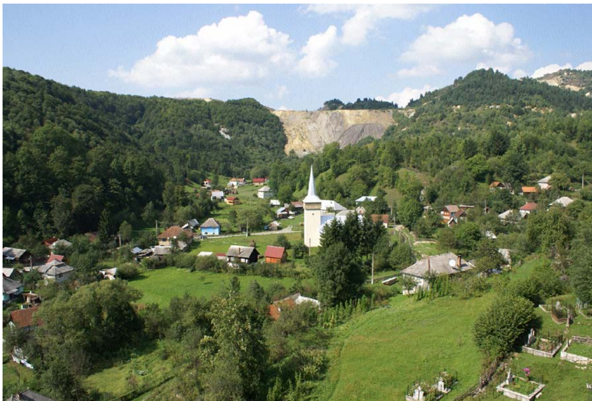
Roșia Montană, jud. Alba

Locuințe și gospodării tradiționale, biserici valoroase, monumente votive, comemorative sau funerare jalonează peisajul întregului sit. Așezarea actuală însumează un fond construit compus din clădiri ridicate între sfârșitul secolului al XVIII-lea și sfârșitul secolului al XIX-lea, pe o structură conturată încă din secolul XVII-lea.