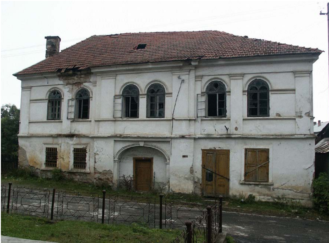
Imobil din centrul monument istoric (casa nr. 551), Roșia Montană, jud. Alba