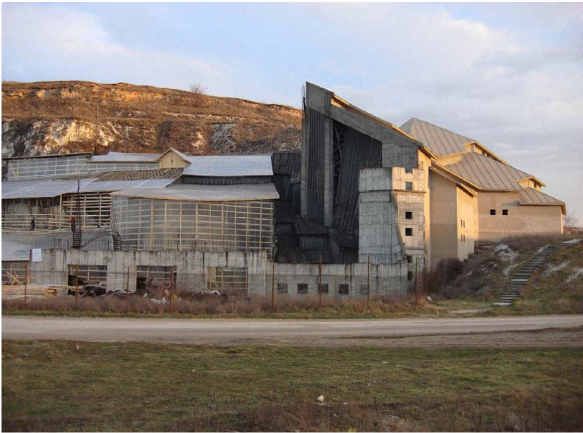
Monumentul rupestru de la Basarabi, acoperire de protecție improvizată, exterior