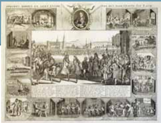
Opkomst, midden en geen eynde van den doortrapte John Law, gravure 1720

steden compagniën die zich toelegden op het verzekeren van schepen, ladingen, personen, huizen, het organiseren van loterijen en het belenen van actiën. De aandelen werden op den duur verkocht tegen bedragen die steeds minder overeenstemden met de waarde van het object. De koers liep soms op tot tienmaal de nominale waarde. In de loop van het jaar 1720 ontdekte men dat er nauwelijks dekking aanwezig was. Door het wegvallen van het vertrouwen daalde de prijs van veel actiën tot nul. De meeste compagniën werden binnen enkele jaren geliquideerd. Verzekeringsmaatschappij Stad Rotterdam bleef als enige tot het opgaan in Fortis ASR in het jaar 2000 tot in onze tijd bestaan. Talloze goedgelovigen werden het slachtoffer van de reusachtige speculaties in aandelen. Rijke adel, Nederlandse kooplieden en regenten die voor acties ingetekend hadden met voor die tijd enorme bedragen van 20.000 of 50.000 gulden, vormden geen uitzondering. Er werd zelfs gegokt met aandelen van de reeds langer bestaande Oost- en Westindische Compagnie (VOC