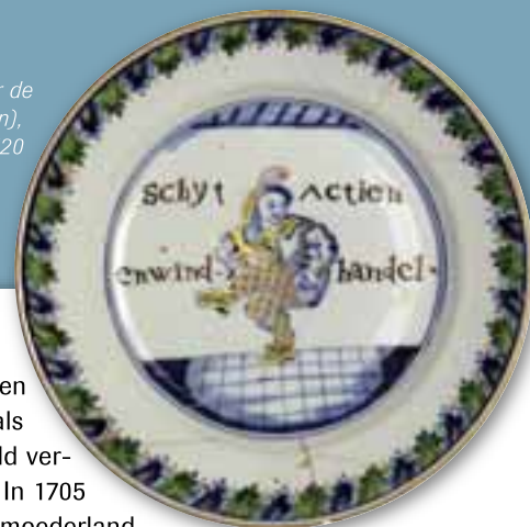
Chinees porseleinen bord over de windhandel in actiën (aandelen), Chine de commande, circa 1720