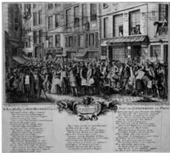
De straat Quinquampoix in Parijs was het centrum van de handel in waar-deloze aandelen, gravure door A. Humblot, 1720

naar de Nederlanden. In de periode 1702-1713 woonde hij met zijn vrouw en vanaf 1705 met zoon William in Den Haag en Amsterdam. Af en toe werd die periode onderbroken door een tijdelijk verblijf in het buitenland. In het economisch sterke Amsterdam maakte hij kennis met het fenomeen wisselbank, die wissels gedekt door de bezittingen van kooplieden en ondernemingen uitgaf. Die wissels werden ook wel verhandeld en vervulden daardoor de rol van papiergeld.