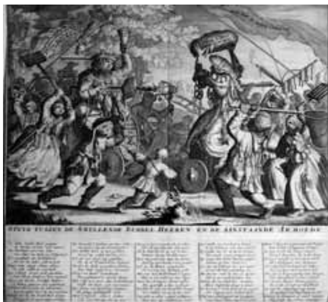
De smullende profiteurs tegenover de nieuwe armoedzaaiers, gravure, circa 1720

steden compagniën die zich toelegden op het verzekeren van schepen, ladingen, personen, huizen, het organiseren van loterijen en het belenen van actiën. De aandelen werden op den duur verkocht tegen bedragen die steeds minder overeenstemden met de waarde van het object. De koers liep soms op tot tienmaal de nominale waarde. In de loop van het jaar 1720 ontdekte men dat er nauwelijks dekking aanwezig was. Door het wegvallen van het vertrouwen daalde de prijs van veel actiën tot nul. De meeste compagniën werden binnen enkele jaren geliquideerd. Verzekeringsmaatschappij Stad Rotterdam bleef als enige tot het opgaan in Fortis ASR in het jaar 2000 tot in onze tijd bestaan. Talloze goedgelovigen werden het slachtoffer van de reusachtige speculaties in aandelen. Rijke adel, Nederlandse kooplieden en regenten die voor acties ingetekend hadden met voor die tijd enorme bedragen van 20.000 of 50.000 gulden, vormden geen uitzondering. Er werd zelfs gegokt met aandelen van de reeds langer bestaande Oost- en Westindische Compagnie (VOC