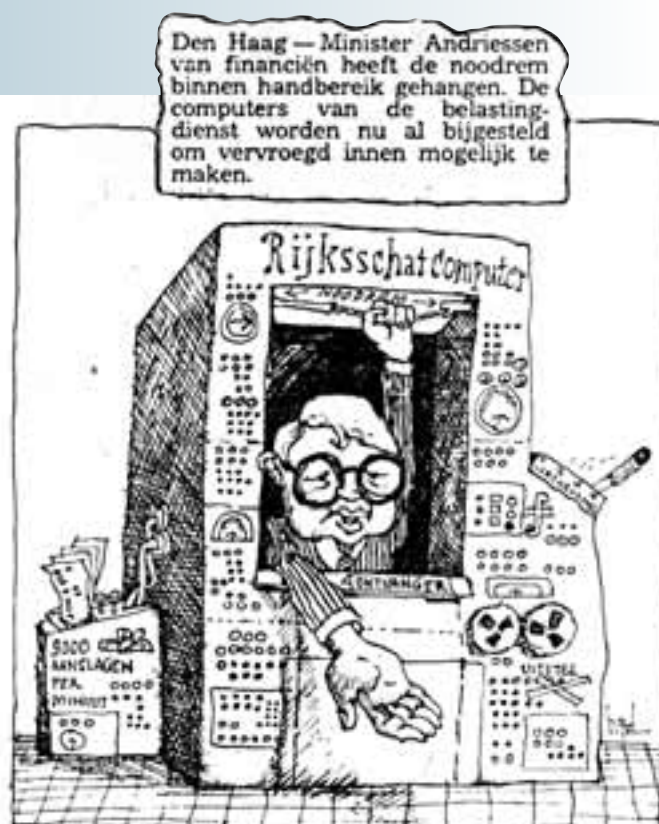
Spotprent door Ton Hoogendoorn, geplaatst in de Haagsche Courant van 30 april 1979

Daar bleef het niet bij. In een zaaltje was een flink aantal van die apparaten neergezet en de pioniers mochten ons inleiden in de geheimzinnige materie van MS-DOS codes en het tekstverwerkingsprogramma Q & A. Ze spraken van harde schijven, Borskischijven, modems, muizen en floppy's. Een wonderlijke wereld vol abstracte begrippen die haaks stond op mijn vakgebied waarin ik mij bekommerde om Chinees porselein, of koper en tin, dan wel schilderijen. Maar we moesten er aan geloven. De 'Dames van de typekamer' gingen iets anders doen. Voortaan was ons tyoscript meteen het origineel. En het kon in elke oplage worden uitgebracht.