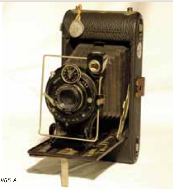
BDM 26965 A

Wat deze camera echt bijzonder maakt, is dat er een authentiek douaneloodje aan de zijkant is bevestigd. In de tas zit ook de originele douaneverklaring uit 1936, waarmee de eigenaar met de camera buiten de landsgrenzen kon reizen. De verklaring werd opgemaakt door de Visitatiepost Invoerrechten & Accijnzen te 's-Gravenhage.