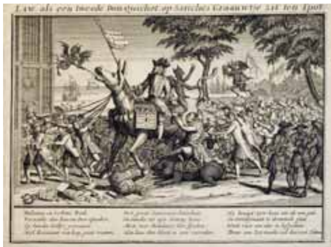
John Law als Don Quichot; de actiebijljetten vliegen uit de aars van de ezel, gravure, 1720