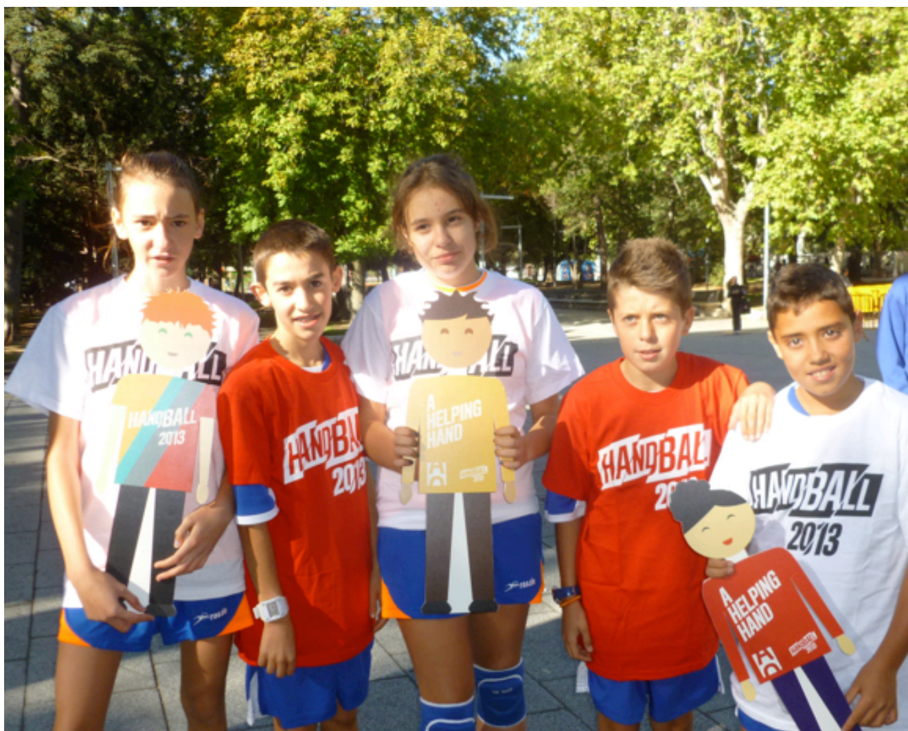
Un grupo de participantes de la Jornada de Balonmano en la Calle posa con los handballines oficiales del torneo.

En este sentido se han llevado a cabo varias acciones, como en Zaragoza o Extremadura, aunque la más sonada, sin duda, fue la jornada de balonmano en la calle de Palencia, que incluyó una charla de Rafa Guijosa, elegido mejor jugador del mundo en 1999, para los participantes y otra para los entrenadores.