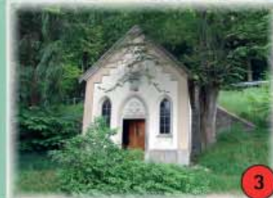
3 Zwieselbergkapelle Böhmzwiesel Die Renovierung der 1838 erbauten und der heiligen Maria geweihten Kapelle erfolgte im Jahr 1983.