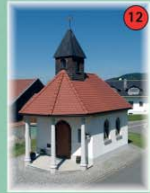
12 Dorfkapelle Stierberg Den Kapellen aus den Jahren 1874 und 1960 folgte durch die Anlage eines Dorfplatzes der Neubau einer kleinen Kirche in der Dorfmitte im Zuge der Dorferneuerung. Diese heutige, im Jahr 1991 dem heiligen Florian geweihte Kapelle enthält kunstvoll gestaltete Glasfenster mit Heiligenmotiven.