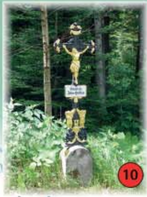
10 Feldkreuz im Stierberger Holz Errichtet wurde das Feldkreuz zur Erinnerung an ein nur 14 Tage lang verheiratetes Ehepaar, das 1914 durch einen Blitzschlag bei der Feldarbeit getötet wurde. Die Restaurierung im Jahr 1993 übernahm die LE Böhmzwiesel.