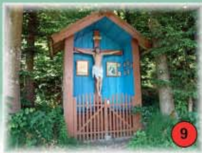
9 Kapelle auf dem Ranzinger-Hof Schlößbach Um 1860 erbauten die damaligen Hofeigentümer Geschwister Süß die Kapelle.