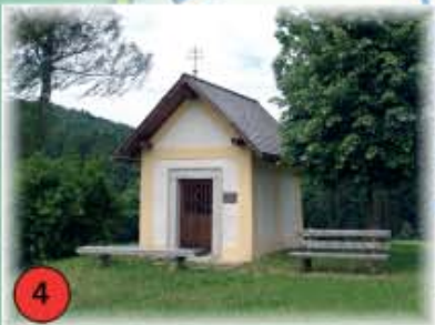
4 Marienkapelle bei Ensmannsreut Die 1708 erbaute Feldkapelle war schon nach 40 Jahren baufällig. 1749 wurde die jetzige Marienkapelle fertiggestellt, was die Jahreszahl am Türsturz zeigt. Nach erneuten Bauschäden erfolgte die Sanierung der barocken Kapelle 1997 im Zuge der Dorferneuerung.