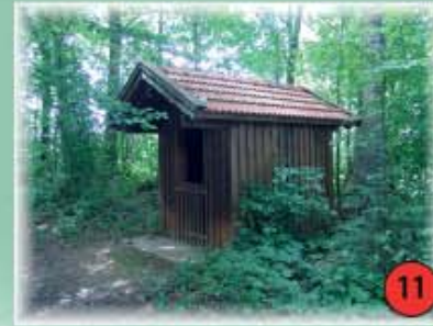
11 Waldkapelle Stierberg Die aus Holz vermutlich im 16. Jahrhundert errichtete Kapelle steht nördlich von Stierberg an einem Hohlweg im Wald.