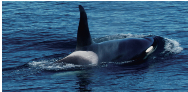
図 1. 成熟した雄のシャチ