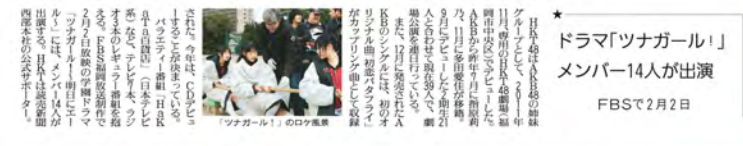
「ツナガール」のロケ風景