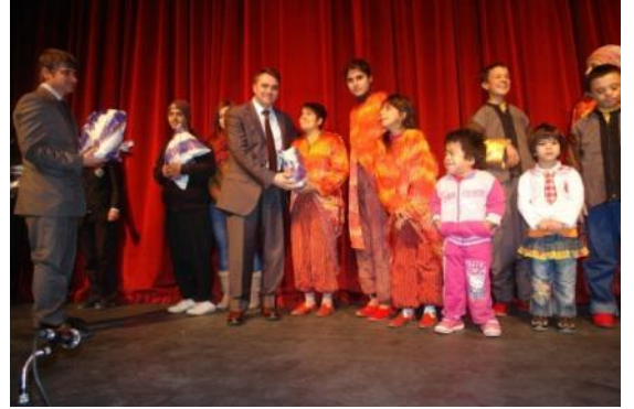
konulu resim şiir ve kompozisyon