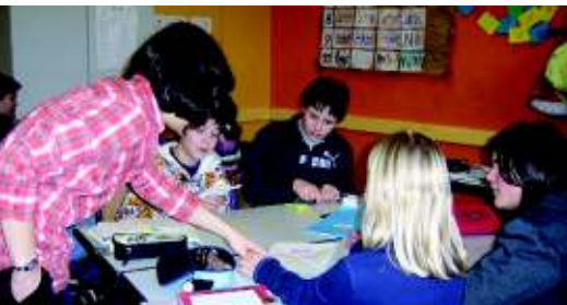
Gruppenarbeit in der GTS

(Auszug aus unseren Grundregeln des Zusammenlebens)