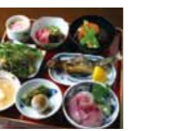
ウド、ゼンマイなどの山菜や五箇山豆腐の料理も美味しい