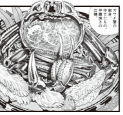
【お問合わせ】☎0766-84-1331 射水市中央町 19-31