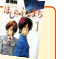
【お問合わせ】☎0763-66-2555 南砺市相倉 591