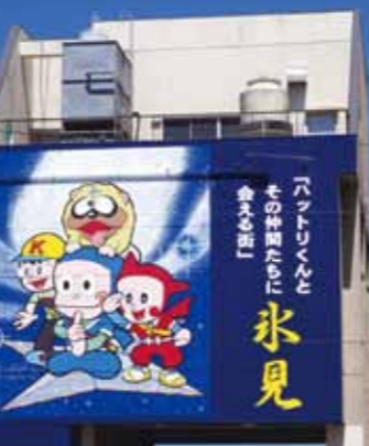
氷見漁港内、海鮮館横の巨大壁画