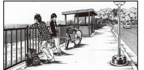
国道160号線沿いにある加越能バス菟田停留所(第1巻) 氷見市菟田

氷見市菟田を舞台に、実在するスポットを正確に背景で描写した驚きの作品。氷見と高岡の市街地も登場します。菟田バス停を起点に散策しながら、作品の中の景色を探してみましょう。