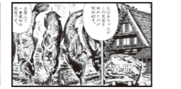
【お問合わせ】☎0763-66-2555 南砺市相倉 591