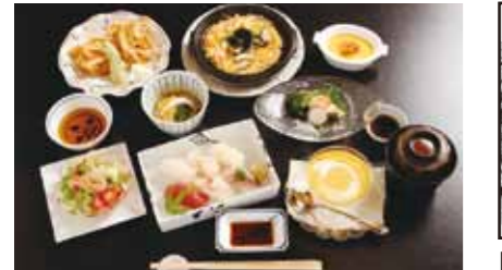
「にぎり寿しと白海老満喫御膳」

魚港の町、新湊で水揚げされた富山湾のカニとエビを地元の割烹で食べ比べます。カニの旬は冬場になりますが、春先からの季節は白エビ漁が最盛期を迎え、様々な料理が楽しめます。