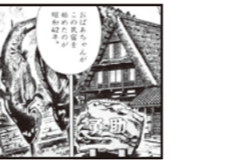
【お問合わせ】☎0763-66-2555 南砺市相倉 591