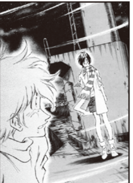
菟田漁港の防波堤にある赤灯台(第1巻) 氷見市菟田