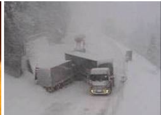
(H22.1.13) スリップによる事故