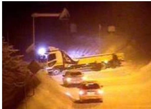
(H22.1.13) 登坂不能による交通阻害