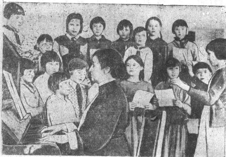
В гор. Череповце 1 мая организуется интернациональный вечер самодеятельности детей. На снимке: разучивание грузинских народных песен учащимися 3-й и 2-й школ.